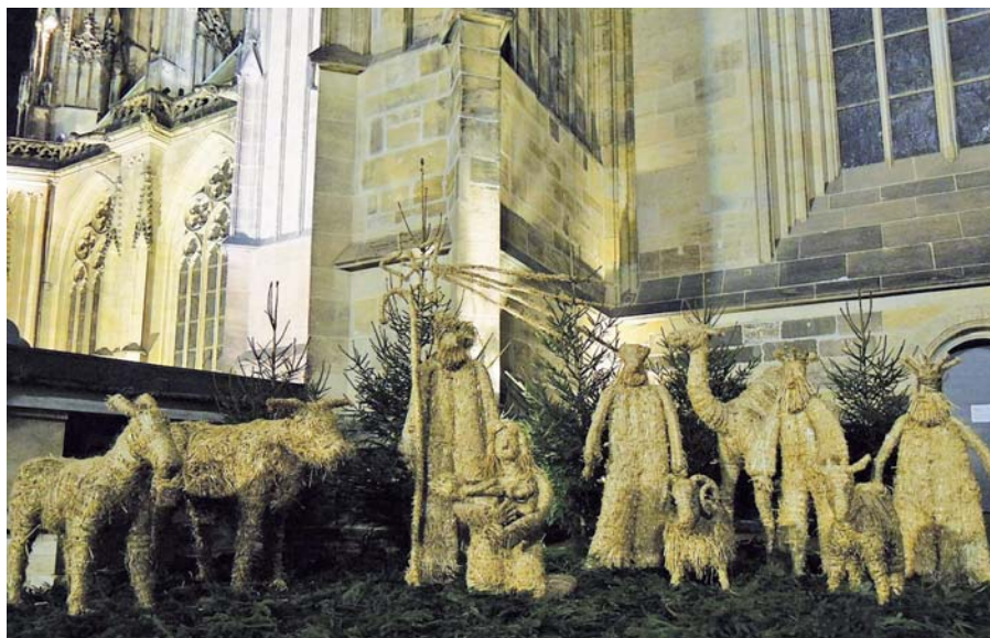
Betlém u katedrály sv. Víta.

svatého Václava. Prosím vás, zasněte se na chvíli a nechte znít slovům velehradské písně: „Velehrad náš, ten rozkvétá vždy znova a žádná moc nám už jej nerozboří; pokud náš národ v hloubi srdce chová důvěru k Matce, která divy tvoří...“