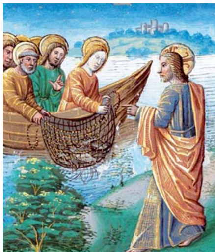
Žázračný rybolov (15. stol.).

Z čítanky „Víra Církve“ sestavené z textů Josepha Ratzingera