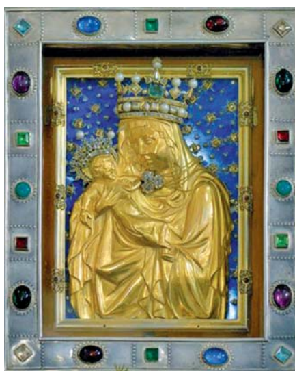
Palladium země české.

Jak tento novoroční pastýřský list začít? Napadají mě slova novoročního projevu Václava Havla z 1. ledna 1990: „Naše země nevzkvétá!“ Po desítkách let, kdy jsme slýchávali, že naše budování dosa-