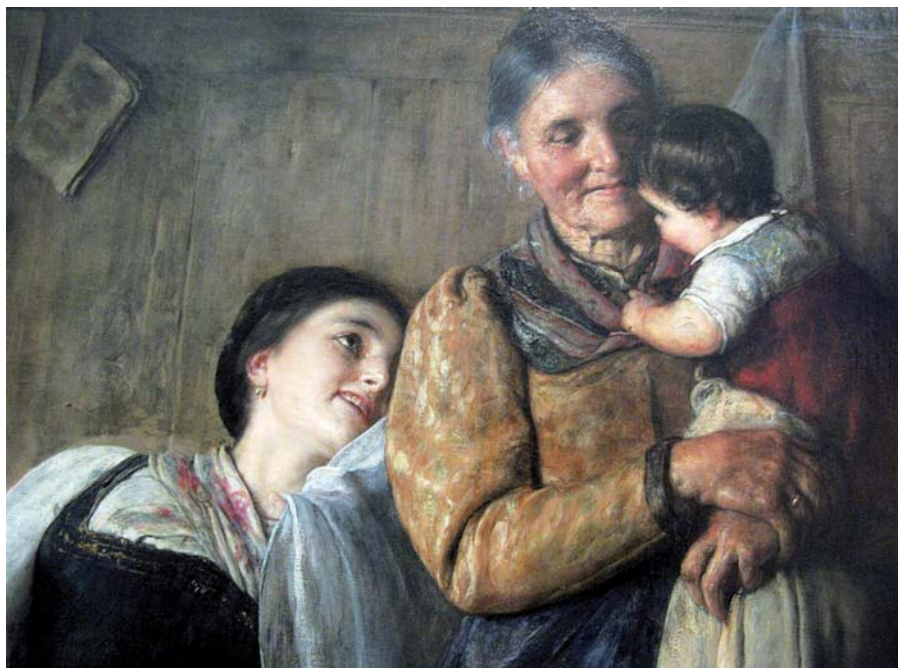
Nikolaos Gyzis: Jukaná, detail (1882). Foto: Tilemahos Efthimiadis, Wikimedia Commons (CC BY 2.0)

tomnosti. Zde je ono zapouštění kořínků do rodné hroudy. Ano, prarodiče se mohou stát klíčovými postavami při utváření vlastního já mladého člověka. Je na nás, na naší zodpovědnosti, zda jim otevřeme potřebný časový prostor. Prodlužováním věku odchodu do důchodu prarodičům časový prostor pro jejich důležitou spoluúčast při socializaci dítěte uzavíráme.