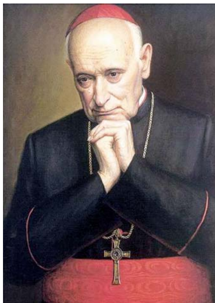
Kardinál József Mindszenty.

ve městě pomoc sociálně potřebným rodinám a podporoval studenty z chudých rodin. Angažoval se i v oblasti médií: založil noviny a tiskárnu a snažil se o šíření tiskového apoštolátu. Ve svých textech se zabýval také palčivými sociálními otázkami doby a varoval před nebezpečím komunismu a nacismu.