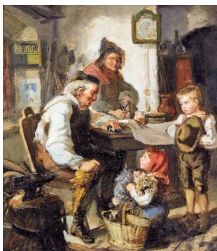
Ludwig Knaus: Dědeček a vnoučata (1862) Foto: http://www.liveinternet.ru

ní, že lidé, kteří zanechají zaměstnání až v 65 letech věku, většinou předčasně umírají po dvou až třech letech. Naproti tomu lidé, kteří odešli do důchodu v 55 letech, se velmi často dožívají až 80 let. Důvodem zkrácení dožití je podle lékařského zdůvodnění závěrů tohoto průzkumu skutečnost, že starší lidé v zaměstnání dostávají příliš zabrat, protože musí dostát nárokům kladeným na mnohem mladší zaměstnance. Ke stresovým situa-