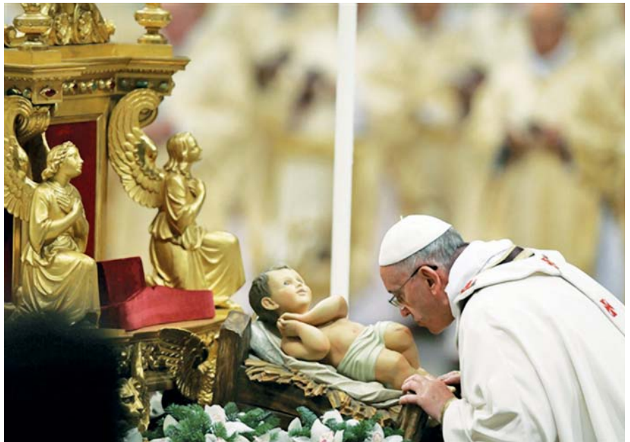
Slavnost Narození Páně v bazilice sv. Petra.

A sám Bůh lásky a pokoje nechť dá vašemu srdci mír a bezpečně vede vaše kroky. Skrytostí své tváře ať vás skryje před lidskými zmatky, dokud vás jednou nevede a neusadí tam, kde v jeho plnosti budete navěky přebývat v líbeznosti klidu a míru, ve stáncích utěšených a v bezpečné blaženosti.