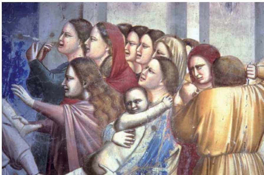
Giotto di Bondone: Vražďení neviňátek, detail (1304–1306).