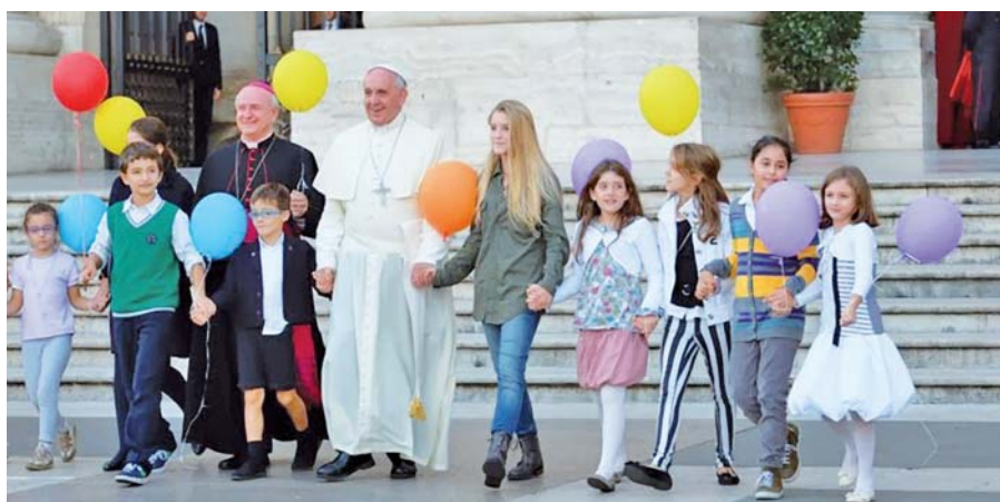
Papež František a kardinál Paglia při setkání s dětmi během pouti rodin.

Návštěva ad limina rakouského episkopátu se ohlašovala dosti ponuře. Ještě před příjezdem do Říma udělil kardinál Schönborn Vatikánskému rozhlasu rozhovor, ve kterém se netajil neslavnou situací místní církve. I když prý není až tak zlá, jak to líčí média. Tak například farářská iniciativa vybízějící ke vzpouře proti papeži (samozřejmě tomu předchozímu) přilákala jen nevelkou část rakouského kléru. Kardinál Schönborn nicméně přiznal, že život rakouských katolíků se odehrává daleko od Církve. Ačkoli do katolické církve patří oficiálně 89 % Rakušanů, sotva 6 % jich přijde na nedělní mši, ve Vídni jen necelá 2 %. Rakouský primas se svěřil, že neví, co se děje v srdcích těch ostatních, čím žijí, a velmi jej to rmoutí. Rád by šel k hledajícím, aby ukazoval cestu návratu ke Kristu. Ale jak – to je otázka! Vídeňského metropolitu na druhou stranu potěšil velký zájem Rakušanů o vatikánský dotazník ohledně rodiny. Je přesvědčen, že jde o dobré znamení.