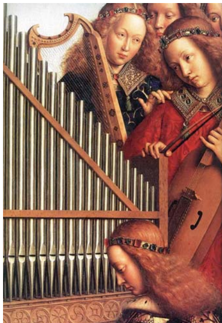
Jan van Eyck: Gentský oltář, detail (15. stol.)

Z čítanky „Víra Církve“ sestavené z textů Josepha Ratzingera