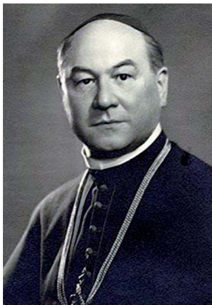
Blahoslavený Vilmos Apor.

kněz vedle duchovní služby zaměřil také na sociální práci. Byl znám svým obětavým přístupem k chudým a potřebným, za což byl také nazýván „proboštem chudáků“. V meziválečné době založil v Gyule několik charitativních institucí, mimo jiné domov pro sirotky a opuštěné děti.