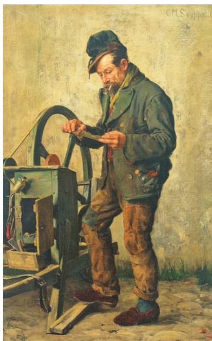
Carl Maria Seyppel: Brusič nožů.

To ale není číslo konečné, protože každým rokem věk odchodu do důchodu prodloužujeme, a tím mezigenerační obměnu blokuje ve stále větším rozsahu! U mužů se prodloužuje věk odchodu do důchodu o 2 měsíce ročně, u žen o 4 měsíce ročně, tj. v průměru o 3 měsíce ročně, jinak řečeno o čtvrt roku za každý uplynulý kalendářní rok. To představuje blokaci dalších 0,7 % míst na pracovním trhu ročně, což vyvolává automaticky úbytek 34 300 pracovních příležitostí ročně pro nastupující mladou