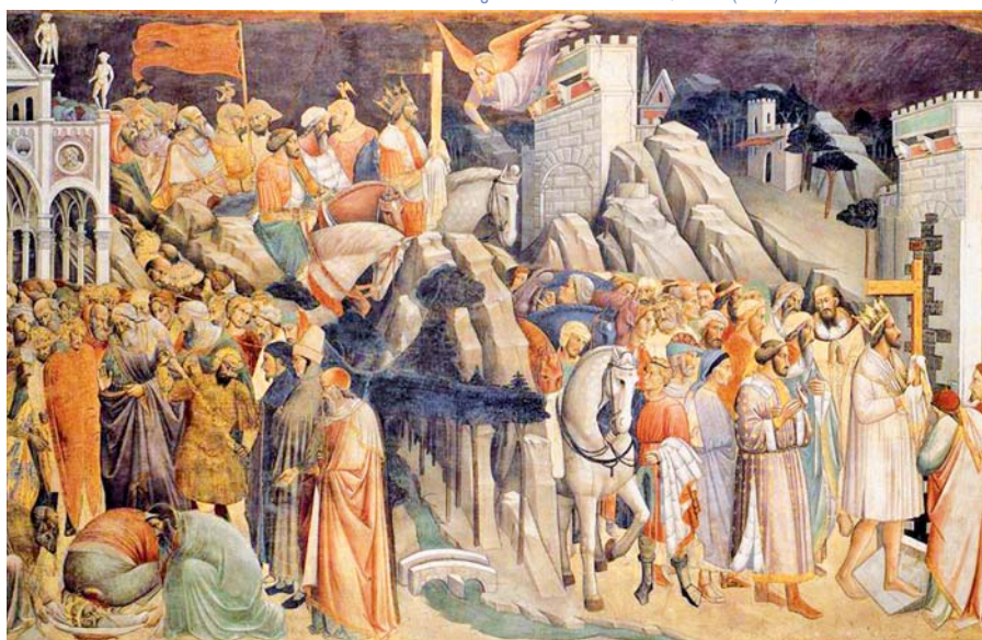
Agnolo Gaddi: Triumf kříže, detail (1380).

Když přijmeme Ducha Svatého do svého srdce a necháme jej působit, sám