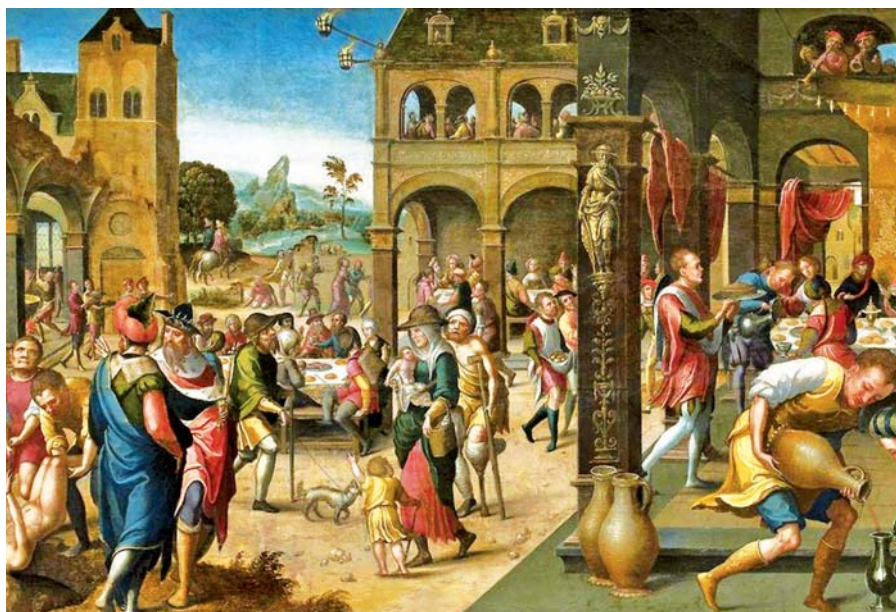
Monogramista z Brunsvíku: Podobenství o velké hostině (1525).

Každý způsob duchovního života, který s opravdovou poctivostí usiluje o lásku Boží a pro Boha také o lásku k bližnímu, je Bohu obzvláště milý... Je to přece láska, kvůli níž se všechno má nebo nemá stát, má nebo nemá změnit. Ona je počátek i konec, východisko i cíl všeho směřování. Rozhodně není hříšné nic, co se děje opravdu kvůli lásce a z lásky. A tuto lásku kéž nám milostivě v hojnosti dá ten, jemuž se bez lásky nemůžeme líbit a bez něhož nemůžeme vůbec nic. Ten žije a kraluje jako Bůh po všechny věky. Amen.