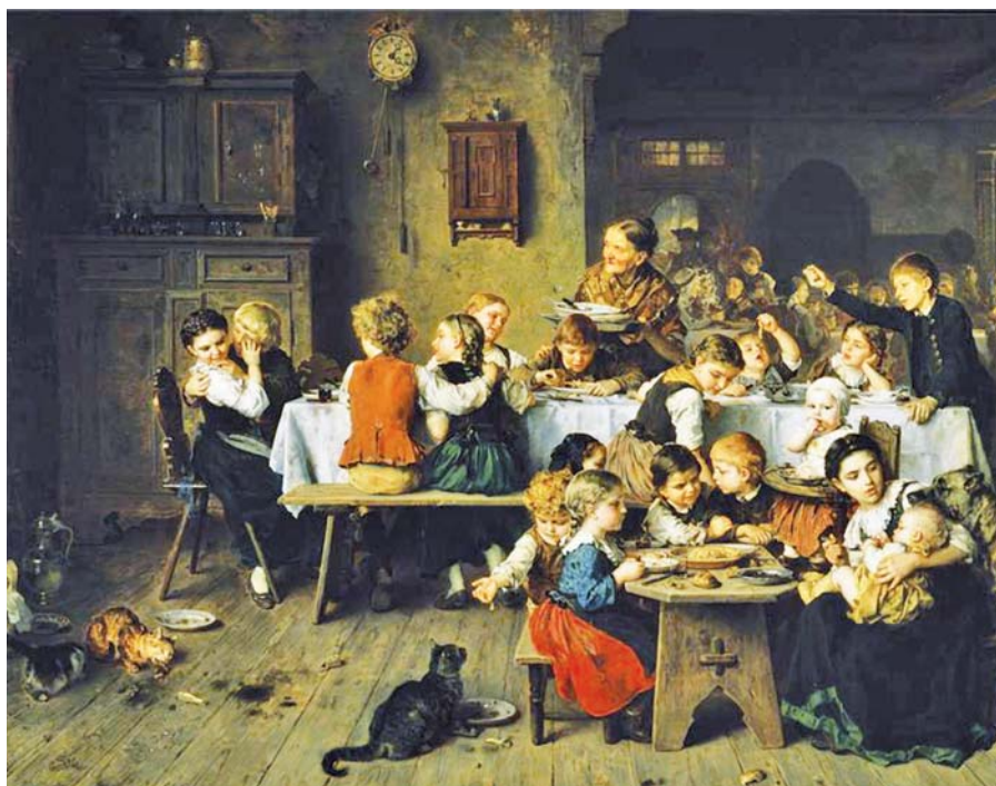
Ludwig Knaus: Dětská párty (1868).

homosexuálního starobního důchodce. Současné aktuální ztráty na důchodovém účtu způsobené homosexuály lze vyčíslit. Při údajné frekvenci výskytu 4 % homosexuálů v populaci a zohlednění vkladu ne-rodičů homosexuálů z daní přerozdělených na výchovu dětí těch druhých, je výpočet následující: [(4 % z 350 miliard