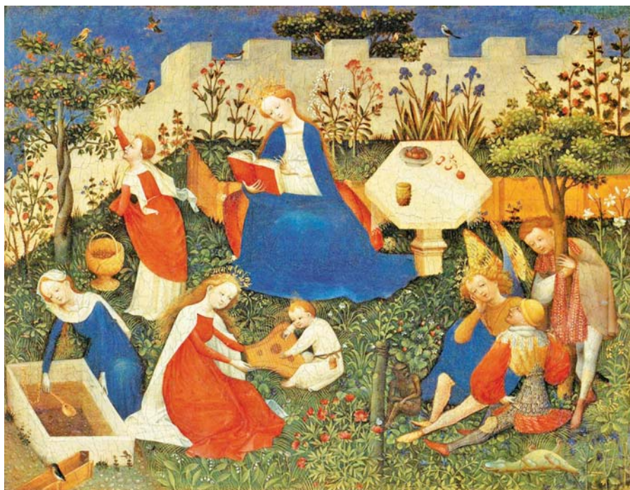
Mistr z Horního Porýní: Panna v rajské zahradě (15. stol.).

Dobře je také řečeno: Člověk bohobojný se varuje zlého. Neboť svatá Církev vyvolených začíná cesty své bezúhonností a poctivostí bázní, ale dovršuje je láskou. V Církvi svatě platí, že se zlem se zásadně rozejdeme tehdy, když se z lásky k Bohu rozhodneme, že již nechceme hřešit.