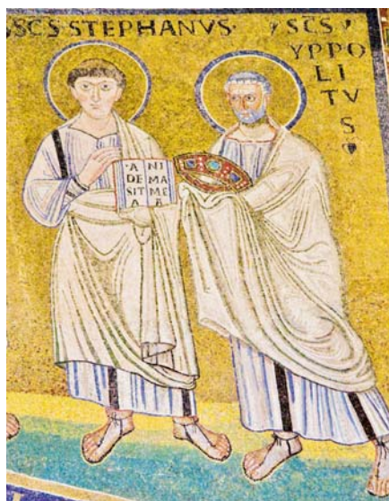
Hippolyt nabízí svatému Štěpánovi mučednickou korunu (San Lorenzo, 6. stol.).

třetího století, Církev přes časté pronásledování rostla. Už to nebyly jen malé skupinky učedníků, ale čím dál početnější, bohatě strukturované obce. S počtem věřících rostlo i množství problémů, s nimiž se Církev musela vyrovnat. Pastýři se mnohem častěji setkávali s vážným selháním věřících, ať už byl důvodem