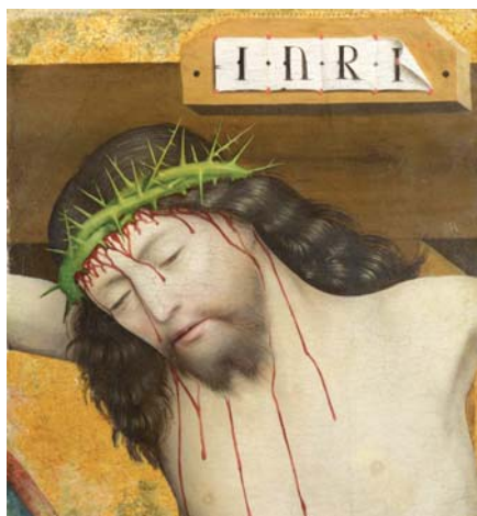
Mistr z Liesbornu: Ukřižovaný Kristus (cca 1480) Foto: http://catholicityandcovenant.blogspot.cz

A tu jsem teprve pochopila, že přede mnou stojí Malý princ, který řeší největ-