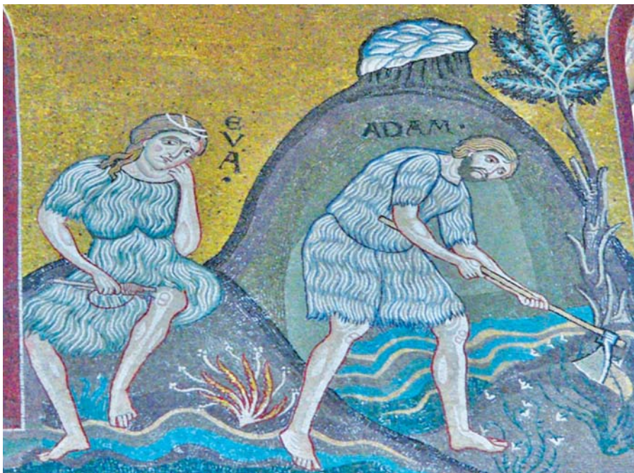
Adam a Eva (Monreale, 12. století).

K otázce genderu se pak konkrétněji vyjádřily o několik let později úřady (dikasteria) římské kurie. Jedná se o dokument Papežské rady pro rodinu: Rodina, manželství a „fakticky existující soužití“ z roku 2000. V něm se mluví o postupné destrukci instituce manželství, při níž nelze podceňovat tzv. „gender“ ideologii. Člověk jako muž a žena by nebyl zásadně podmíněn svým pohlavím, nýbrž kulturou (č. 8). Konkrétně na téma genderového přístupu k ženské otázce pak reagovala Kongregace pro nauku víry pod vedením kardinála Ratzingera, která v roce 2004 vydala List biskupům katolické církve o spolupráci mužů a žen . Když osvětluje myšlenkovou koncepci genderu, mluví o dvou tendencích, z nichž jedna silně zdůrazňuje podřízenost ženy ve snaze vyvolat spor. Žena, aby byla sama sebou, stává se soupeřkou muže . Druhá tendence ve snaze zabránit dominantnímu postavení jednoho nebo druhého pohlaví směřuje ke smazávání jejich rozdílností, které jsou považovány pouze za výsledek historicko-kulturní podmíněnosti . Toto pojetí člověka je odmítnuto: Tato antropologie, která zamýšlí hájit úsilí o rovnost ženy a její osvobození od biologického determinismu, ve skutečnosti inspirovala ideologie, které podporují např. zpochybnění rodiny s její přirozenou strukturou dvou rodičů, tedy otce a matky, zrovnoprávnění homosexuality s heterosexualitou a nový model polymorfní (mnohotvaré) sexuality (č. 2). Kongregace naopak zdůrazňuje biblic-