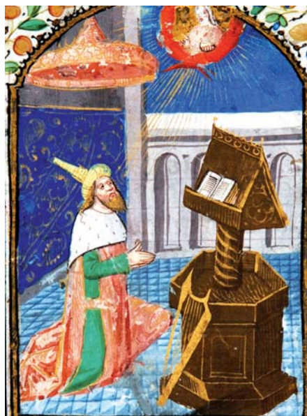
Král David se modlí kající žalmy (15. stol.).

Z čítanky „Víra Církve“ sestavené z textů Josepha Ratzingera