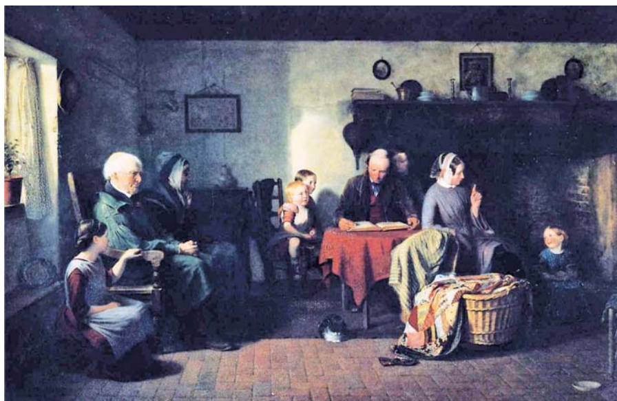
Thomas Webster: Nedělní večer (1858).