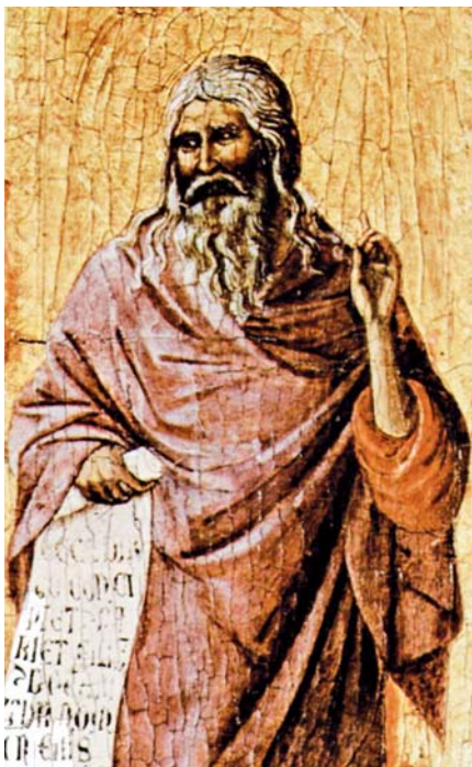
Duccio di Buoninsegna: Prorok Izajáš (1308–1311)

Nás na tom úryvku nic neudiví, protože ho vnímáme jako proctví o Mesiáši, které se už potvrdilo jeho příchodem na svět. Ale zkusme se v duchu přenést do Jinojášovy doby. Představme si, že v naší ulici najednou začne nějaký chlap tvrdit, že k němu mluví Hospodin (už to je podezřelé) a navíc se vytahuje, že je Božím služebníkem a že se jím Bůh proslaví. No, to je přece nehorázné! Když už k němu mluví Hospodin, aspoň kdyby říkal: „Jednou přijde můj Služebník,