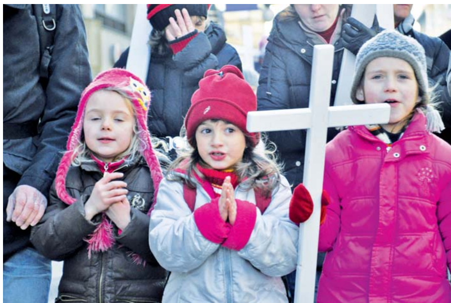
Pochod pro život Praha 2013.

Díky lidské obětavosti a ochotě se koná v Praze každoročně Pochod pro život, kterého se účastní tisíce lidí na důkaz touhy obnovit v naší zemi úctu k lidskému životu od okamžiku početí.