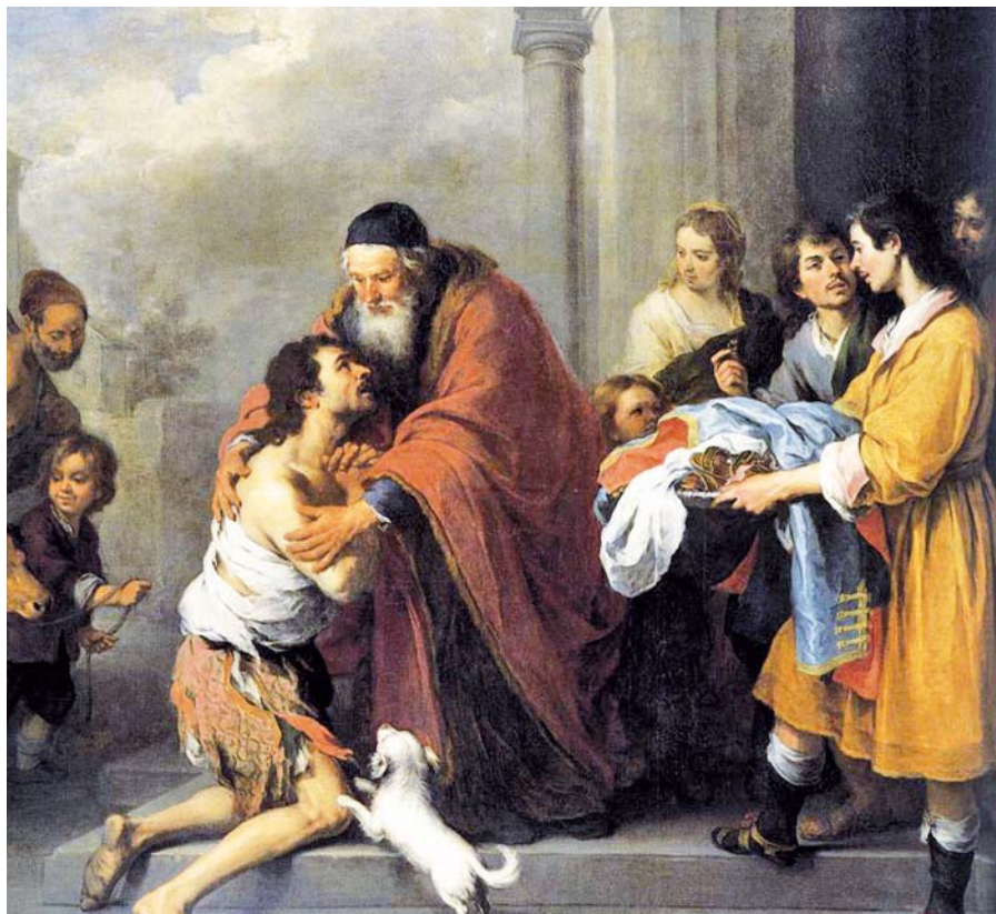
Bartolomé Esteban Murillo: Návrat marnotratného syna (1667–1670).