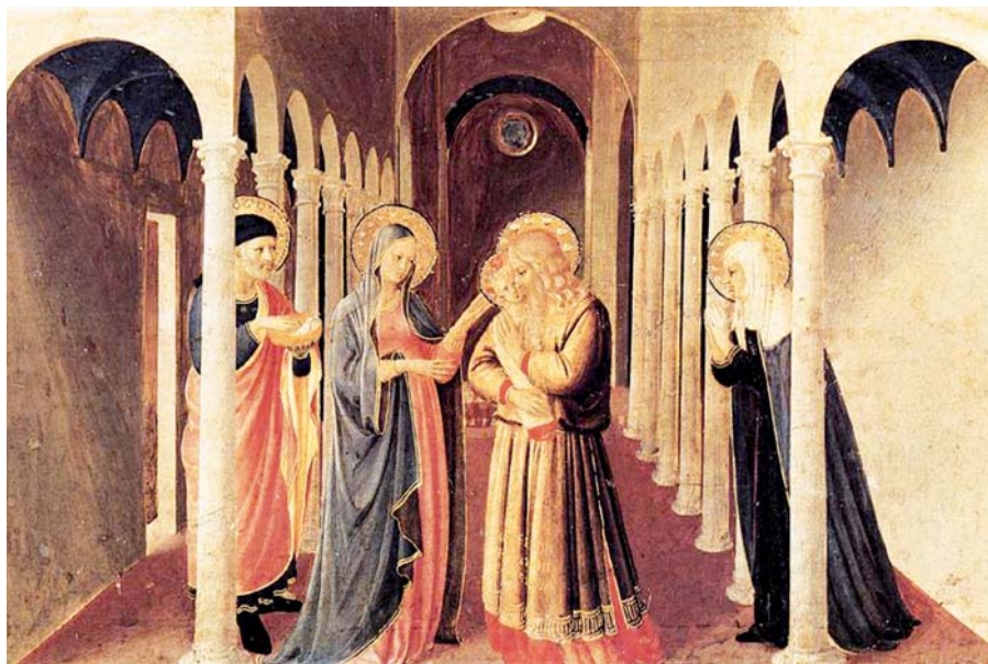
Fra Angelico: Uvedení Páně do chrámu (1433).

Píši vám tento dopis v den, kdy slavíme svátek Uvedení Páně do chrámu. Evangelista Lukáš vypráví, že Panna Maria a svatý Josef přinesli dítě do chrámu, jak žádal Mojžíšův zákon, aby je obě-