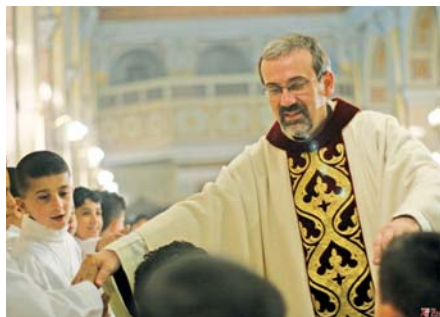
Fr. Pierbattista Pizzaballa OFM