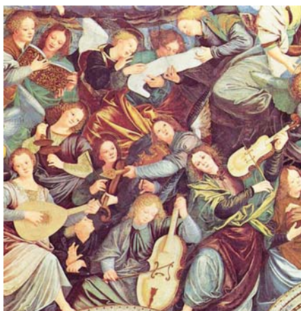
Gaudenzio Ferrari: Andělští hudebníci (1540)

goriánský zpěv se má tedy hojně zavádět k bohoslužebným úkonům, a buďte všichni přesvědčeni, že žádný církevní úkon nepozbude na své slavnosti, i když nebude doprovázen jinou hudbou než jenom touto. Obzvláště budiž bedlivě zaváděn gregoriánský zpěv mezi lid, aby věřící zase byli činněji účastni církevních obřadů, jak bývalo za starodávna.“ 2