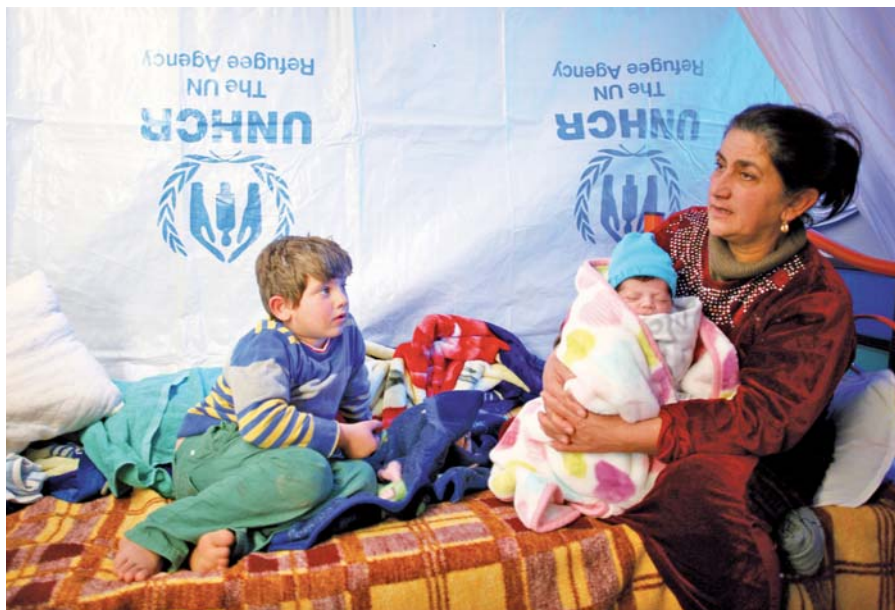
Fotografie na této dvoustraně: Uprchlícké centrum v iráckém Erbilu.

Odpovědi na tyto otázky jsou těžké a zároveň velmi jednoduché. Kurdy zajímá pouze nezávislý Kurdistan. Vše ostatní je pro ně nezajímavé, respektive zajímavé pouze do té chvíle, dokud to umějí využít ve svůj prospěch. Křesťané jsou momentálně velmi vhodným artiklem na prodej. Kurdové je využívají k tomu, aby světu ukázali, jak jsou tolerantní vůči křesťanům a křesťanským menšinám. Je to velmi oportunistické jednání. Jakmile to pro Kurdy přestane být výhodné, křesťany z Kurdistanu zřejmě vyhodí. Minimálně uprchlíci z jiných regionů Iráku v Kurdistanu nemají žádnou budoucnost. Bud se vrátí domů nebo se rozplynou ve velkém světě. Z 1,7 milionu křesťanů v Iráku po dvou desetiletích zůstalo necelých 400 tisíc. Většina z nich přežívá v uprchlických centrech, kde čekají, co se stane. Pokud se nebudou moci vrátit domů, zmizí. V Libanonu, Jordánsku, v Evropě. Nejstarší křesťanské komunity na světě prostě přestanou existovat. Aramejščina, kterou mluvil Kristus, může být za pár let na pokraji vymizení. Většina z těch, kteří problematice rozumějí, odhaduje, že v Iráku zůstane do 50 000 křesťanů, což znamená, že zde fakticky nebudou. Pro zachování komunity je to žalostně málo.