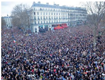
Pařížský pochod proti terorismu

Jak později komentoval vatikánský specialista na islám Samir Khalil Samir, jejich prohlášení byla rozumná a vyvážená. Když však mluvili o tom, že islám nemá s útoky nic společného, bylo možné postřehnout jisté rozpaky – dodal egyptský jezuita. – Věděli totiž, že fakta mluví jinak. 80 % všech teroristických atentátů