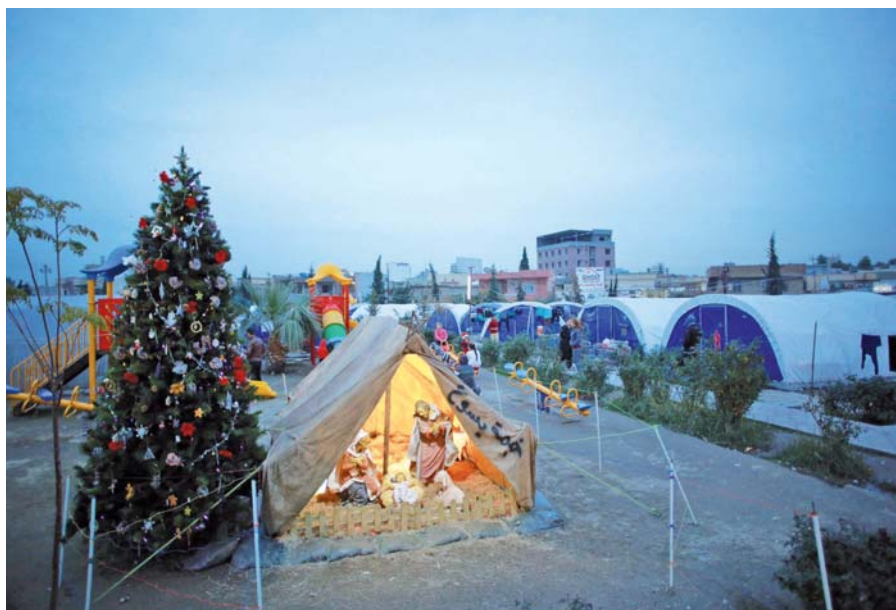
Betlém v uprchlickém centru Mar Elia v iráckém Erbilu.

Vánoční poselství papeže Františka Urbi et Orbi