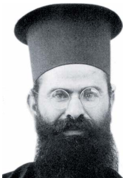
Blahoslavený Kamen Vičev.

profesorem filosofie a následně i prefektem studií a ředitelem koleje sv. Augustina v Plovdivu. Tyto funkce vykonával až do likvidace školy komunisty v roce 1948. Kolej měla vynikající pověst a stala se jedním z center vzdělávání bulharské