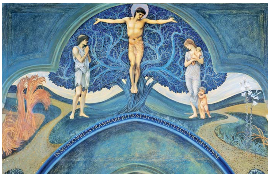
Edward Burne-Jones: Strom života (1888).

Katecheze papeže Františka na generální audienci