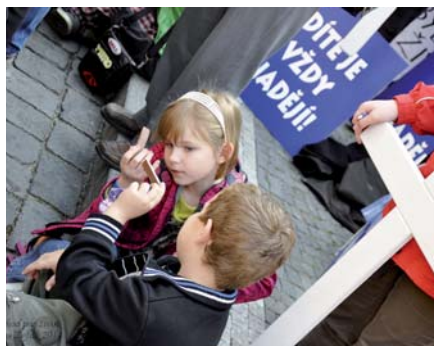
Pochod pro život.

Videa vzbuzují otázky, zda tato organizace odebírá a prodává orgány potracených dětí.