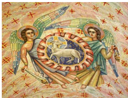
Agnus Dei (mozaika v kapli Nejsv. Svátosti ve Westminster-ské katedrále).

aby světlo Kristovo osvětlovalo naši cestu do budoucnosti. Ve věroučné konstituci o Církvi učí Druhý vatikánský koncil, že „světlo národů je Kristus... který již vyzařuje na tváři Církve“ (č. 1). Svatý Pavel říká: „(Kristus) je dříve než všechno (ostatní) a všechno trvá v něm“ (Kol 1,17). Ježíš je centrem všeho, je gravitační silou, která drží pohromadě náš mravní vesmír.