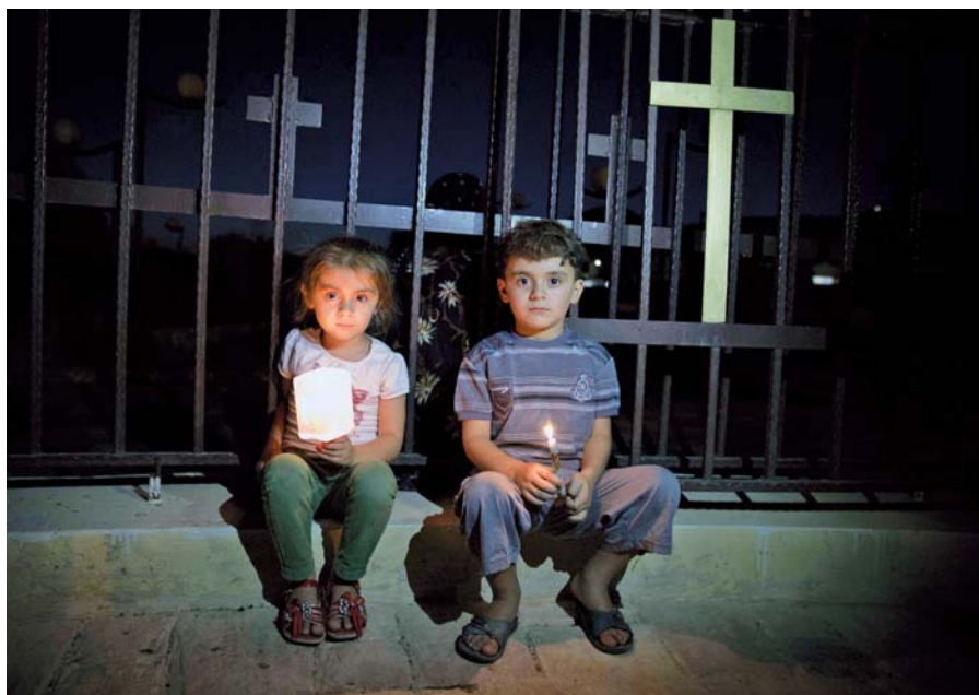
Děti azyrských křesťanů prochajících z Mosulu.

Budeme-li se Pánu líbit v tomto čase, dostaneme i ten budoucí; slíbil nám přece, že nás vzkřísí z mrtvých a budeme s ním kralovat , budeme-li žít tak, abychom ho byli hodni, a budeme-li věřit.