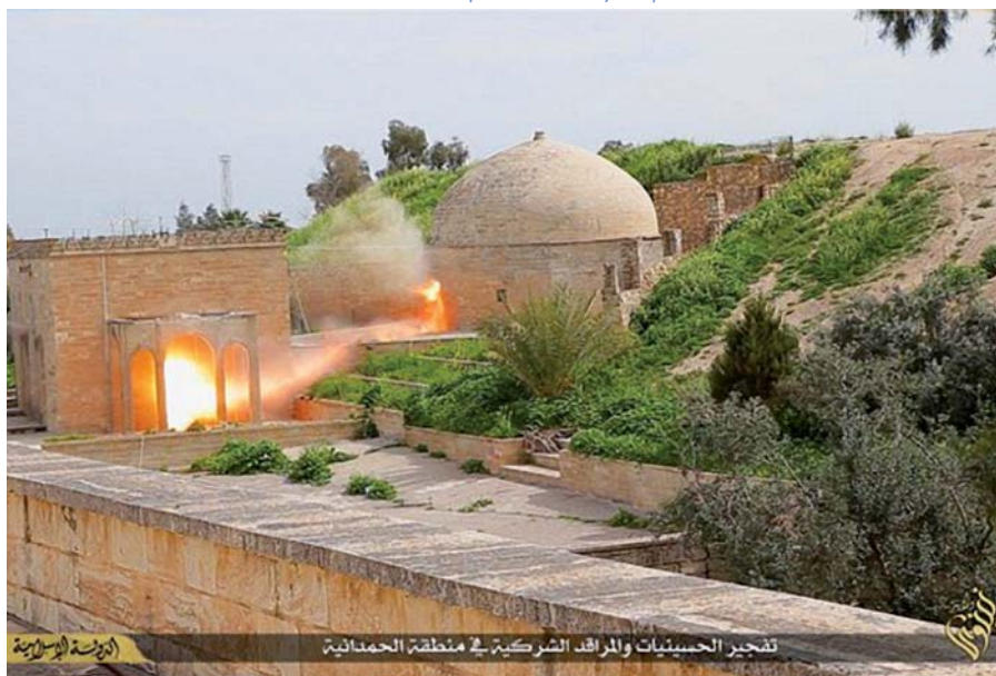
Ničení kláštera Mar Behnám poblíž Mosulu bojovníky tzv. Islámského státu.