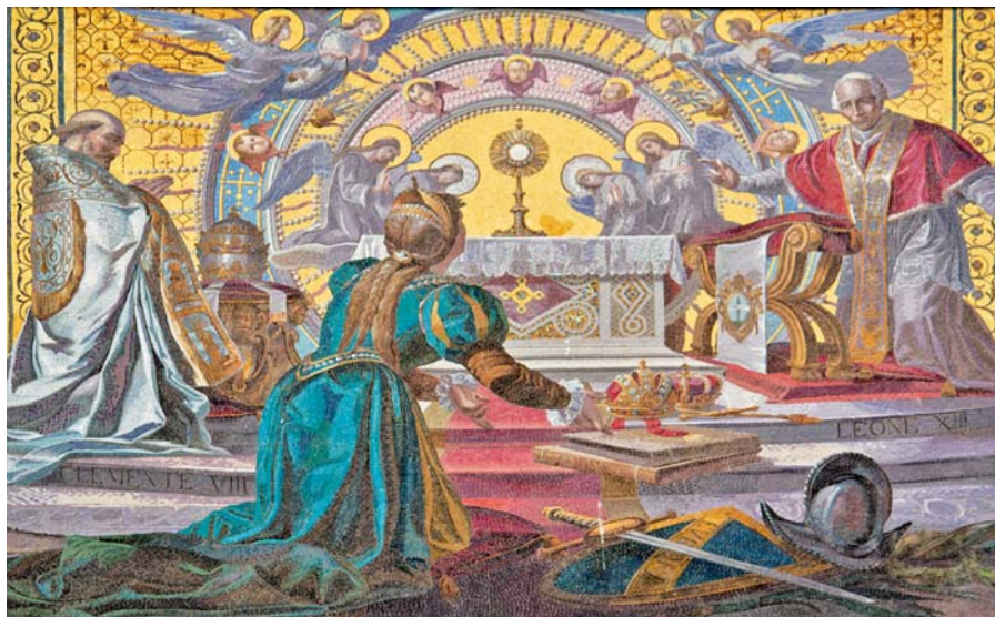
Lev XIII. vybízí Evropu k adoraci Nejsvětější svátosti (detail mozaiky v kostele sv. Jáchyma v Římě)

Církev, strážkyně mocné Přítomnosti Ježíše Krista v celých dějinách a v každé době, se tedy svoláním této poslední sy-