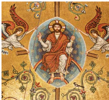
Kristus, pravý vinný kmen (Westminsterská katedrála)

a plodného vztahu lásky, ve zdraví i v nemoci, v bohatství i v chudobě, v dobrém i zlém. Trvalá, věrná, vědomá, pevná a plodná láska je stále častěji vysmívaná a zahlíží se na ni jako na cosi zastaralého. Zdá se, že právě nejrozvinutější společnosti mají nejnižší procento porodnosti a nejvyšší procento potratů, rozvodů, sebevražd a znečištění jak přírodního, tak sociálního prostředí.