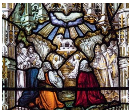
Blaze těm, kdo jsou pozváni k Beránkově svatební hostině

Timothy P. Broglio (nar. 1951) působí od roku 2008 jako arcibiskup v arcidiecézi ozbrojených sil USA. Na Boston College absolvoval klasická studia, v roce 1977 byl po studiích teologie v Římě vysvěcen na kněze; poté strávil dva roky prací ve farnosti ve svém rodném Clevelandu – toto období popisuje jako „nejlepší léta mého života“. Poté se vrátil do Říma kvůli studiu na Papežské církevní akademii a pracoval v diplomatických službách Svatého stolce. Než se ujal práce na nunciatuře na Pobřeží slonoviny a v Paraguayi, získal na Papežské univerzitě Gregoriana doktorát z kanonického práva. Později, než byl jmenován nunciem v Dominikánské republice a apoštolským delegátem v Portoriku, sloužil ve Státním sekretariátu Svatého stolce. Hlavním světitelem při jeho biskupském svěcení 19. března 2001 byl papež svatý Jan Pavel II. Po sedmi letech strávených v Kariibiku byl papežem Benediktem XVI. jmenován do čela arcidiecéze ozbrojených sil USA. A v této roli neustále cestuje po svě-