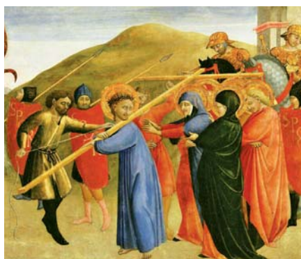
Stefano di Giovanni: Cesta na Kalvárii (1444)

Když pár uzavírá sňatek v kostele, přenechává společenství starost a péči o jednotu jejich rodiny. Neměli by tedy ostatním členům církve říci: „To není vaše starost.“ Oni sami svěřili církvi tuto starost. Dali církvi a všem jejím členům