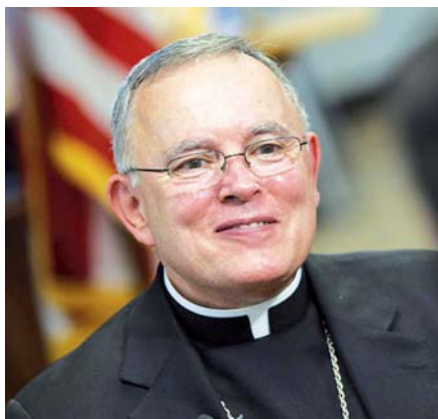
Mons. Charles J. Chaput OFM Cap