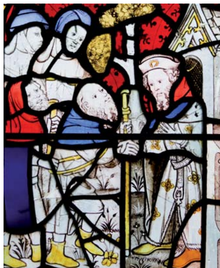
Přijímejte pocestné.

Dnes vyvstává zvláště aktuální otázka tzv. uprchlické krize. Zde je zapotřebí mimo-