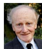
Robert Spaemann, německý filosof, teolog a vysokoškolský pedagog