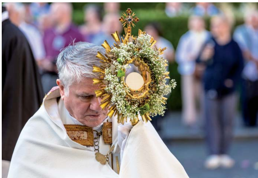
Boží tělo, Praha 2015.

Proto také Církev, když vidí tak velikou milost, vybízí: Jezte, přátelé, pijte, veselte se, moji drazí . Co máme jíst a co máme pít, vyslovil Duch Svatý jinde ústy proroka: Zkuste a poznáte, jak Pán je dobrý; a šťasten, kdo se uchyluje k němu . V této svátosti je Kristus, protože je tu Kristovo tělo. Není to tedy pokrm pro tělo, ale pro duši. Proto apoštol říká i o jeho předobrazu, že naši praotcové jedli duchovní pokrm a pili duchovní nápoj. Neboť Boží tělo je tělo duchovní a Kristovo tělo je tělem Božího Ducha, protože Kristus je duch, jak čteme: Duch před naší tváří je Kristus Pán . A v Petrově listě stojí: Kristus zemřel za nás . Tento pokrm pak posiluje naše srdce, a tento nápoj je k radosti lidského srdce, jak připomíná prorok.