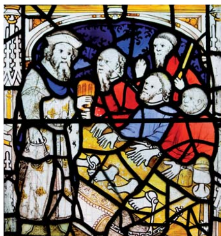
Navštěvujte vězně.

Navštěvovat nemocné, v širším smyslu o ně pečovat a sloužit jim a podle možnosti je léčit i za cenu velkého sebeobětování podle příkladu a učení Pána Ježíše,