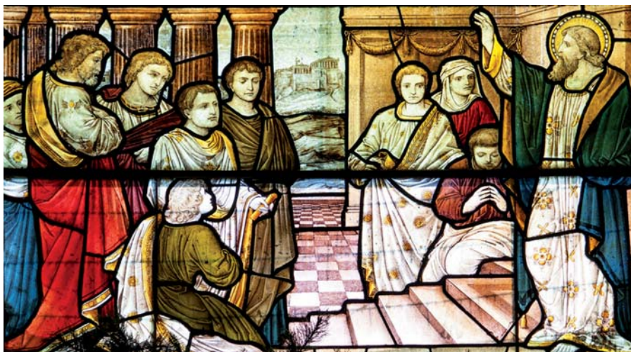
Apoštolové hlásají evangelium.

Nezávisle na tom, jestli souhlasíme nebo ne, vzniká tady otázka, jak k tomu došlo. Že František zaujal vůči svému předchůdci Janu Pavlu II. kritickou distanci, je patrné už z toho, že jej kanonizoval společně s Janem XXIII., přičemž v případě Jana prominul požadovaný druhý