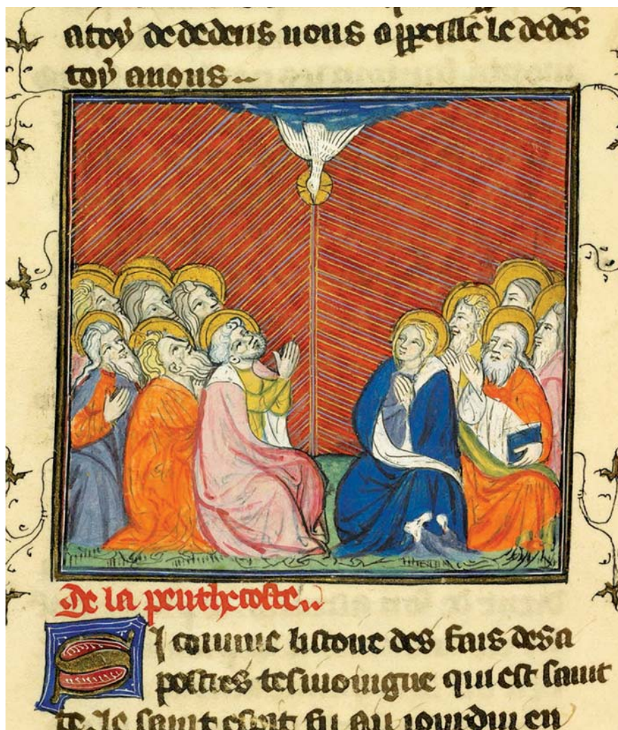
Jakub de Voragine: Legenda aurea, Letnice.

Homilie papeže Františka při mši svaté na Soslání Ducha Svatého