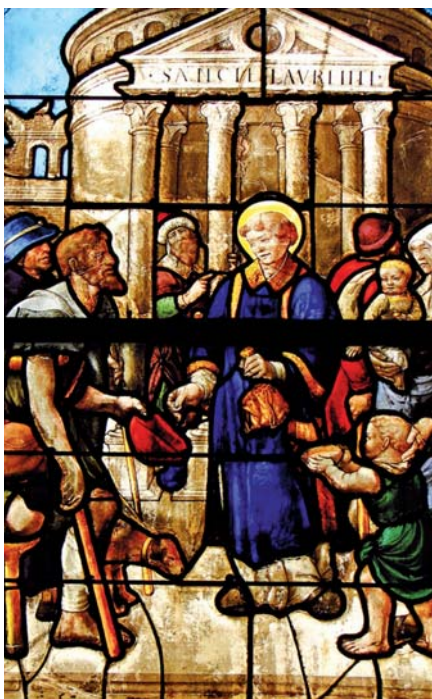
Svatý Vavřinec rozdává almužnu

Zkousím si představit, co si mysleli lidé, když spatřili Marii, Josefa a Ježíše