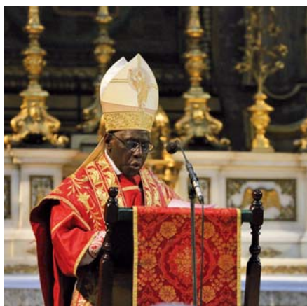
Kardinál Robert Sarah káže při mši svatě slavené v rámci konference Sacra liturgia