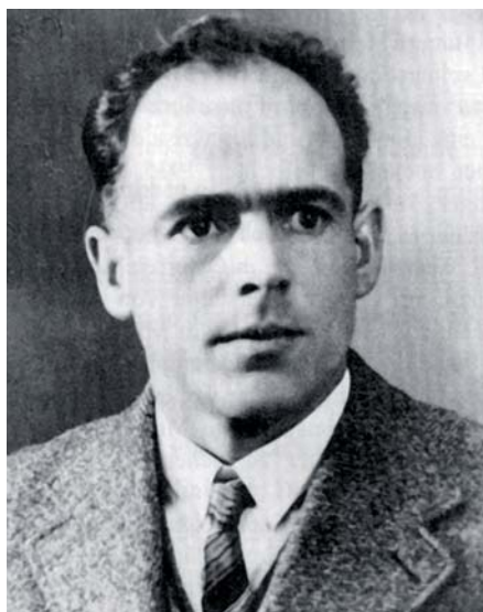
Shora: P. Franz Reinisch, Franz Jägerstätter