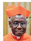
Robert kardinál Sarah, prefekt Kongregace pro bohoslužbu a svátosti