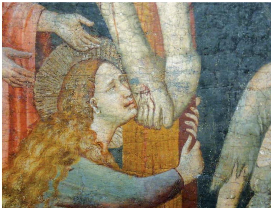
Marie Magdalena.

Protože vím, že jste plni Boha, napomenul jsem vás krátce. Pamatujte na mne ve svých modlitbách, abych dospěl k Bohu, a na Církev v Sýrii – podle níž nejsem hoden se nazývat; velmi potřebuji vaši modlitbu a lásku, sjednocené v Bohu – aby se Církev v Sýrii skrze vás dostalo vláhy. Buďte silní v Boží svornosti a mějte nerozdílného ducha, jímž je Ježíš Kristus.