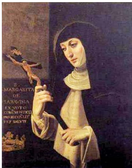
Blahoslavená Markéta Savojská.

se Alfons I. oženil v roce 1146. A Fatima, která přijala nové křesťanské jméno Oureana – její původní jméno bylo jménem Mohamedovy dcery –, se stala tak milovanou duchovní dcerou Mafaldy, že se královna po své smrti v roce 1157 nechala vedle ní podle svého přání pohřbit. Stalo se tak v kostelíku Panny Ma-