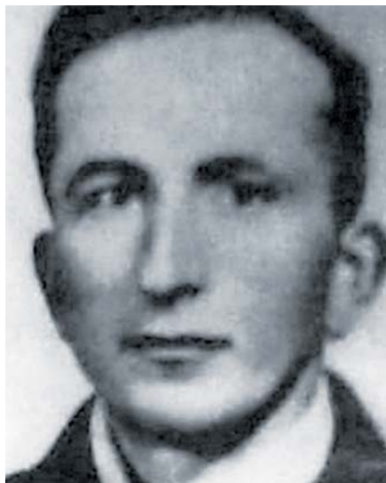
Bl. Franciszek Stryjas.

Na jaře roku 1941 vedení lágru přidělilo Starowieyského, i když se vůbec nemohl udržet na nohou, k práci na úpravě terénu kolem tábora. Po několika dnech jej ale poslali zpět v důsledku krajního vyčerpání. Kápo ho však zbil tak surově, že na Hod Boží velikonoční 13. dubna