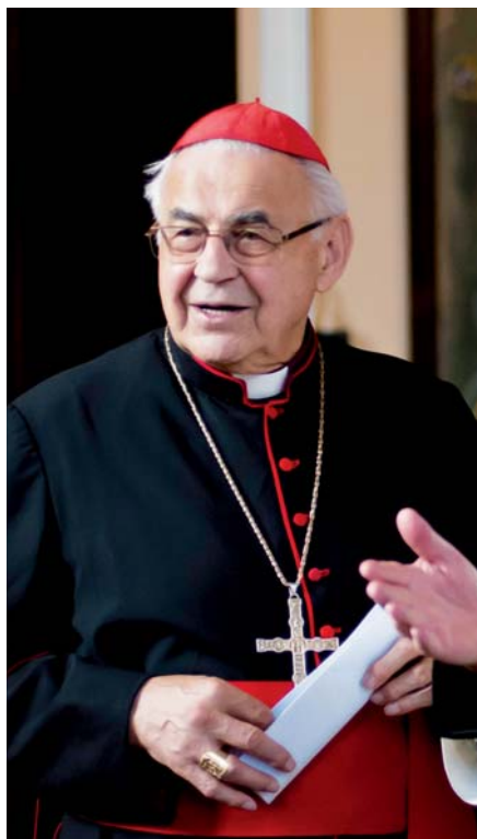
Miloslav kardinál Vlk