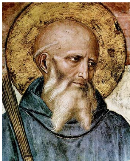
Fra Angelico: Svatý Benedikt z Nursie, patron Evropy (1437–1446).

perspektivy pravých ideálů nás nakonec ovládne obava, že nás druhý člověk vytrhne z ustálených zvyklostí, připraví nás o dosažený komfort či nějak zpochybní náš životní styl, častokrát tvořený jenom hmotným blahobytem. Bohatstvím Evropy však vždy byla její duchovní otevřenost a schopnost klást si zásadní otázky o smyslu bytí. Otevřenosti vůči smyslu pro věčnost odpovídala rovněž kladná