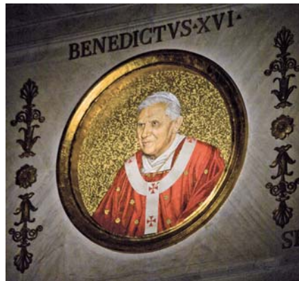
Benedikt XVI. Mozaika v bazilice svatého Pavla za hradbami

mi historické osobnosti. Podle nositele Nobelovy ceny Maria Vargase Llosy je Ratzinger jedním z nejvýznamnějších intelektuálů současného světa, jehož smělé reflexe poskytují odpovědi na mravní, intelektuální i kulturní problémy naší doby. Především je však inspirovaným otcem Církve, který za sebou zanechává téměř nevyčerpatelné dílo. Je zde také obrovské množství materiálů, které je třeba zpracovat a uvést do historických souvislostí,