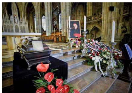
Poslední rozloučení s Miloslavem kardinálem Vlkem