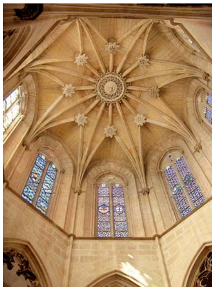
Strop v Kapli zakladatelů v klášteře Batalha

a španělští habsburští králové byli zároveň králi portugalskými. Poté, co se podaří obnovit portugalskou samostatnost, vyhlásuje nový portugalský král Jan IV. z Bragançy dne 20. října 1646 za patronku svého království Pannu Marii od Neposkvrněného početí. „Země Panny Marie“ se tak stává „zemí Neposkvrněné“.