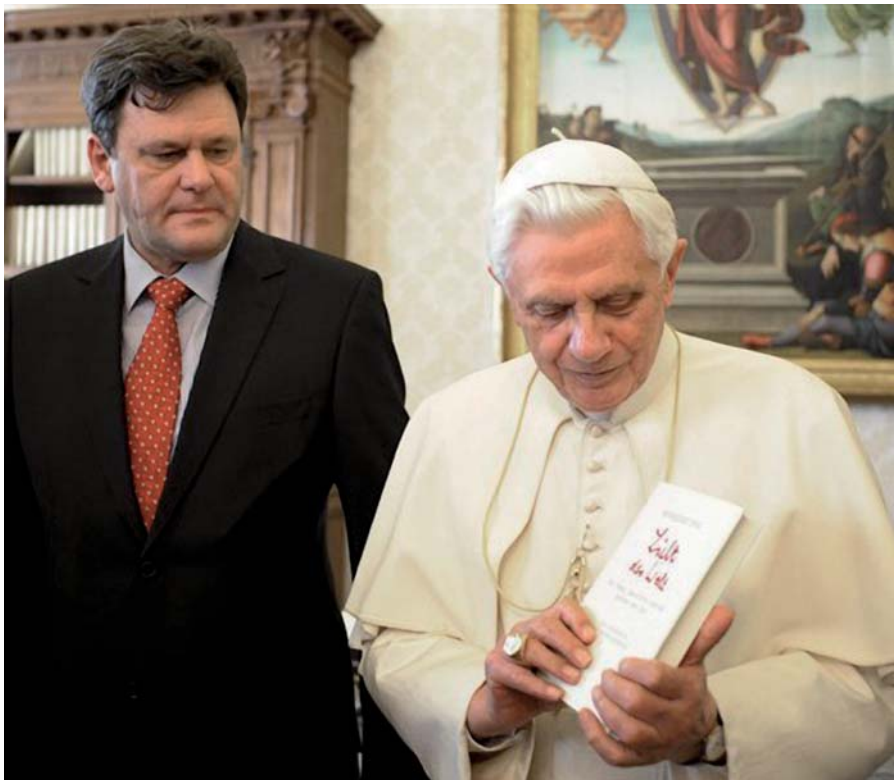
Peter Seewald s Benediktem XVI.

Po rezignaci jsme se poprvé setkali v červenci 2013. Tato událost můj seznam otázek samozřejmě změnila. Jak jsem uvedl, původní myšlenkou tohoto projektu bylo