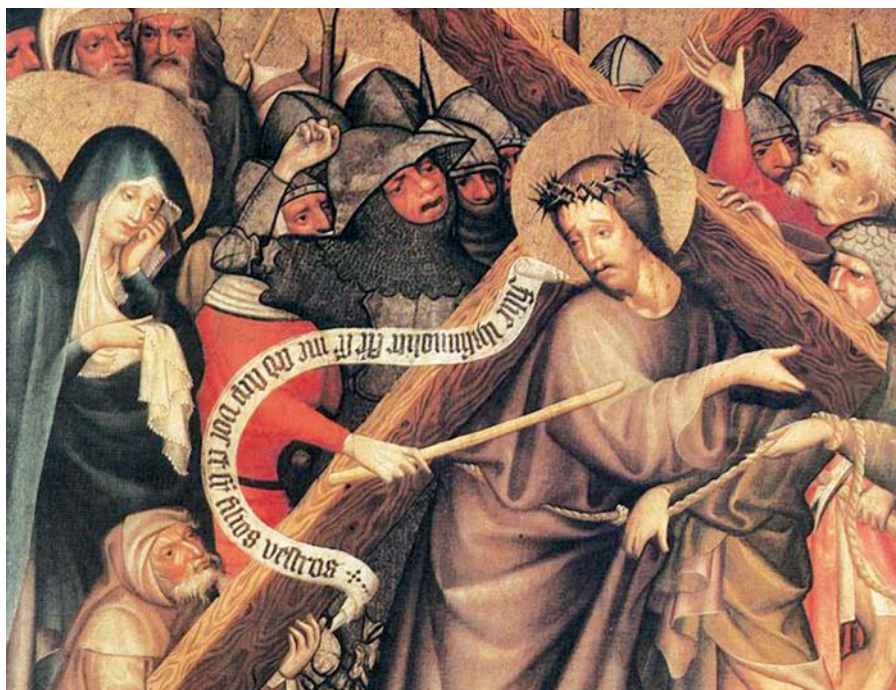
Tomáš z Kluzé: Kristus nese kříž (1427). Foto: Wikimedia Commons

Bez bázně tedy, bratři, vyznávejme, ba přímo hlásejme, že Kristus byl ukřižován za nás. Mluvme o tom ne se strachem, ale s radostí, ne se studem, ale s chloubou... At' je daleko ode mě, abych se chlubil něčím jiným než křížem našeho Pána Ježíše Krista.