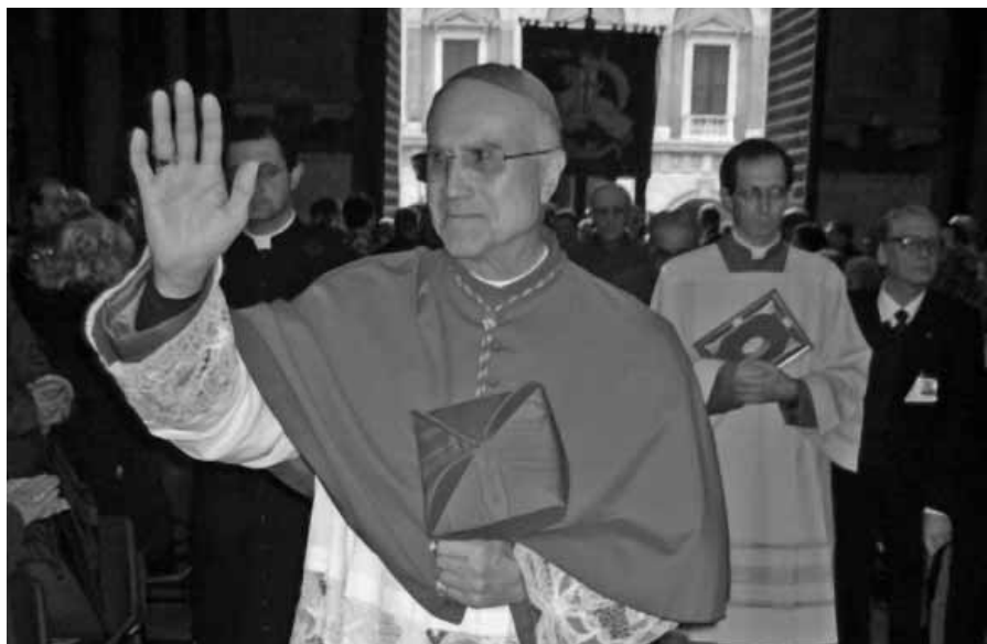
Janovský kardinál Tarcisio Bertone

Janovský kardinál Tarcisio Bertone řekl témuž listu, že politici nesmějí uzavírat svou víru v soukromé sféře. Prohlásil, že v naší sekularizované společnosti je třeba hlásat slovo Boží v jeho plnosti a radikálních požadavcích.