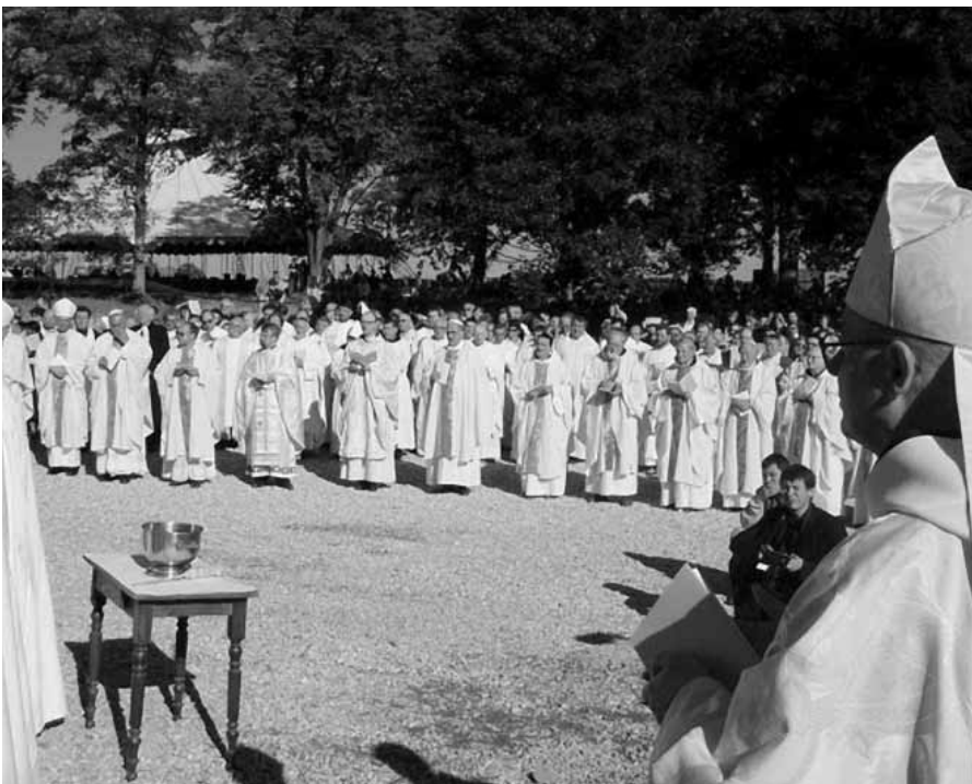
Záběr z obřadu posvěcení kostela v Novém Dvoře