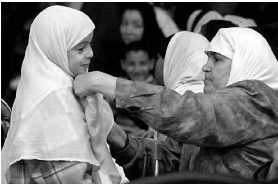
Matka upravuje muslimské dívce sporný šátek

Přítom zákaz šátek bude naprosto neúčinný, ba až kontraproduktivní: když věřící různých náboženství nebudou moci své náboženské symboly veřejně, leč mírumilovně nosit na půdě státních škol či institucí obecně, začnou se z veřejného života stahovat, od své společnosti izolovat, opevňovat se v ghettu – a radikalizovat. Nemohou francouzští mus-