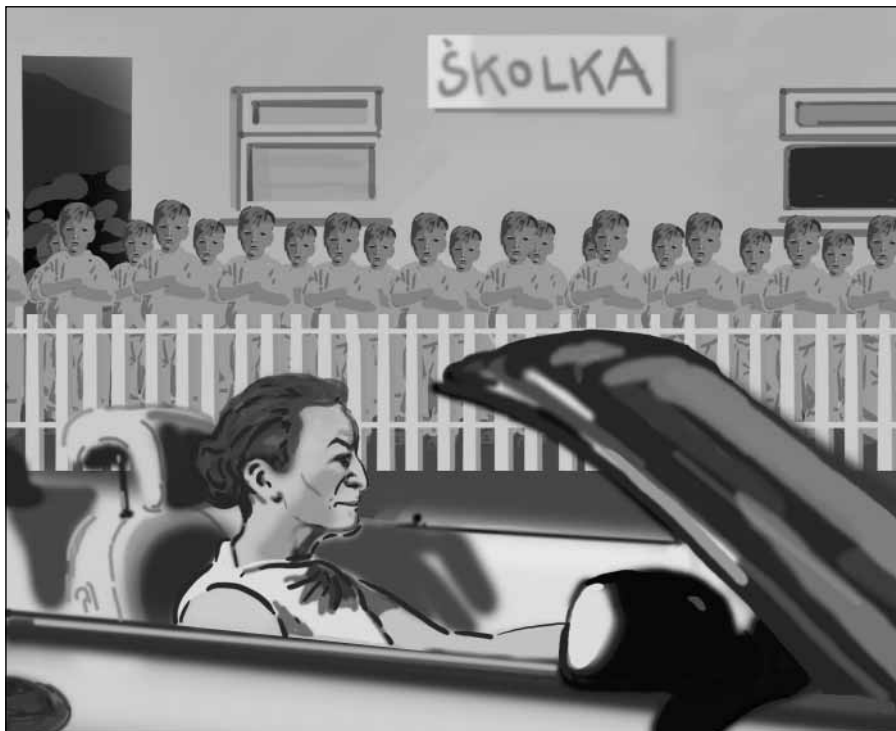
Slučitelnost rodiny a zaměstnání?

Nová ideologie, jež vládne v Bruselu, je „politicky korektní“, ideologie závazného a všeobecného relativismu hodnot a následkem toho je obviňován z nesná-