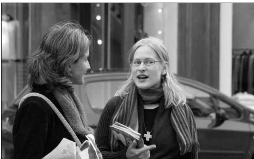
Mladí evangelizují v pařížských ulicích

V den svátku Všech svatých sloužil kardinál Lustiger mši svatou pro bezdomovce a jejich přátele, obětovanou za všechny, kdo zemřeli na pařížských ulicích.