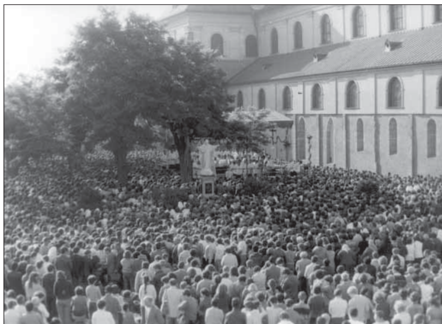
Velehradská pouť v roce 1985

Nastala rozsáhlá akce, která měla zabránit účasti věřících. Autobusová doprava na Velehrad byla podvázána, na druhé straně se na komunální úrovni pořádala řada akcí, které měly lidi