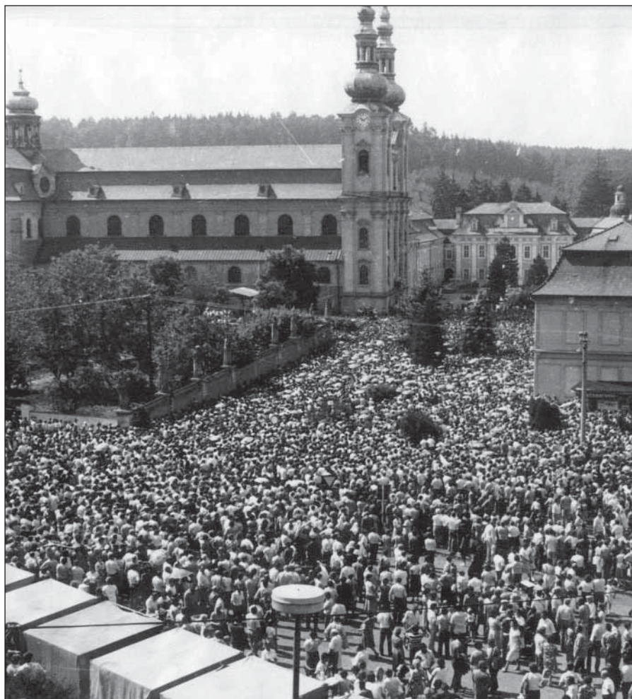
Velehradská pouť v roce 1985

V sobotu o půl desáté zazvoní telefon, sestřička z telefonní centrály mi říká: „Mons. Dziwisz chce s vámi mluvit.“ Mírně ve mně hrklo. A bylo také proč. Žádal mě, abych ihned přišel ke Svatému Otci, že poslal auto.