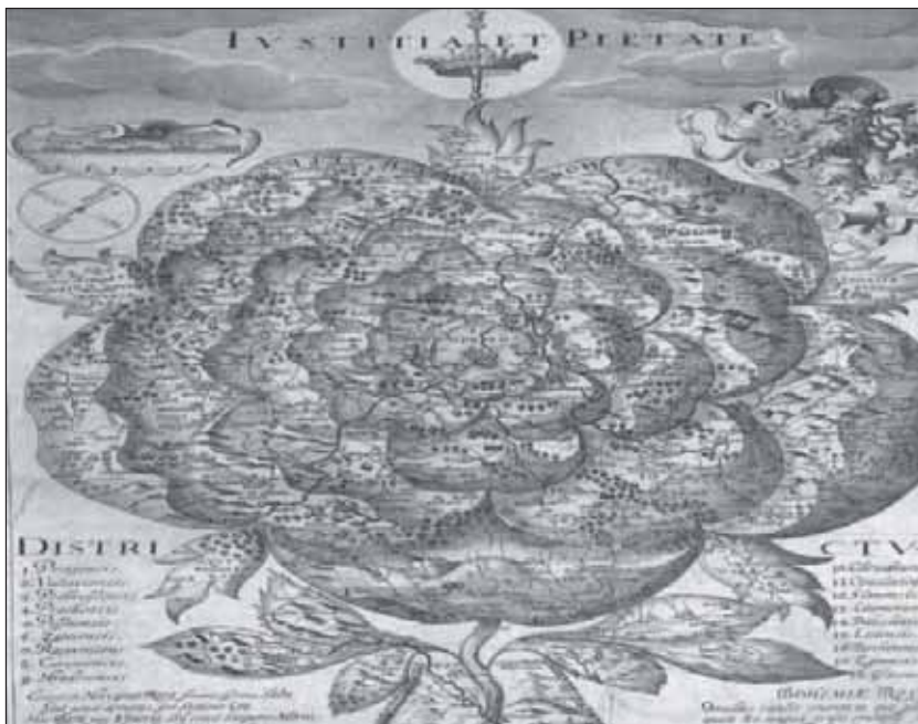
Alegorická mapa Čech v podobě růže v Balbínových Rozmanitostech z historie království českého

Svá dětská léta prožíval ovšem Bohuslav Balbín v krásném prostředí tehdy nového renesančního zámku v Častolovicích. Zde uprostřed lesů kolem břehů Orlice se silně vyvinul jeho cit pro krásu přírody a touha poznávat její tajemství. Také se zde upevnilo jeho zdraví,