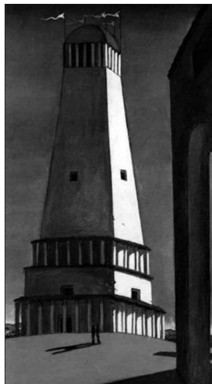
G. de Chirico, Touha po nekonečnu.

hodnoty vědeckého úsilí je možné dosáhnout i neempirickými metodami.