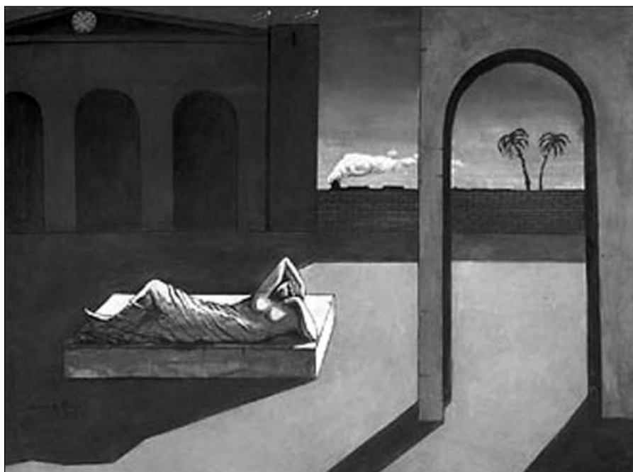
G. de Chirico, Odměna řešitelce. Foto: http://www.tendreams.org

Ti první, řekněme jim třeba cenzoři lidského myšlení, drží myšlení striktně v mezích pouhé zkušenosti; aspoň to