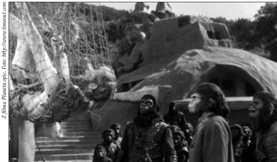
Z filmu Planeta opic.

se tak naučí být odpovědné. Přijme-li se starobylé přikázání ‚starej se o všechno‘, tedy o sebe samého, o jiné lidské bytosti, o svět, proč ne také o zvířata?“