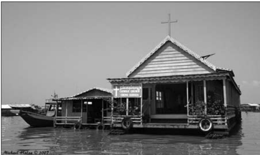
Plovoucí katolický kostel na jezeře Toulé Sap v Kambodži