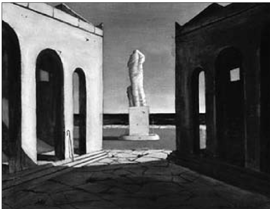
G. de Chirico, Podzimní melancholie.

Jestliže tedy někdo hodnotí tytéž skutky kladně a jiný záporně, máme asi dobrý důvod si myslet, že se jedna strana sporu mýlí. Nebo je to tak, že každá strana má oprávnění pro své hodnocení ve svém historicko-kulturním kontextu? Co je pravdou pro jedno, je omylem pro druhé a naopak? Ať tak či onak, při takových otázkách už nevystačíme se spontánním mravním rozlišováním. Na řadu musí přijít soustavná etická reflexe, která se zabývá svobodným lidským rozhod-