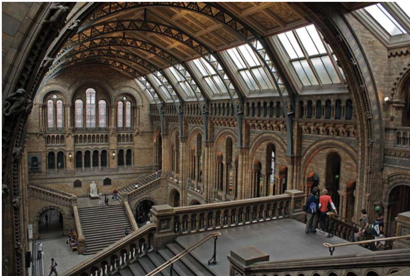
Natural History Museum v South Kensingtonu, Londýn