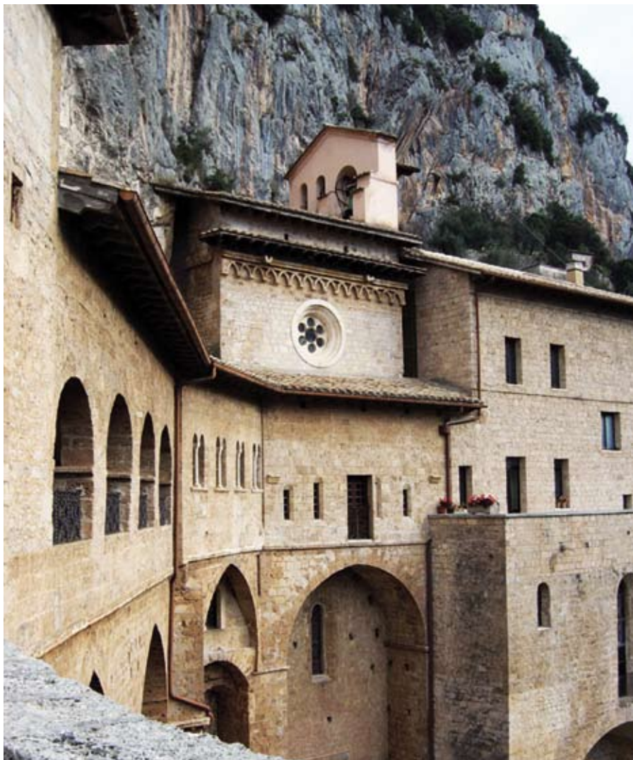
klášter sv. Benedikta v Subiacu

Každý, kdo přijede do Subiaca u Říma, do kolébky západního monasticismu, dříve nebo později zabloudí do růžové zahrádky, v jejichž trnech sv. František bojoval se smyslovým pokušením. Prostáček z Assisi v tom nebyl příliš originální. Se stejnými potížemi se tu o šest set let dříve potýkal obyvatel těchto míst, svatý Benedikt.