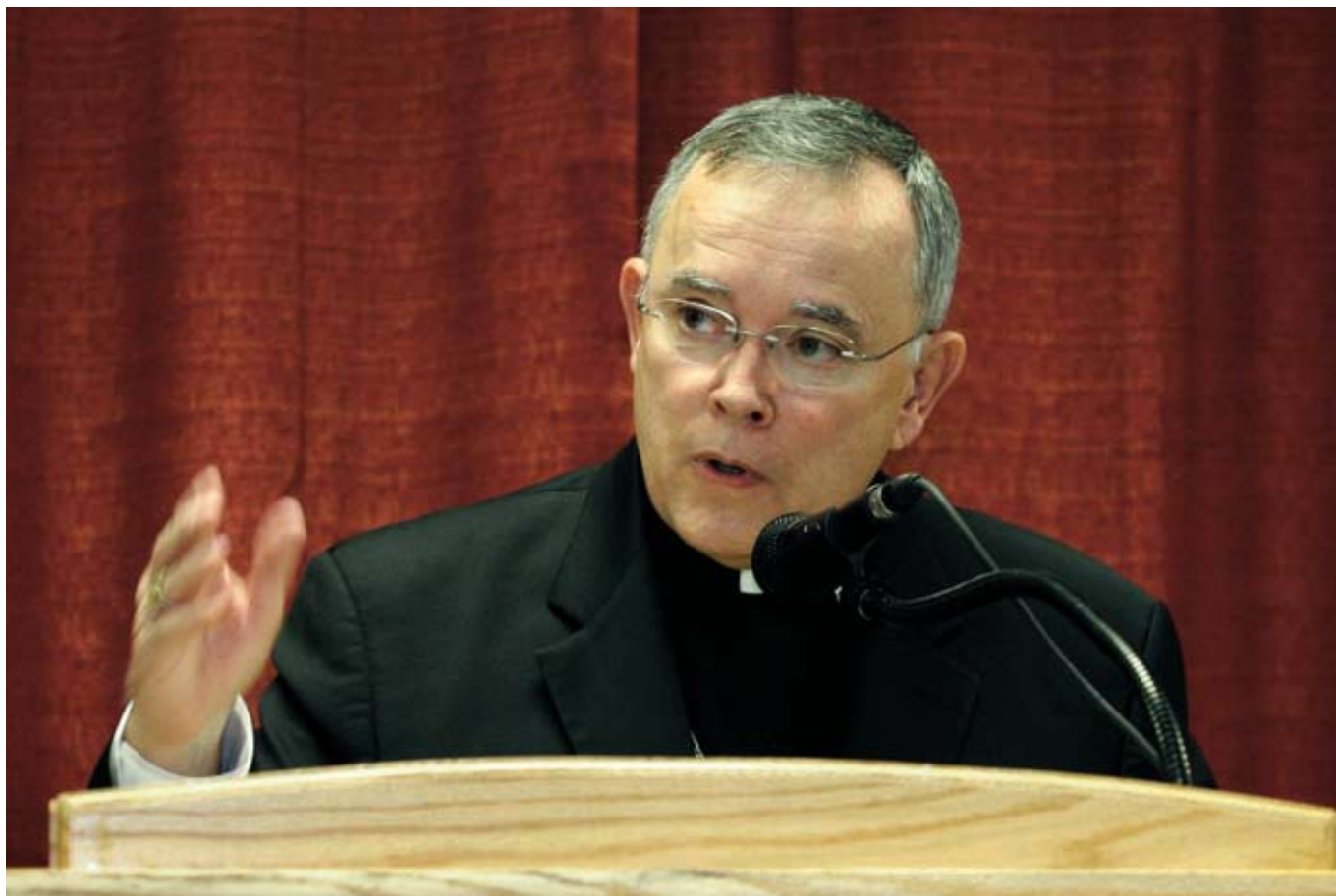
Charles J. Chaput OFMCap.