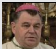
Mons. Dominik Duka OP

Mons. Dominik Duka OP (mezititulky redakce)