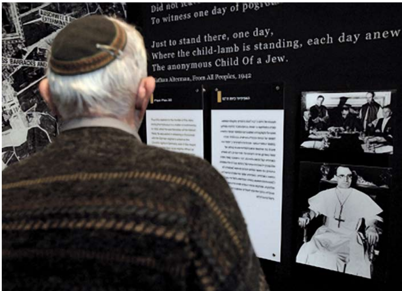
Památník hrdinů a obětí holokaustu Jad Vašem v Jeruzalémě