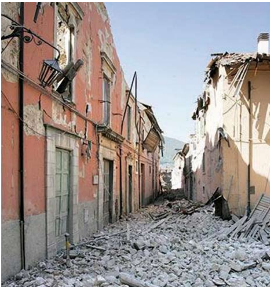
Aquila den poté

Abruzzo jsou pro Římany malý ráj. Stačí hodina jízdy po malebné autostrádě a ocitnete se dva tisíce metrů nad mořem, na sněhu. Epicentrum bylo přímo v místech našeho oblíbeného sjezdu z dálnice. Aquila je krásné historické město, významně zapsané také v dějinách křesťanství. Najdeme v ní hrob svatého Bernardina Sienského. A v Aquile byl pochován