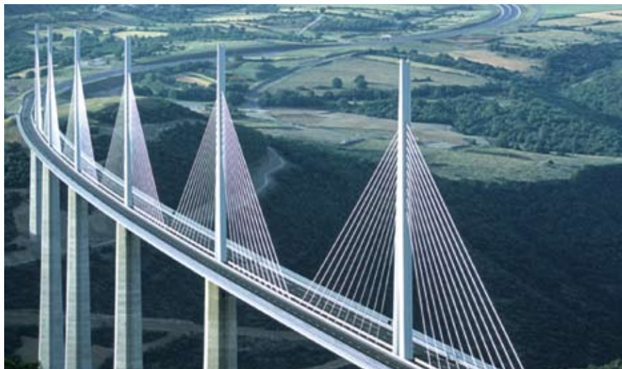
Quo vadis, Evropo? – Most, symbol překlenutí propasti mezi Bohem a člověkem