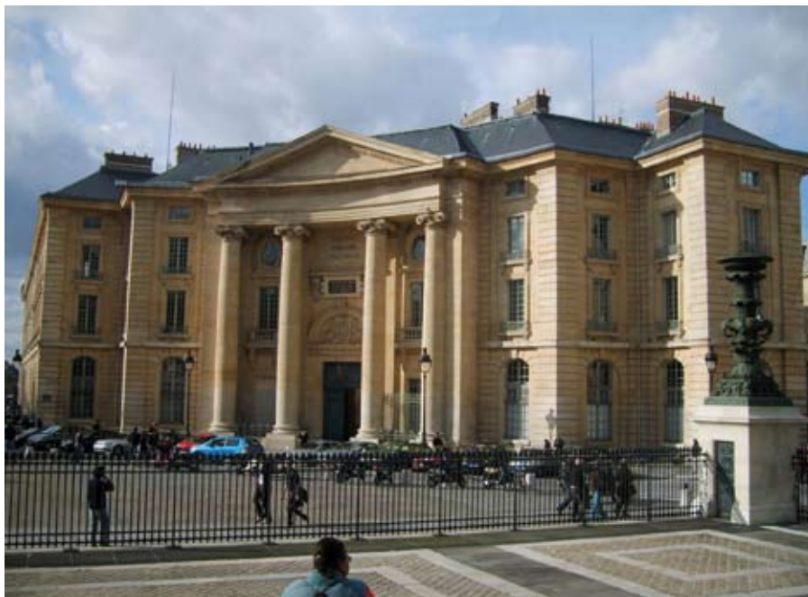
Pařížská Sorbona, jedna z nejstarších univerzit

a očekávali od církve na oplátku povolnost pro svoje záměry. Avšak v žádném případě se v Evropě nepodařilo nějakému vládcu etablovat cokoli podobného orientální despotii s její absolutní mocí nade všemi. Rozhodování o tom, co je dobré a co je zlé, co rozumné a nerozumné, nebylo v rukou světské moci. Pod ochranou církve se etablovala centra vzdělanosti a přemýšlení, včetně přemýšlení o politických otázkách. Tato internacionála myšlení a vzdělanosti umožnila vyhledávat talentované jedince bez ohledu na jejich sociální původ a zároveň jim umožnila vzájemnou komunikaci, bez níž nelze myšlení rozvíjet. Z těchto center vzdělanosti a z debat, které se v nich odehrávaly, se nakonec mj. vynořila i moderní věda.