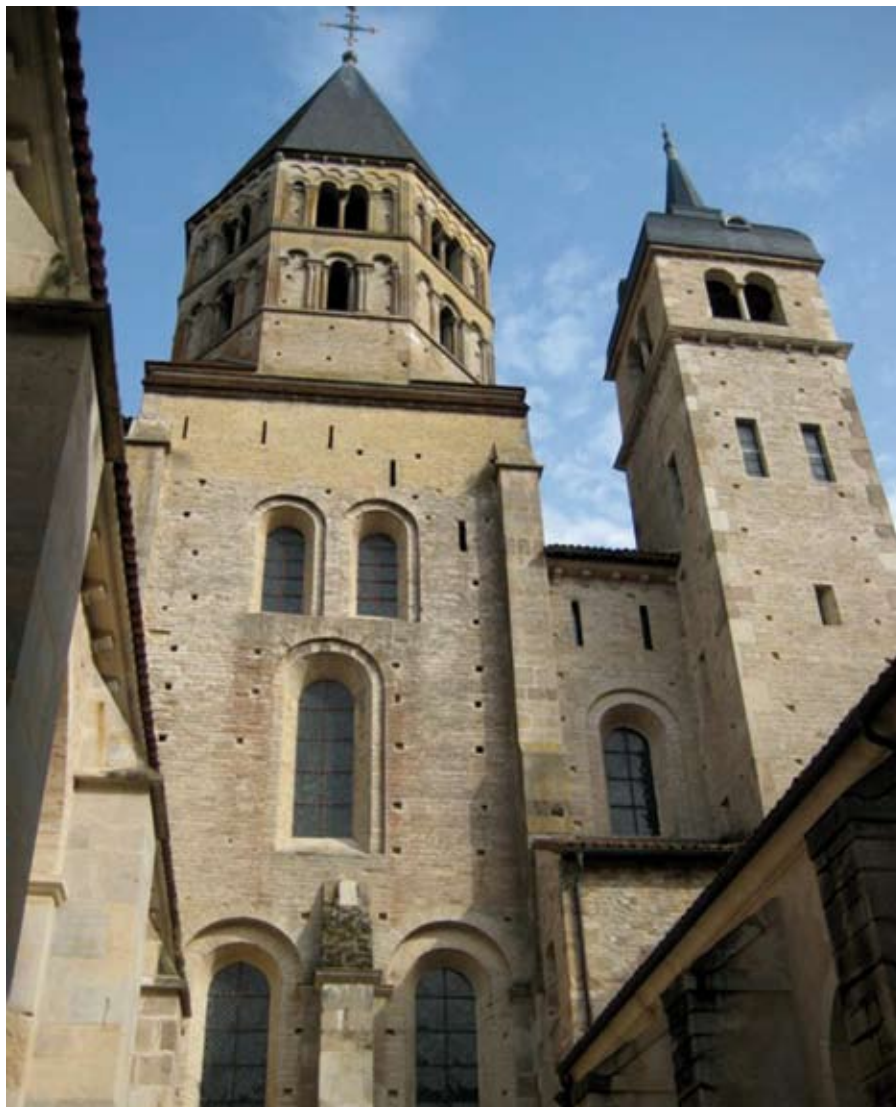
Opatství Cluny, jedno z předních náboženských a kulturních center středověké Evropy

jako takové, bylo vypuzeno z veřejné sféry a zatlačeno do soukromí. Kdyby se tak Evropě stalo, udržovalo by se svobodné myšlení pouze v malých izolovaných skupinkách bez jakéhokoli vlivu na věci veřejné. Nestalo se tak kvůli první zřetelné jedinečnosti Evropy: Od 4. století měly všechny mocenské útvary v Evropě protiva váhu v církvi. Instituce církve svojí nadnárodní/nadstátní povahou a vybavená vlastním majetkem tvořila hradbu proti absolutizačním tendencím každé vlády. Nelze samozřejmě tvrdit, že by světská a církevní/duchovní moc pokojně koexistovaly. Obě moci byly často v prudkých konfliktech, které nabývaly i násilnou podobu. Před násilnickými útoky jedněch pánů hledala církev často ochranu u jiných pánů, kteří to ale nedělali nezištně