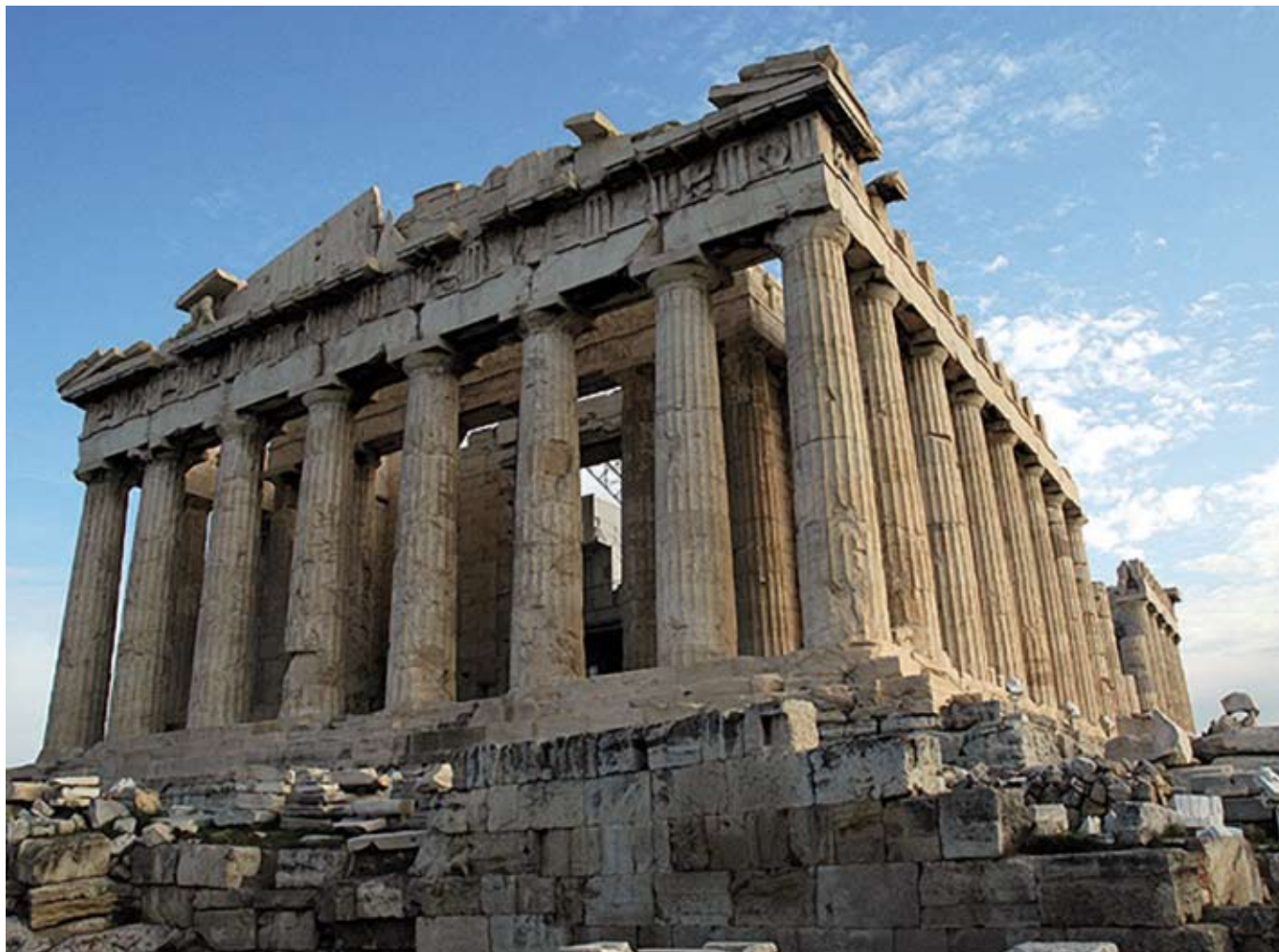
Parthenon, symbol athénské demokracie