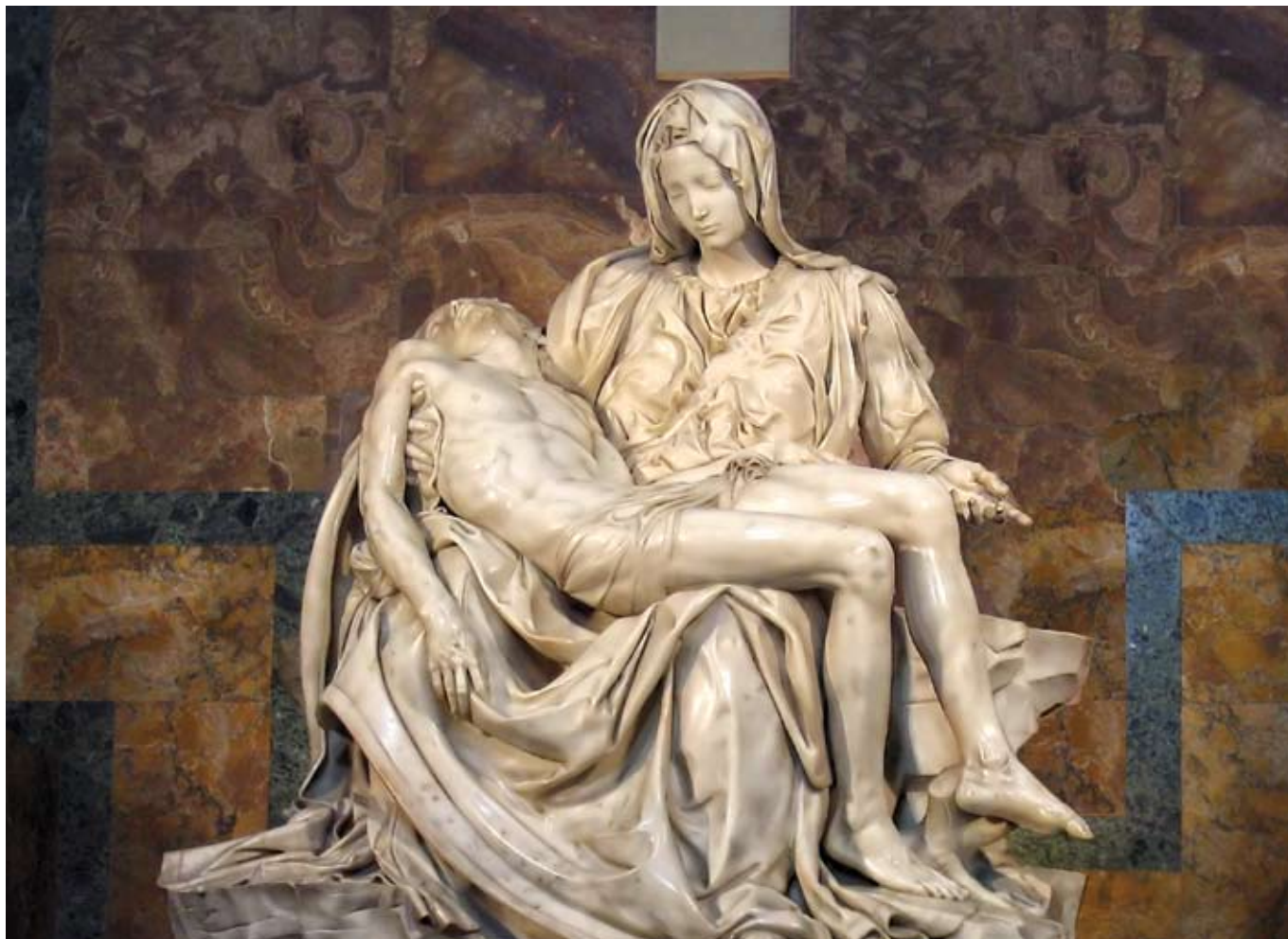
Michelangelo Buonarroti: Pietà