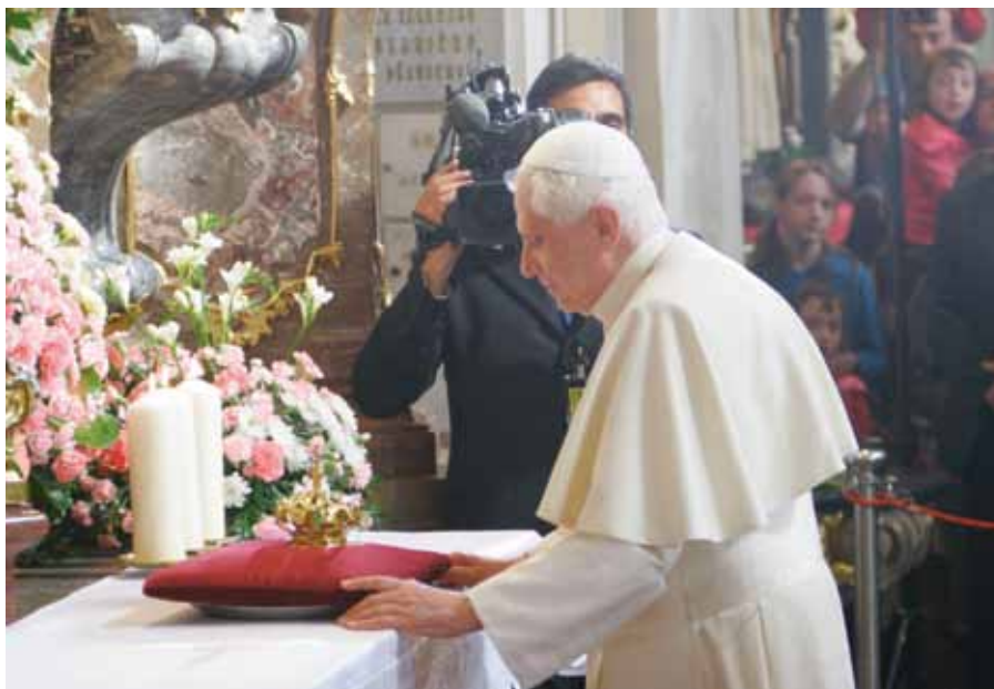
Předání daru Pražskému Jezulátku

Hlavní hostitel Svatého otce, prezident České republiky Václav Klaus, ve svém projevu mimo jiné řekl: „Stejně jako veřejnost na celém světě, i my známe našeho dnešního hosta nejen jako charismatického představitele katolické církve a významného politika, ale rovněž jako mimořádného a v akademickém