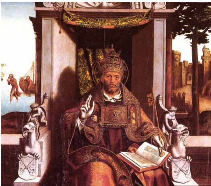
Svatý Petr, Muzeum de Grao Vasco, Viseu, Portugalsko

Papežský primát ve svědectví Písma a Tradice