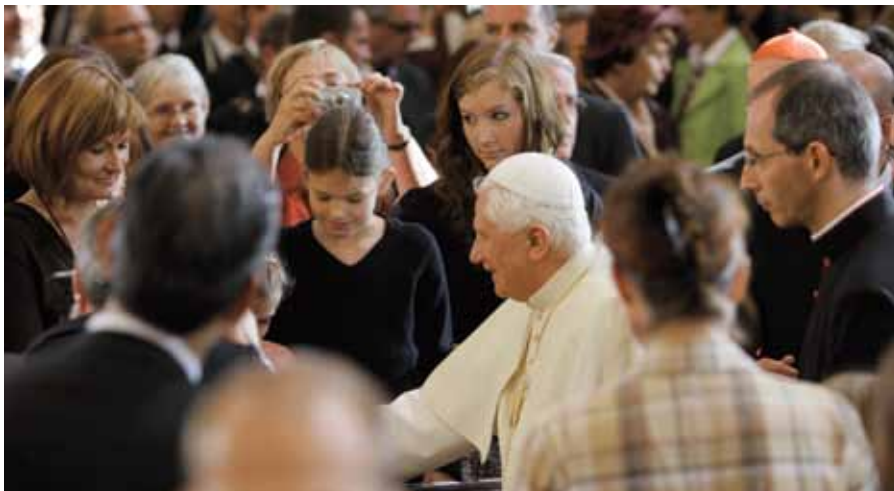
V chrámu Panny Marie Vítězné na setkání s rodinami

Chtěl bych nyní říci několik slov přímo vám, milé děti, a vašim rodinám. Na setkání se mnou jste přišly ve velkém počtu a za to vám ze srdce děkuji. Vy, kdo jste milí srdci Jezulátka, opětuje jeho lásku a podle jeho příkladu buďte poslušné, vlídné a laskavé. Učte se být jako on opo-