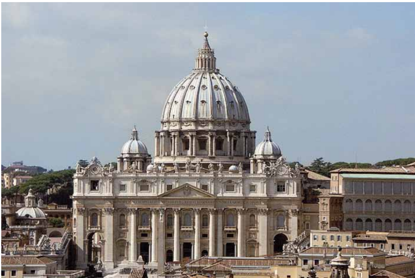
Bazilika sv. Petra, jedna ze čtyř římských papežských bazilik