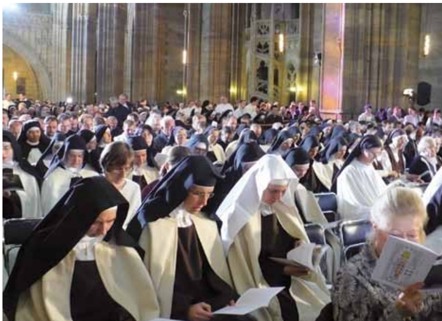
V katedrále sv. Víta, Václava a Vojtěcha