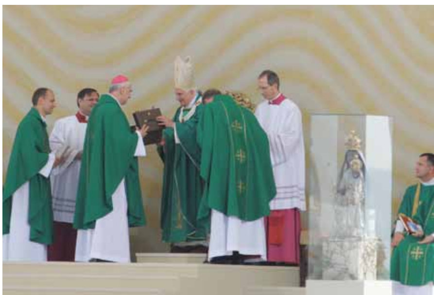
Předání darů při brněnské bohoslužbě

Vzhledem k obvykle velmi drahým autorským právům k fotografiím Svatého otce z komerčních zdrojů se občanské sdružení Res Claritatis rozhodlo poskytnout fotografie ze svého archivu bezplatně pro nekomerční využití. Farním, řádovým a dalším nekomerčním periodikům, případně na nástěnky proto nabízíme možnost bezplatně využít fotografie z papežské návštěvy v České republice. Fotografie budou zájemcům poskytnuty v tiskové kvalitě. Přehled nabízených fotografií je k dispozici na serveru claritatis.cz . Prosby o poskytnutí konkrétní vybrané fotografie zasílejte na adresu redakce: redakce@claritatis.cz .