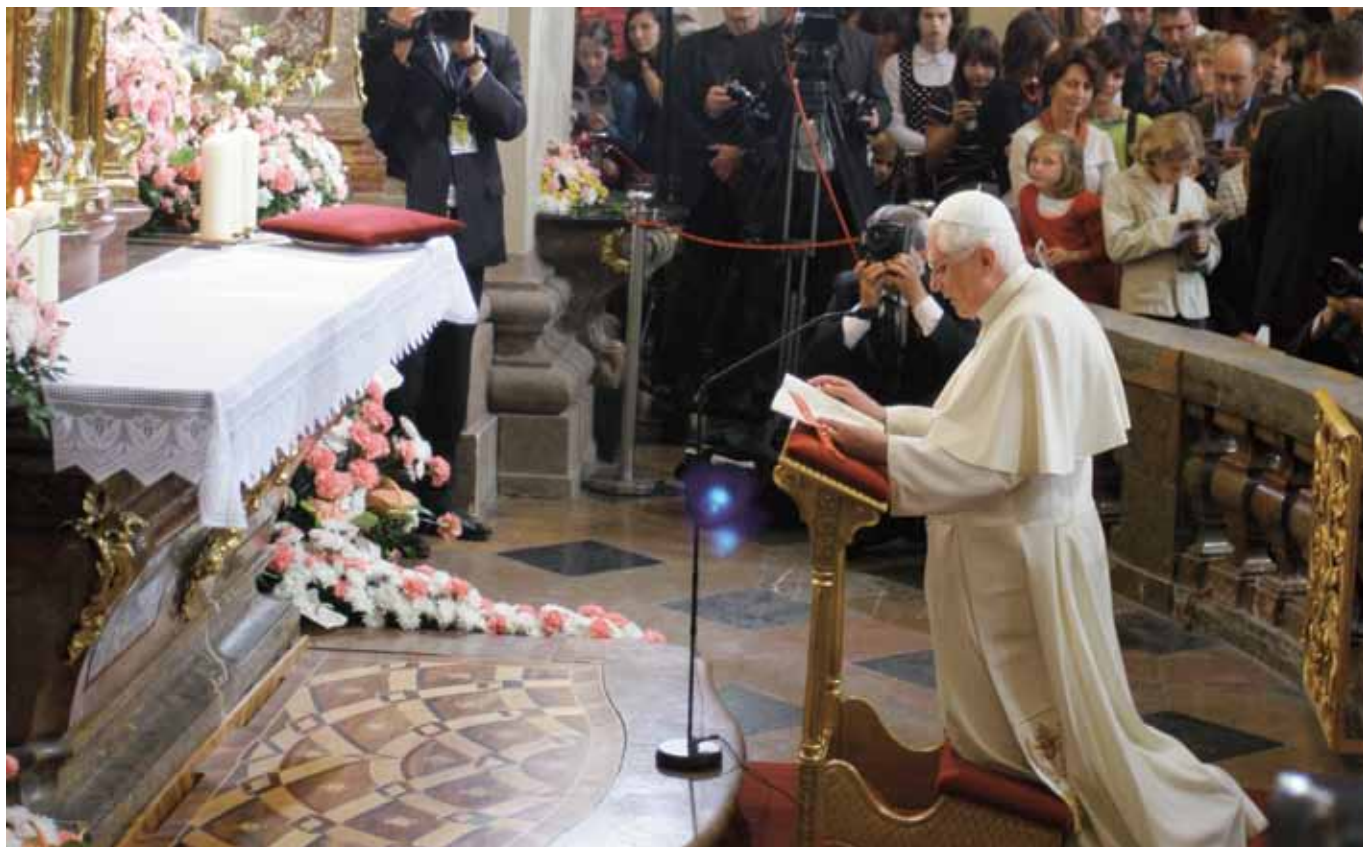
Modlitba před sochou Pražského Jezulátka

Promluva Benedikta XVI. v chrámu Panny Marie Vítězné