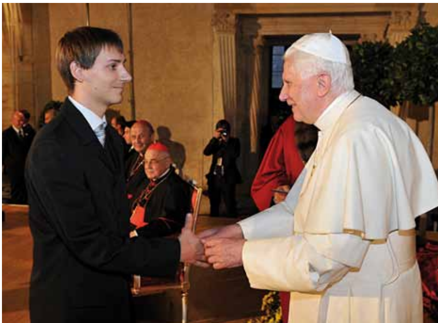
Benedikt XVI. se zdraví se zástupcem studentů Jaroslavem Lormanem

Benedikt XVI. na setkání s akademickou obcí ve Vladislavském sále