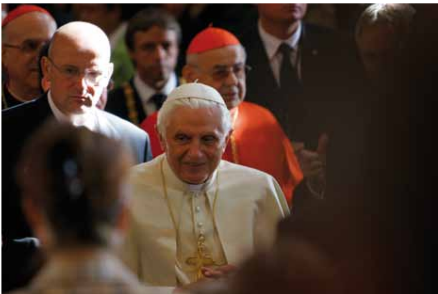
Setkání s rodinami v karmelitánském kostele Panny Marie Vítězné v Praze