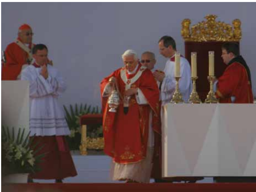
Mše svatá ve Staré Boleslavi

„To je i poučení ze života svatého Václava, který měl odvahu dát přednost království nebeskému před kouzlem pozemské moci... Jako Pánův poslušný učedník, mladý kněz Václav zůstal věrný učení evangelia, jež mu vstúpila jeho svatá babička, mučednice Ludmila. Proto ještě předtím, než se pustil do budování pokojného soužití ve své vlasti a se sousedními zeměmi, postaral se, aby upevnil křesťanskou víru. Proto povolá-