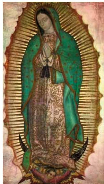
Zázračně vzniklý obraz Panny Marie Guadalupské