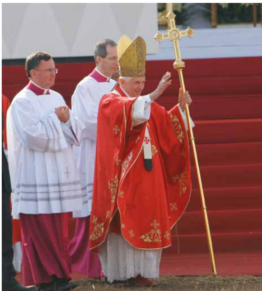
Mše svatá ve Staré Boleslavi

Po třicetiminutové návštěvě odjel Svatý otec papamobilem na místo dalšího setkání – na nedalekou Proboštskou louku, kde jej očekávalo 50 tisíc věřících. Mši svatou slavili spolu s Kristovým náměstkem všichni naši biskupové, kardinálové Tomáš Špidlík, Josip Bozanic, Stanislav Dziwisz, biskupové ze Slovenska, Polska, Rakouska a 600 kněží. Ministrantů bylo 1600. Vzácného hosta na začátku bohoslužby pozdravil pražský arcibiskup, kardinál Miloslav Vlk: