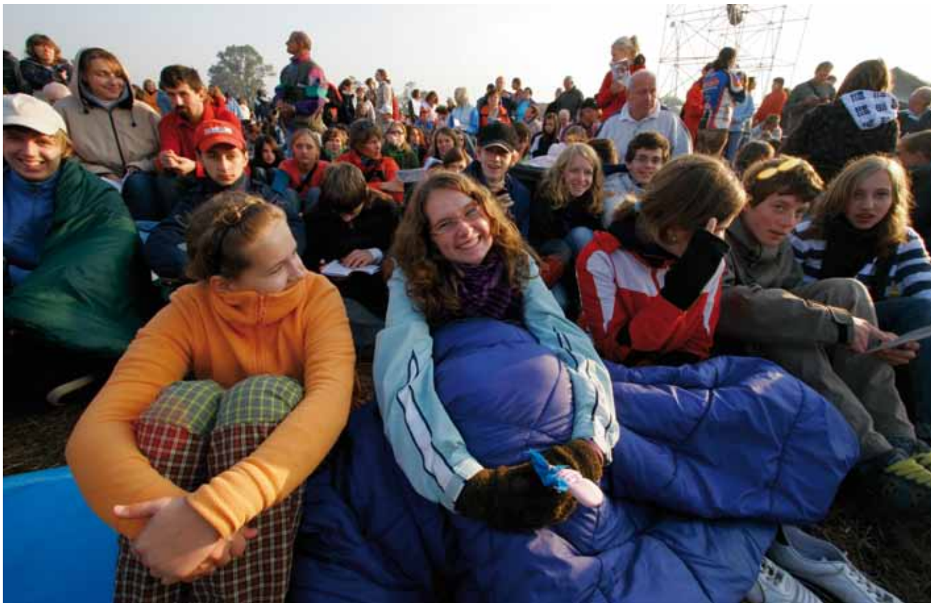
Mláďi po probdělé noci na staroboleslavské Proboštské louce se těší na setkání se Svatým otcem