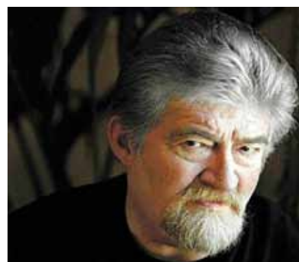
Scenárista Joe Eszterhaz

všichni sdílíme. Co nás spojuje, je důležitější než jakékoliv politické, hospodářské nebo národní rozdělení.“ Posudky a referáty o Our Lady of Guadalupe jsou jednoznačně lichotivé. „Velmi zřídka se nacházejí spojeny tak vynikajícím způsobem inspirace, úcta, zbožnost a historická přesnost,“ komentoval Alexander Bermudez, ředitel tiskové agentury Aciprensa.