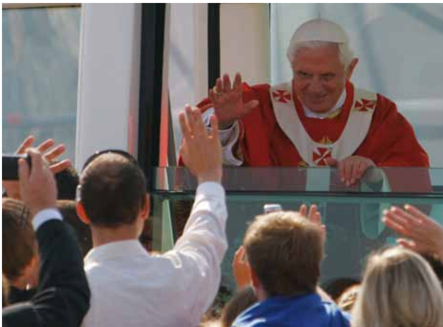
Benedikt XVI. se loučí s účastníky mše svaté ve Staré Boleslavi

Na rozdíl od papežových slov. O nich si prezident Václav Klaus myslí, že budou mít dlouhodobý efekt. „Váš pobyt v naší zemi, poselství, které jste nám tak přesvědčivě předával, Vaši výzvu k vzájemnému porozumění, toleranci, míru, Váš důraz na rozum, víru a etiku, jsme poslouchali pozorně a věřím, že i pochopili,“ řekl prezident Svatému otci těsně před jeho odletem. Zda tím naznačoval