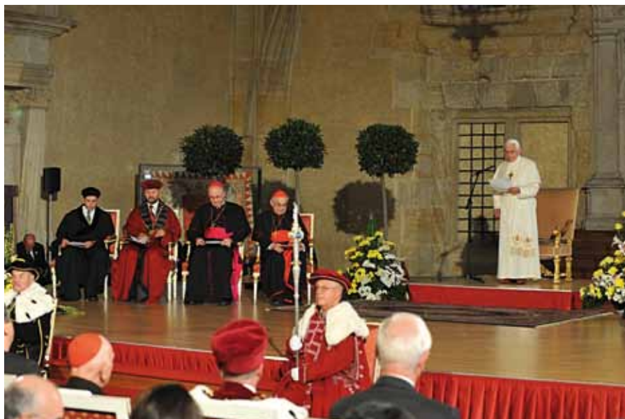
Benedikt XVI. při promluvě k akademické obci