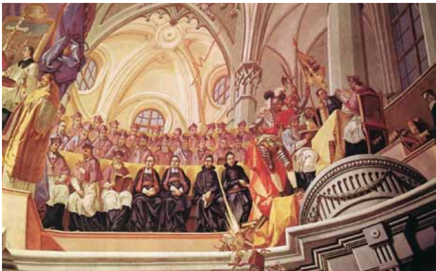
Johann Lucas Kracker, Tridentský koncil, 1778

8. Kdyby někdo řekl, že biskupové ustanovení autoritou Římského Pontifika nejsou legitimními a skutečnými biskupy, ale pouze lidským výplodem, anathema sit .