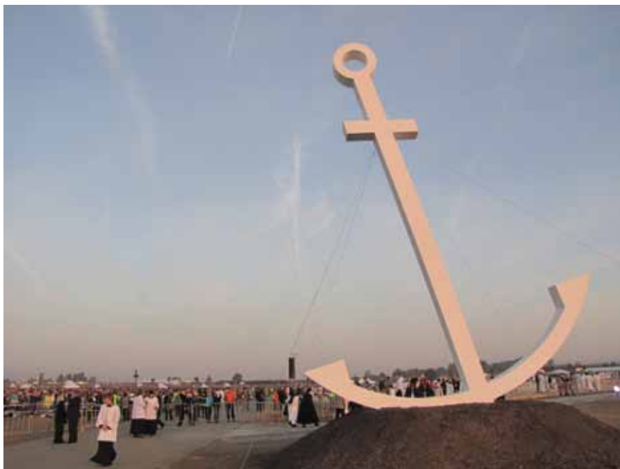
Brněnské setkání s Benediktem XVI. ve znamení naděje

Benedikt XVI. hodnotí svoji cestu do České republiky