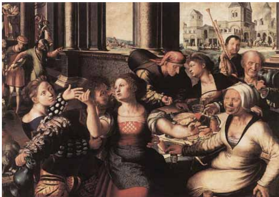
„...a tam svůj majetek rozmařilým životem promarnil“ (Lk 15,13) [Jan Sanders Van Hemessen, Marnotratný syn, 1536]