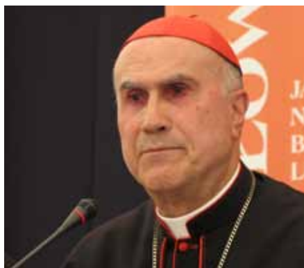
Kardinál Tarcisio Bertone.

Láska k bližnímu, pravda a spravedlnost jsou klíčové pojmy při formulování nového společenského a ekonomického humanismu, řekl kardinál státní sekretář studentům a profesorům Evropské university v Římě.