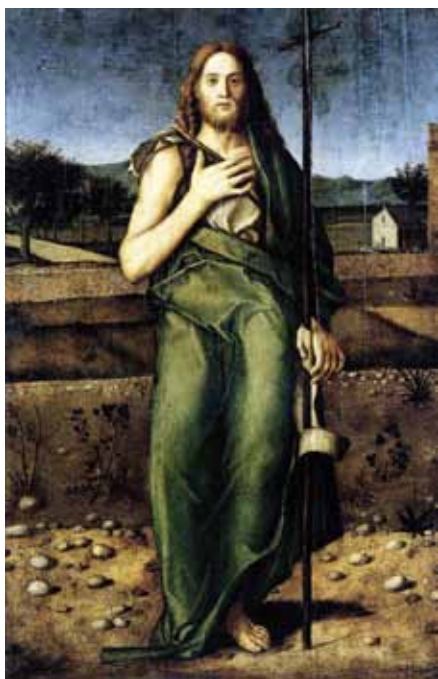
Girolamo da Santacroce: Svatý Jan Křtitel, 16. století

Světlo Kristovo skutečně jednou provždy proniklo tmu světa odvráceného od Boha. Betlémská událost, která z lidského pohledu nastala v jednom okamžiku lidských dějin, je z pohledu Božího věčně přítomná. Spolu s ukřížováním, zmrtvýchvstáním a dalšími událostmi z dějin spásy trvale vypovídá o tom, jak miluje Bůh člověka.