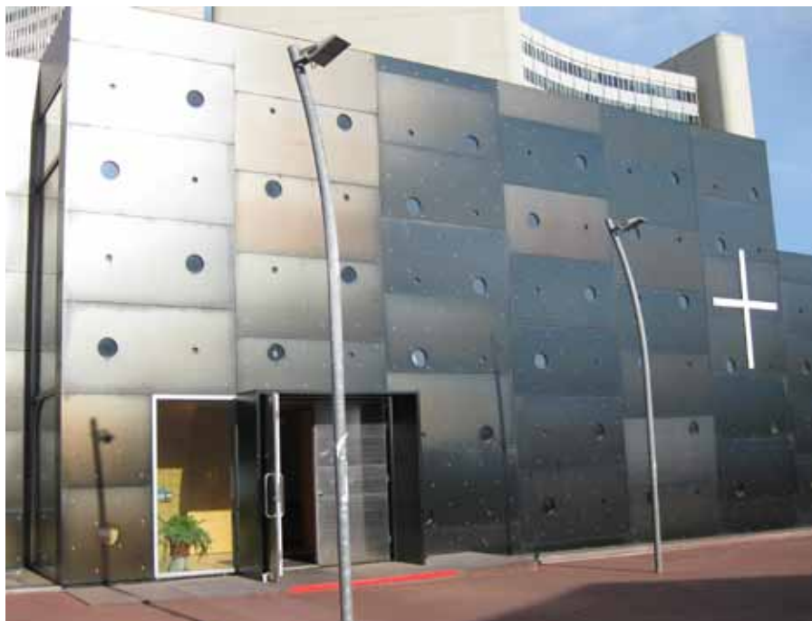
Kostel Krista, Naděje světa v těsném sousedství vídeňského sídla OSN

Minulou sobotu proběhla ve Vatikánu další nevědění událost. Jakýsi summit umělců. Papež totiž pozval do Sixtinské kaple nejvýznamnější představitele různých uměleckých odvětví. Pozvání přijalo přes 250 tvůrců z celého světa. Jeho cílem mělo být obnovení dialogu mezi vírou a uměním. Setkání samo ovšem s dialogem nic společného nemělo. Papež mluvil, umělci poslouchali. Církev tentokrát promlouvala z pozice mistra. Rozdělení rolí se nabízelo už při pohledu na místo konání. Můžeme jistě diskutovat nad velikostí a nadčasovostí děl toho či onoho z pozvaných hostů. Génus fresek ze Sixtinské kaple už diskusi nepodléhá. Koneckonců podobně jako středověké katedrály, o nichž papež mluvil, coby úvodem, o několik dní dříve při středověké katechezi jako o dokonalé syntéze víry a krásy, zřejmě pro všechny.