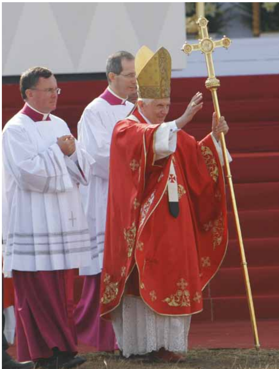
Papež Benedikt XVI. po mši svaté ve Staré Boleslavi

Nechci a nemohu zde rozebrat otázku, co vše tvoří učení Církev a podle čeho se to určuje. Pro účel této diskuse je však důležitý jeden aspekt: Církev se ke svým dokumentům staví obdobně jako nepsaná britská ústava k zákonům – v tom smyslu, že ne vše, co nebylo explicitně zrušeno, dosud platí. Příklad? Je zakázáno vstoupit do budovy britského parlamentu v brnění. Nalepit poštovní známku, na níž je vyobrazena královna, hlavou dolů je velezrada. A tak dále. Tyto zákony de facto neplatí už dávno, ale jejich výslovným zrušením se britští zákonodárci neobtěžují. Obdobně Církev neruší mnohé předpisy či části dokumentů. Dogma o božství Ježíše Krista platí i po sedmnácti letech. Článek 13 už zmíněného Motu Proprio Pia X.