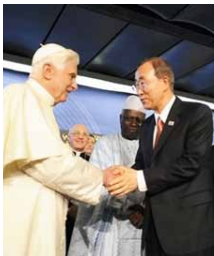
Benedikt XVI. a generální sekretář OSN Pan Ki-mun na Světovém summitu potravinové bezpečnosti v Římě 16. listopadu

Zdůrazňuje-li se různost a odlišnost kultur, je otázkou, jak se může nábožen-