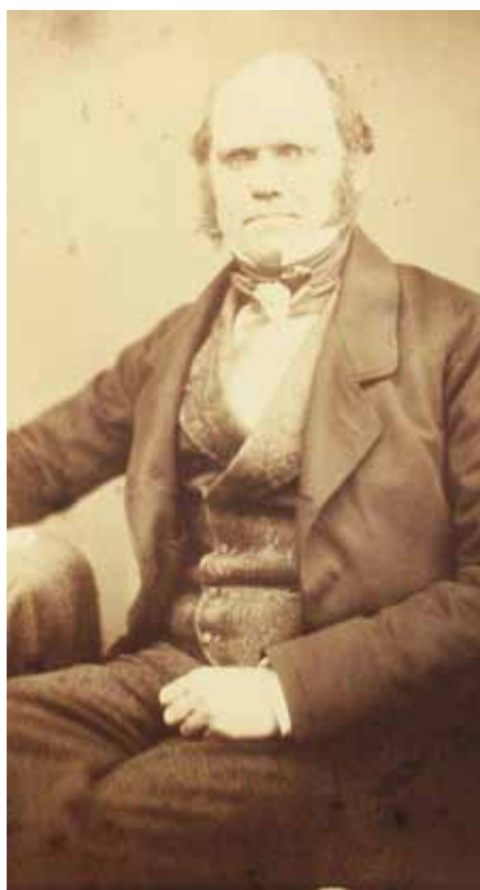
Darwin v roce 1855.

Ovšem myšlenku, že člověk pochází z opice, vyslovuje naplno až téměř o dvě desetiletí později, roku 1871 v knize O původu člověka : „Sledujeme-li zárodečný vývin člověka, homologické shody, které ho spojují s nižšími živočichy (...) a zvraty, jimž podléhá, můžeme si ve svých představách alespoň částečně vybavit, jak asi vypadali naši dávní předkové a umístit je – byť jen přibližně – na jejich správné místo v živočišné soustavě. Poznáváme tak, že člověk pochází ze čtvernohé, srstí pokryté a ocasem vybavené bytosti, která žila pravděpodobně na stromech a byla obyvatelem Starého světa. Kdyby zkoumal celkovou stavbu tohoto tvora přírodovědec, zařadil by jej jistě mezi čtyřruké savce, stejně tak, jako naše ještě dávnější předky, opice Starého i Nového světa. Čtyřruční a všichni vyšší savci pocházejí pravděpodobně z jakéhosi dávného vačnatce, když ten prošel dlouhou řadou rozličných forem, jež vzešly z jakéhosi tvora podobného obojživelníkům, a tento tvor zase vyšel z živočicha blízkého rybám. Zdá se, že v šerém tajuplném dávnověku byl společným předkem všech obrat-