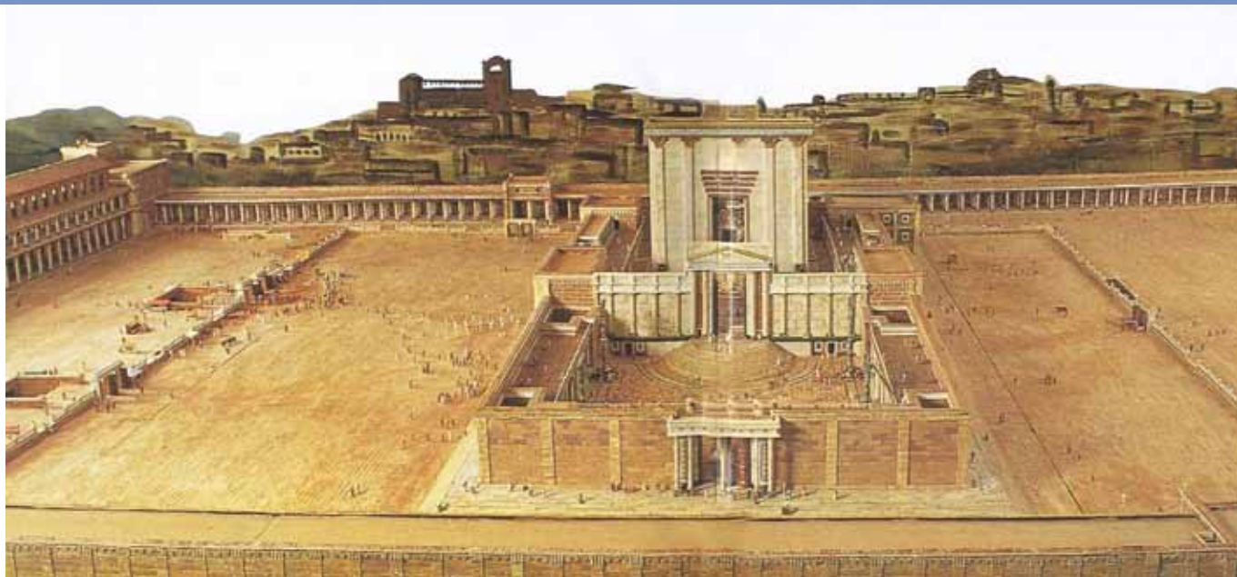
Vnější „nádvoří pohanů“ (nesměli už za nižší kamenou zidku) sloužilo k tomu, aby se pohané mohli přiblížit a klanět se Hospodinu. Model: Alec Gerrard.