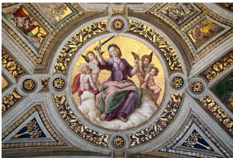
Spravedlnost. (Rafaelovy sály Vatikánského muzea. Foto: Flickr, edlimphoto)

Plně se nasytíme pravdou, až ji uvidíme tvář v tvář. Neboť i to nám bylo slíbeno. Vždyť kdo by si troufal doufat v něco, co by sám Bůh ve své lásce neslíbil a nedal?