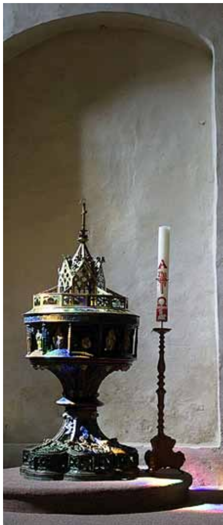
Gotická křtitelnice s paškálem, Banská Bystrica.

Podle zprávy Janova evangelia křtil Jan v Aionu u Salimu, neboť tam bylo mnoho vody, a lidé přicházeli a dávali se křtít. Josef Flavius vypravuje, že se k Janovi sbíhalo velké množství židovského lidu; jeho křest tedy vyvolával značnou senzaci ( Antiquit. 18, 5). Křest Janův, jak je zřejmé z evangelia, byl křtem pokání, kterým se lidé měli připravit na příchod Mesiáše. Přesto však byl tento křest považován za něco zcela zvláštního, a proto židé poslali k Janovi posly, aby se ho zeptali, zda je Mesiášem. To proto, že v mesiášské době se měl podle rabínských nauk udělovat zcela zvláštní křest, takže Janův křest vyvolává v židech otázku, zda snad on není Mesiáš. Vidí určitý vztah mezi křtem a mesiášskou dobou.