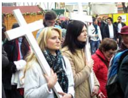
Pochod pro život 2009.