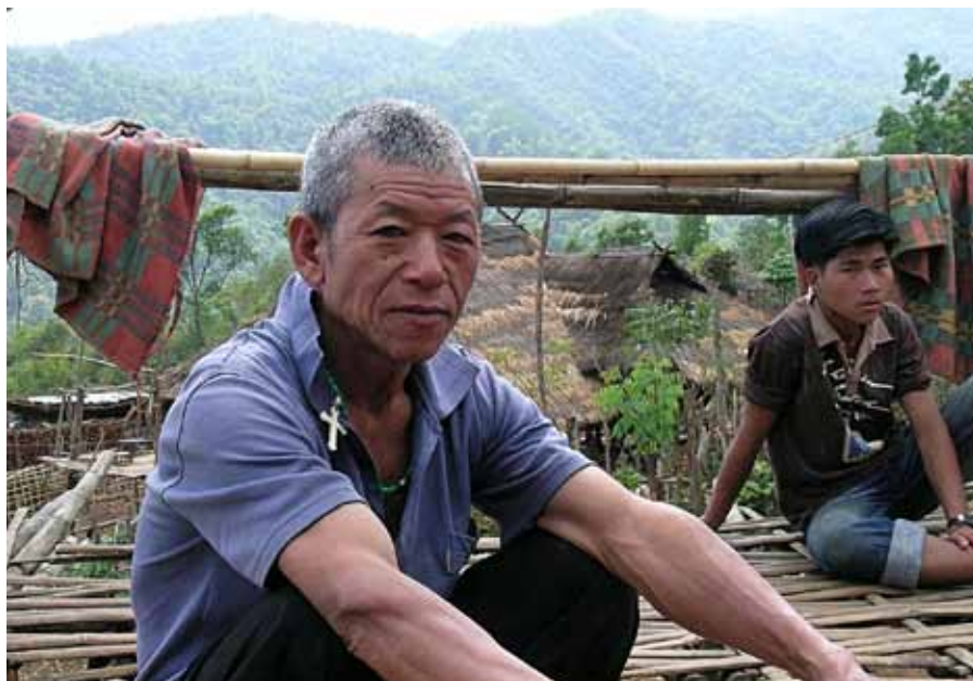
Akhský katolík v horské vesnici.