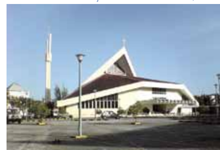
Katedrála Nejsv. Srdce v Kota Kinabulu, Borneo