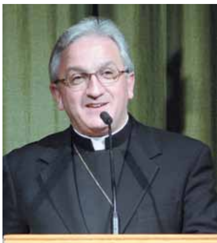
Mons. Celestino Migliore.