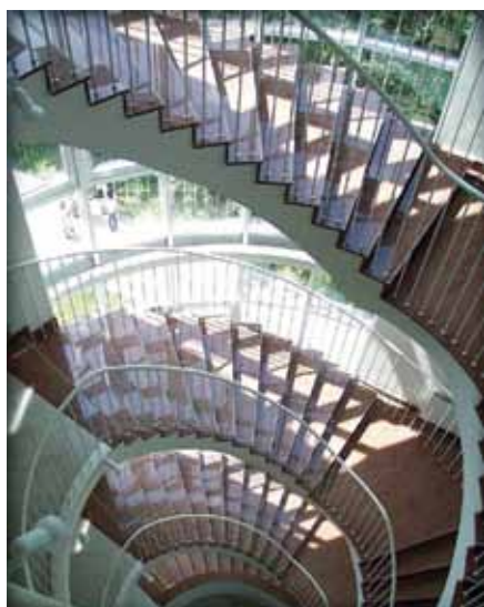
Kudy z krize českého zdravotnictví? (Schodiště správní budovy VZP v Sokolově)