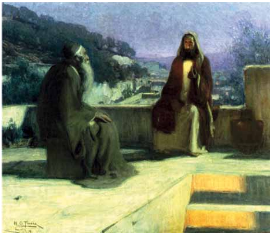
„Jestliže se nenarodí někdo z vody a z Ducha, nemůže vejít do Božího království.“ (Jan 3,5) Henry Ossawa Tanner: Ježíš a Nikodém (1899).

Vždy bylo v Církvi toto přesvědčení, že krví a touhou lze nahradit skutečný křest. Církev si od počátku osvojila zvyk uctívat mučedníky v den jejich smrti, která jim otevřela nebe, i když umírali ještě před přijetím křtu. Ostatně znamená-li křest připodobnění ke Kristu, připodobňuje se mučedník Kristu v jeho utrpení, kterým nám zasloužil milosti křtu. Má-li křest představovat naši účast v utrpení Páně, představuje ji mučednictví formou krvavou, a odtud má zcela zvláštní účinnost. Ve křtu krve se vrcholným způsobem projevuje láska ke Kristu, a proto křest krve má opravdu všechnu sílu křtu touhy, protože není mučednictví bez touhy po spojení s Kristem v lásce. To uznávala celá křesťanská tradice, a proto uctívala mučedníky, kteří zemřeli pro Krista před přijetím křtu, i když to byly třeba jen děti. 1