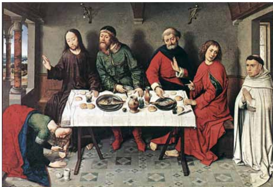
„Její mnohé hříchy jsou jí odpuštěny, protože projevila velikou lásku.“ (Lk 7,47) Dieric Bouts st.: Kající hříšnice (1440).

ný křest. Křest touhy však nepůsobí, jak je zřejmé, sám sebou neboli ex opere operato milost spojení s Bohem, nýbrž pouze ex opere operantis , z úkonu osobního, mocí úkonu lásky, na který Bůh odpovídá podobnou láskou (S. th. III, 66, 2).