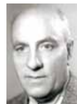
ThDr. Reginald Maria Dacík OP (1907–1988), český teolog, redaktor, publicista, kněz dominikánského řádu

3 Tradiční nauka hovořila o limbu, tedy stavu, v němž duše dětí, které umírají nepokřtěné, nezaslужují z důvodu prvotního hříchu odměnu blaženého patření, netrpí však žádnými tresty, neboť se nedopustily osobních hříchů. Tato teorie, vypracovaná teologicky ve středověku, se nikdy nestala součástí dogmatických definic učitelského úřadu, i když ji magisterium ve svých výrociích zmiňovalo až do II. vatikánského koncilu. Mezinárodní teologická komise (MTK) na základě hierarchie pravd víry a v kontextu univerzální spásitelné Boží vůle dospěla k závěru, že existují teologické a liturgické důvody pro naději, že děti, které zemřely nepokřtěné, mohou být spaseny a uvedeny do věčné blaženosti, i když Zjevení o tom nepodává výslovné učení (MTK, Naděje na spásu pro děti, které umírají nepokřtěné , Krystal OP, Praha 2008).