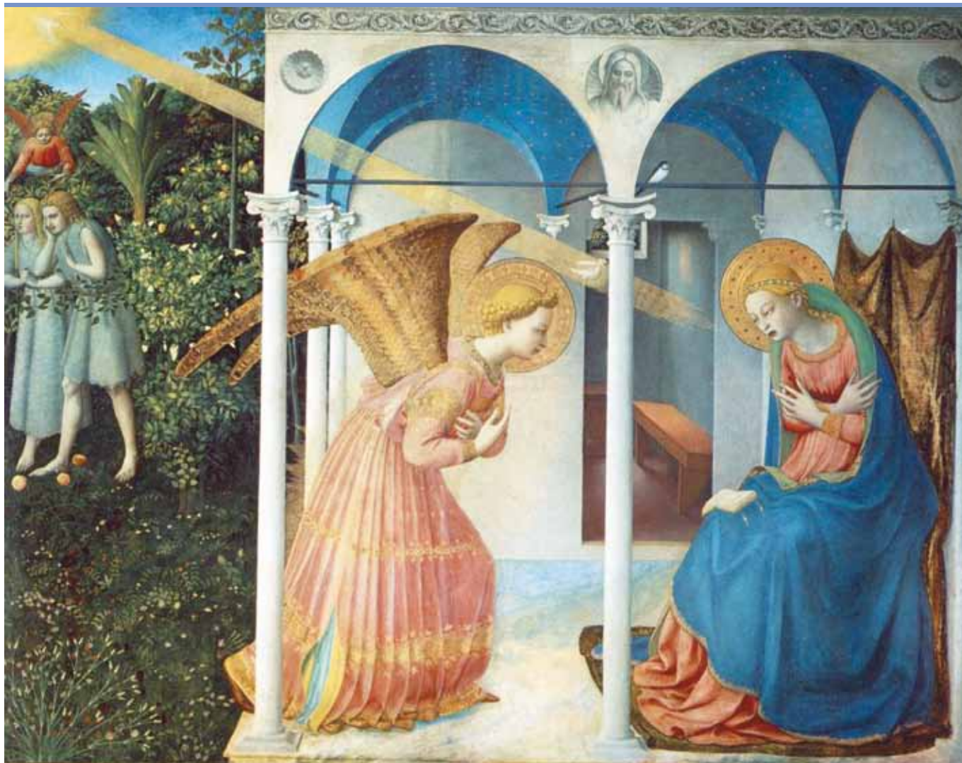
Fra Angelico: Zvěstování (1430–1432).