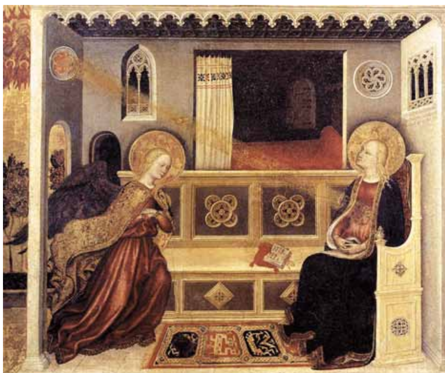
Gentile da Fabriano: Zvěstování (1425).

Ač byl ve vlastním božském řádu neviditelný, v našem řádu se stal viditelným, ač byl nepochopitelný, chtěl být pochopen, ač byl dříve než čas, začal být v čase, absolutní Pán veškerenstva zastínil svou nesmírnou vznešenost a přijal existenci služebníka, Bůh, kterého se nemůže dotknout žádné utrpení, neváhal stát se trpícím člověkem a nesmrtelný se podrobil zákonům smrti.