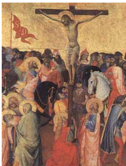
Agnolo Gaddi: Ukřížování, detail (1390–1396)

Právě poslední slovo této koncilní definice nám dává odpověď na otázku možnosti spásy nevěřících. Budou zavrženi všichni ti, kdo jsou daleko od Krista, jimž nezavřelo světlo evangelia a nesly-