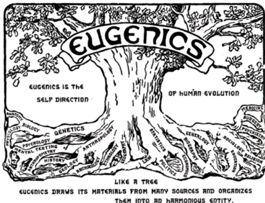
Logo druhého mezinárodního kongresu eugeniky (1921).

Mýlil se Galton, když usiloval o vylepšení lidstva biologickou cestou? Eugenika, pomineme-li její děsivé konotace politického rázu, které stály u jejích základů, byla založena rovněž na dosti sporných až pochybných postulátech z přírodních věd. Při kategorizaci lidí do skupin podle inteligence pracoval s vágními pojmy, jako např. „významnost“ zkoumaných jedinců. Systematicky podceňoval vlivy prostředí a nasbíraná data měla sloužit jen k potvrzení předem určených hypotéz či spíše dojmů Francise Galtona, nikoli k nalezení pravdy. A samozřejmě měly jeho ideje silný politický dopad. Pokud by lidé neplnili určené úkoly dobrovolně, měly být použity donucovací prostředky. Co kdyby se lidé z odlišných prostředí i přes zákaz nepřestali mísit? Co kdyby nechtěli mít účast na společnosti založené na eugenice? Galton nepředpokládal eugeniku s brutalitou nacionálních socialistů, ale donucení blíže neurčenými prostředky se nebránil.