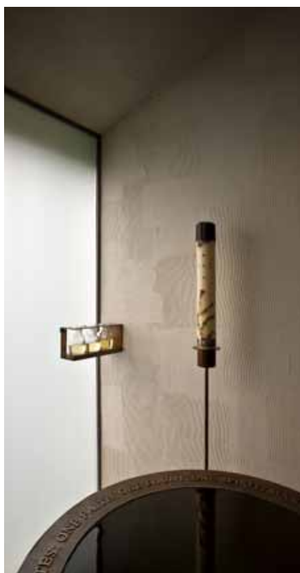
Křestní kaple s křtitelnicí, paškálem a oleji.

Ve křtu jsme byli ponořeni do Kristovy smrti a spolu s ním jsme vstali k novému životu. Zemřeli jsme hříchu a znovu jsme se zrodili k životu milosti. Bůh nás oděl milostí ospravedlnění a Božího dětství, odpustil nám všechny časné i věčné tresty za hříchy a vtiskl do naší duše nezrušitelné svátostné znamení. Tak jsme se stali členy Kristova mystického těla, Církve.