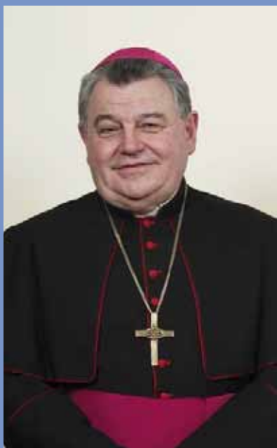
Mons. Dominik Duka OP

Arcibiskupství pražské zve věřící na intronizaci jmenovaného arcibiskupa pražského Mons. Dominika Duky OP. Kardinál Vlk předá novému arcibiskupovi svatovojtěšský stolec 10. dubna 2010. Slavnostní mše svatá v katedrále sv. Víta, Václava a Vojtěcha začíná od 10 hodin.