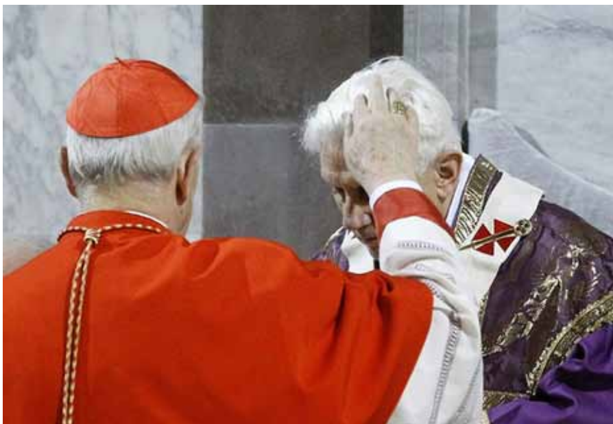
Benedikt XVI. přijímá popelec.

Minulý týden dálkově ovládaná „morální panika“ zasáhla dobře svůj cíl. Hon se soustředil na tu největší kořist, samotného Benedikta XVI., papeže, který provětral vzduch a zavedl řadu opatření