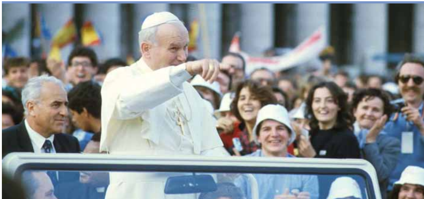
Jan Pavel II. během Světových dnů mládeže v Římě v roce 1984.