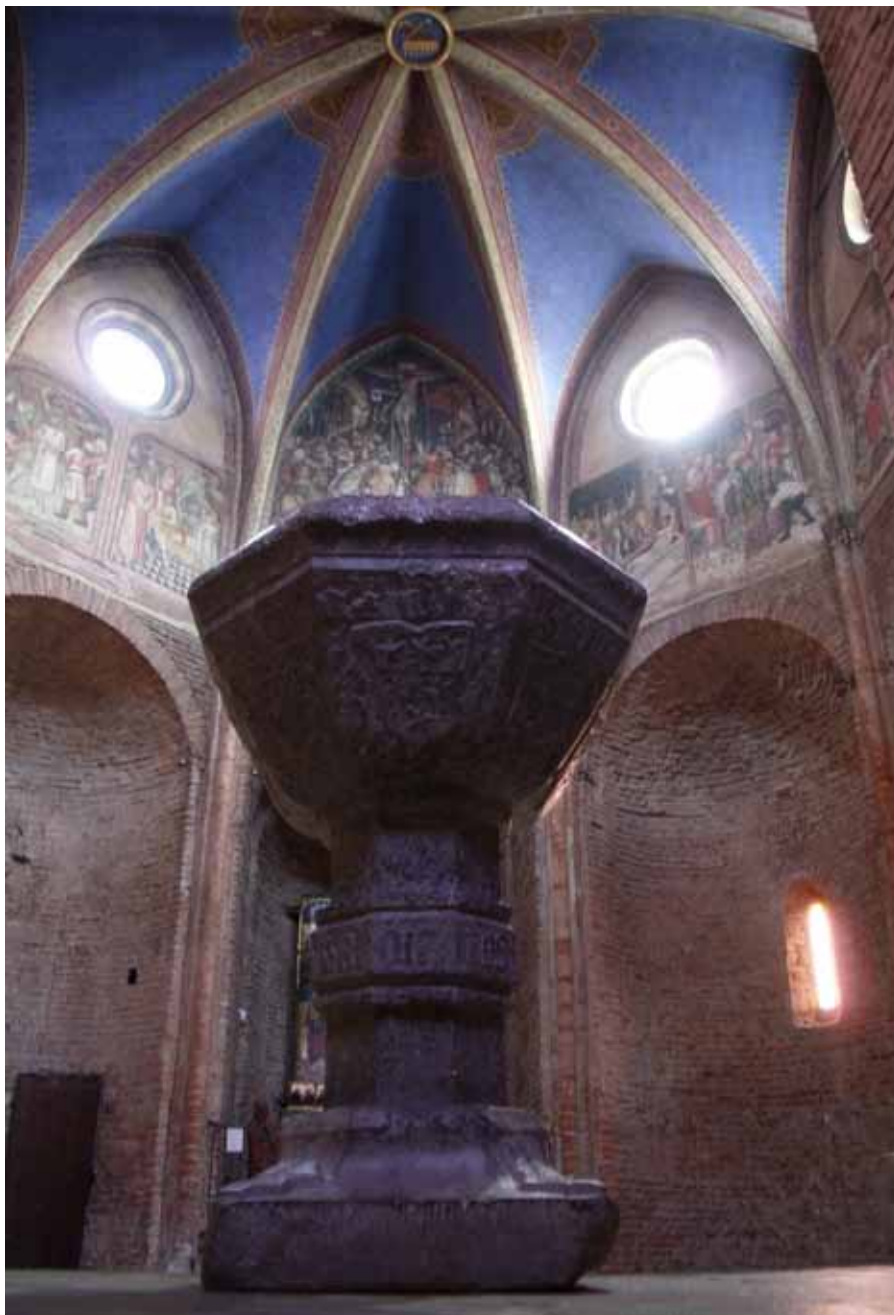
Křtitelnice z 9. století, kolegiální kostel Panny Marie Na Schodech, Moncalieri, Itálie.

S očištěním duše od hříchů je však spojeno zároveň vlití milosti Božího dětství. Křest pohřbil hřích, aby dal vzrůst novému životu duše, životu Božímu, který by rozkvetl na hrobu hříchu. Jen hřích nás činil Božími nepřáteli, odvracel nás od Boha. V té chvíli, kdy byla tato pře-