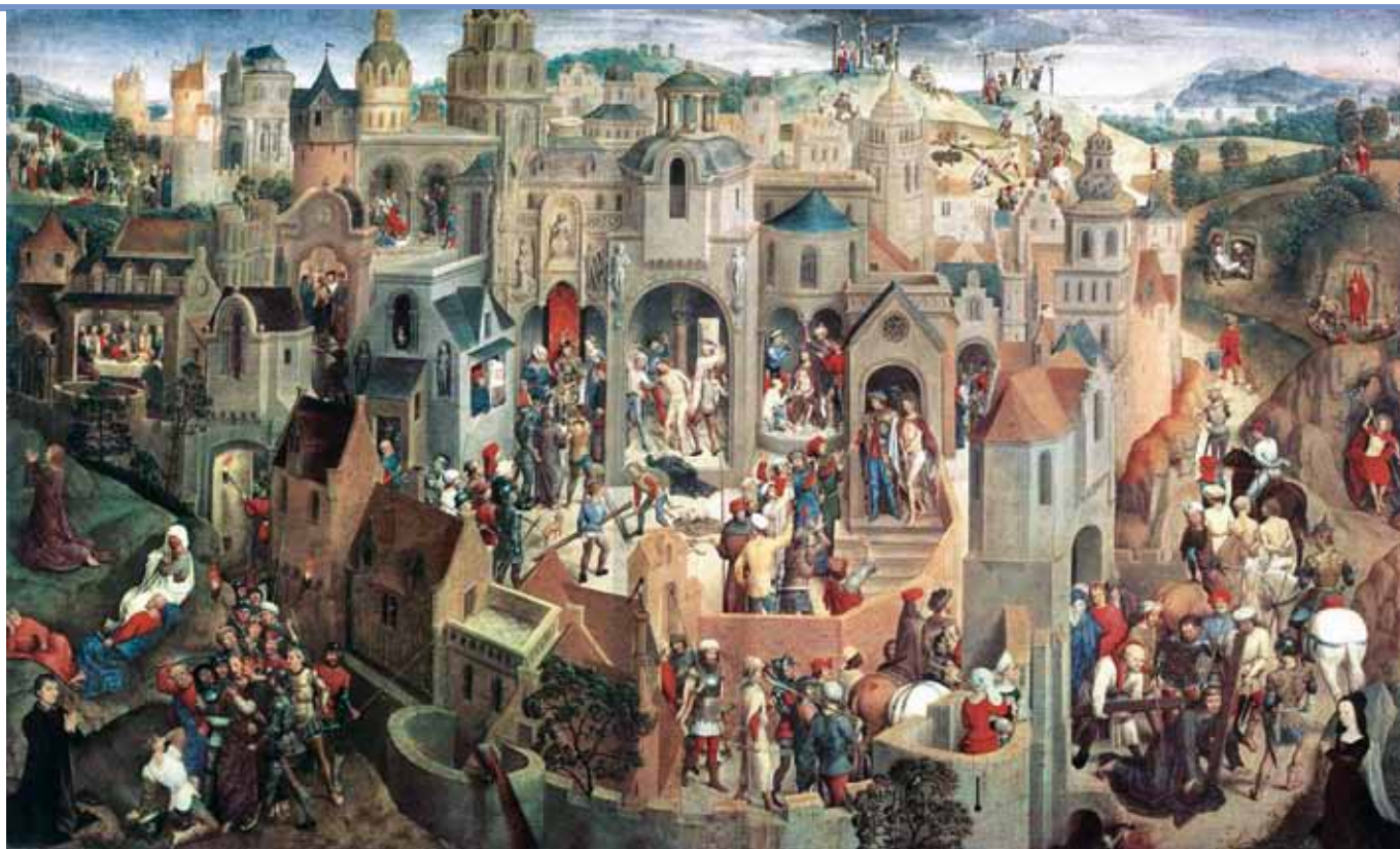
Hans Memling: Scény z Kristových pašiji (1470–1471).