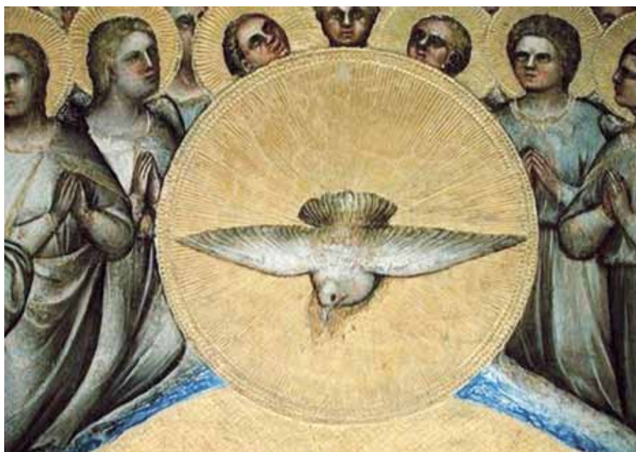
Giusto di Giovanni de' Menabuoi: Holubice Ducha svatého (1360–1370).

tým olejem dříve, než převzali svůj úřad, a požehnání bylo udělováno vztazením rukou nad těmi, kdo měli být požehnáni. Obojí obřad mohl proto velmi dobře naznačovat vylití Ducha Svatého.