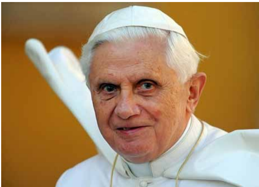
Než byl zvolen papežem, působil kardinál Joseph Ratzinger 25 let jako prefekt Kongregace pro nauku víry.

Kongregace pro nauku víry, či přesněji její někdejší prefekt, se dnes stal terčem kritiky. Ukazuje se, že navzdory tomu, co říkali jeho odpůrci, byl málo pancéřový, že v něm bylo málo inkvizitora při odsuzování pedofilie v Církvi. Tak alespoň zní hlavní teze, kterou se dnes snaží namluvit lidem téměř na celém světě. Přesto se navzdory velkému úsilí celé armády novinářů z New York Times nepodařilo najít ani jeden přesvědčivý argument, který by mluvil v neprospěch současného papeže. Naopak, ukazuje se, že kardinál Ratzinger si v téhle oblasti jméno panzerkardinal plně zasloužil, že byl reformátorem a zostřoval už beztak přísné a nekompromisní církevní normy.