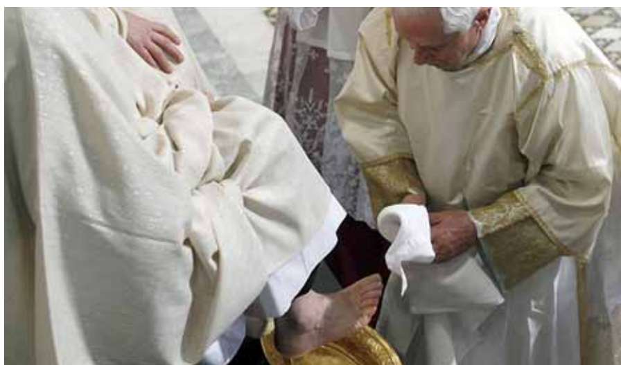
Benedikt XVI. umývá nohy.

Toto shromáždění konáme všichni společně v den Slunce předně proto, že je to den, v němž Bůh změnil tmu a beztvarou hmotu a stvořil svět, a dále proto, že v tento den vstal náš spasitel Ježíš Kristus z mrtvých. Nebot' den před Saturnovým dnem (tj. před sobotou) ho ukřižovali a den po Saturnově dni, to jest v den Slunce, se zjevil svým apoštolům a učedníkům a naučil je tomu, co jsme i vám předložili k úvaze.