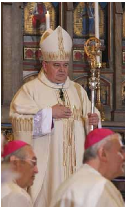
Mons. Dominik Duka převzal z rukou kardinála Miloslava Vlkva berlu a svatovojtěšskou katedru.

Závěrečná slova Markova evangelia jsou zprávou o Ježíšově zmrtnýchvstání. (Mk 16,9–15) Slavíme velikonoční oktáv. Velikonoce jsou jak pro Izrael, tak pro křesťany svátky života a svobody. Jsou naším největším a nejradostnějším svátkem. Ježíš žije, On je Pán, Ten, ve kterém Bůh – podle Exodu (Ex 3,14) „Ten, který Je“ – se stal jedním z nás. Žil náš život s námi, pro nás a za nás vydal i svůj život. Ježíšovy Velikonoce jsou svátky Toho, který dal život za své přátele, a proto apoštol Jan definuje Boha slovy: „Bůh je láska.“ (1 Jan 4, 8) Hlásat evangelium znamená hlásat život a naději na život. Prvním, kterým se Ježíš zjevuje, jsou ženy, na prvním místě Marie z Magdaly. Nevíra nám ale pomáhá, abychom, jako