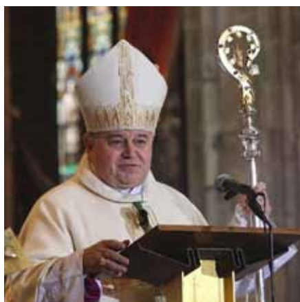
36. arcibiskup pražský Mons. Dominik Duka OP.