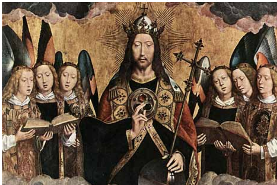
Hans Memling: Kristus obklopený adněskými hudebníky (detail), kolem 1480.

Není. Pro jejich milovníky a ctitele to je často otázka stejně emocionální jako pro jiného chorovod za dunění bubnů. Pozor, nechci říci, že chorál a bubny mohou pro nás být ekvivalentní. Chorál je nesmírně bohatým symbolickým systémem. Pro ty, kdo si jej osvojí, dokáže vyjádřit neuvěřitelné podrobnosti a jemnosti. Což dunění bubnů taky, ale pro černé Afričany. Pro nás, většinu Evropanů, je to na rozdíl od nich jen víceméně rytmický kravál.