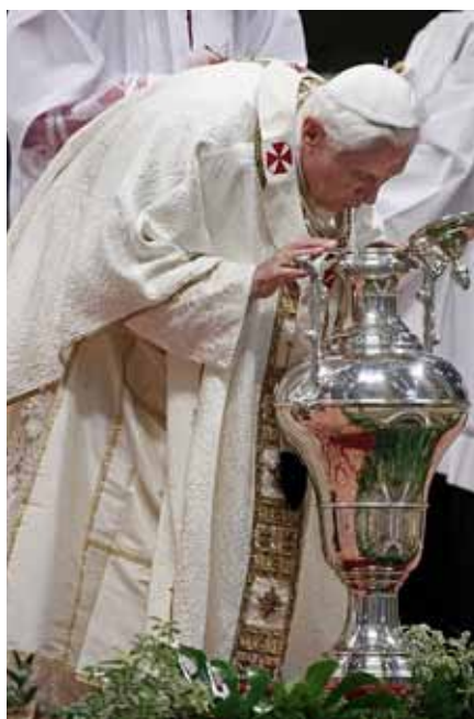
Benedikt XVI. světlí oleje na Zelený čtvrtek.

V těchto třech elementech je přítomno určité odstupňování. Chléb odkazuje ke všednímu životu. Je to základní každodenní dar života. Víno odkazuje ke slavnosti, k vytríbenosti stvoření, kterým se současně může zvláštním způsobem vyjadřovat radost vykoupěných. Olivový olej má široký význam. Je potravou, lékem, zkrášluje, připravuje k zápasu a dává sílu. Králové a kněží bývají pomazáni olejem, který je tak znamením důstojnosti a odpovědnosti jakož i síly, která přichází od Boha. V našem pojmenování – „křesťané“ – je přítomno tajemství tohoto oleje. Výraz „křesťané“, jímž byli Kristovi učedníci již v počátcích Církve označeni od pohanů, je odvozen od slova Kristus (srov. Sk 11,20–21), což je řecký překlad slova „Mesiáš“, které