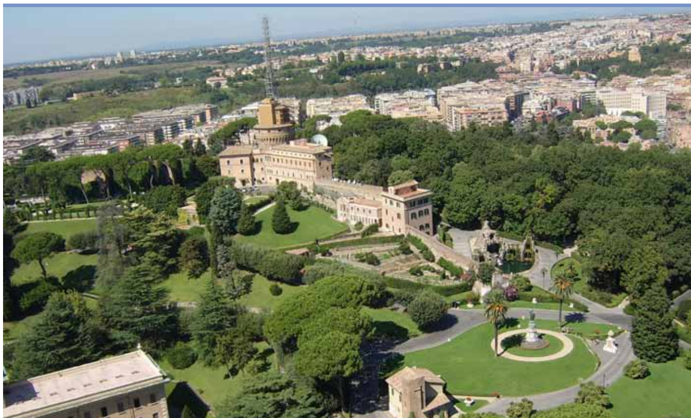
Budova Vatikánského rozhlasu.