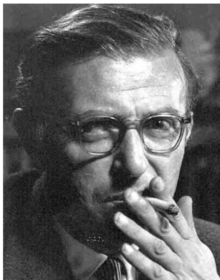
Jean-Paul Sartre.

Začátkem dvacátého století se oženil jistý francouzský vesnický lékař s dcerou velkostatkáře. Den po svatbě ke svému zděšení zjistil, že je jeho tchán na mizině. Znechucený muž se svou manželkou během čtyřiceti let manželství nepromluvil. Přestože u jídla komunikovali posunky a manželka označovala manžela slovy „můj nájemník“, měli spolu tři děti. Jedno z dětí tiché domácnosti Jean-Baptiste se oženil s dívkou, jejíž matka ji varovala před manželstvím a označovala ho za nekonečný řetězec obětí, v noci přerušovaný hrubostí. Krátce po svatbě se narodil roku 1905 syn. Jelikož Jean-Baptiste těžce onemocněl, matka dítě svěřila kojné a „spíš z povinnosti než z lásky“, jak nás tento syn později informoval, se o muže starala. Dítě v péči kojné téměř zemřelo na střevní katar. Toto osudem poznamenané dítě později vešlo ve známost jako Jean-Paul Sartre.