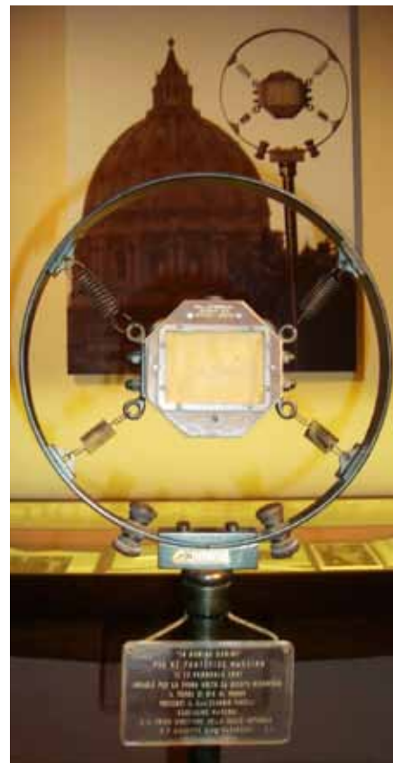
První mikrofon Vatikánského rozhlasu.

„V době Pražského jara užší výbor řeholních představených, kteří chtěli jednat s vládou o obnovení řeholních komunit, sesbíral údaje o době, kterou tehdy žijící členové a členky řádů a kongregací strávili ve vězení,“ vypráví P. Koláček. „Vyšlo jim astronomické číslo 42 763 let. ... Je nám při pohledu na to, co se děje doma, jako při ranních červánkách – ano, svítá.“