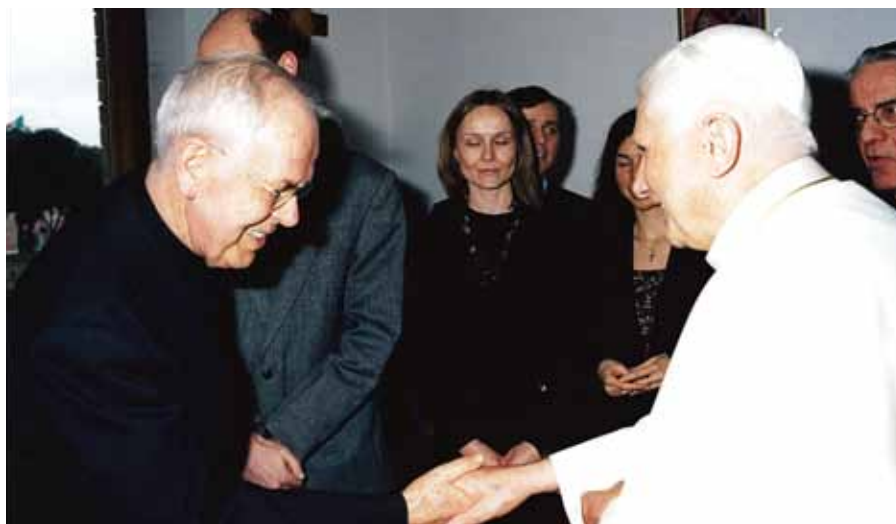
Benedikt XVI. se zdraví s P. Josefem Koláčkem SJ při své návštěvě ve Vatikánském rozhlasu.