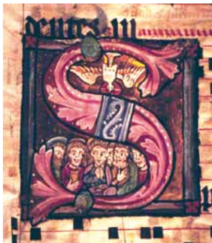
Dar Ducha Svatého v iniciále S (14. stol.)

Oproti tomu „charismata, ať mimořádná, nebo prostá a skromná, jsou milosti Ducha Svatého, které přímo nebo nepřímo slouží užítku Církve a jsou zaměřeny k jejímu budování“ (KKC 799). Jsou to tedy dary určené dobru společenství skrze jednotlivce. Mělo by to tedy být společenství, kdo o charismata prosí, kdo za ně děkuje, kdo s nimi spolupracuje, kdo jejich účinnost touto spoluprací rozmnožuje, nikoli jednotlivec. Zdá se to zřejmé, ale nesmíme zapomínat, že jsme dětmi doby (a nikoli krátké), ve které je všeobecně kladen důraz na úspěšnost, konkrétní měřitelnou užitečnost (co mléko nedává, do chléva nepustit). Tento způsob myšlení se nutně projevuje (bohužel) i v našem náboženském smýšlení, takže se nám právě charismata jeví jako jakási legitimace kvality naší zbožnosti, a někdy dokonce dokladem naší svatosti, přestože prakticky všichni autoři zdůrazňují nezávislost charismat na svatosti obdarovaného jedince. Právě zde se musíme bránit tlaku naší doby s požadavky na to, aby se člověk „prosadil“, aby „obstál v konkurenci“, „aby podal výkon odpovídající námaze“. Dar pro společenství není dáván pouze skrze jediného člena, je složitou, Bohem režírovanou kombinací příspěvků více lidí, a ne nutně každý musí mít charakter „oslavující“ svého nositele. Tež ono „dobro celku“ nemusí být okamžitě všem patrné, jak jsme toho