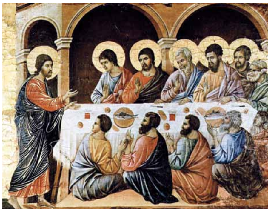
Duccio di Buoninsegna: Poslední večeře (1308–1311).

A tím je člověku-poutníku, který se žije svátostí eucharistie na cestě pozemským životem, dána záruka budoucí slávy . Věčný život znamená naprosté sjednocení duše s Bohem. A eucharistické spojení je symbolem, předobrazem a předchutí onoho věčného spojení a sjednocení, které už nikdy nebude rozdvojeno.