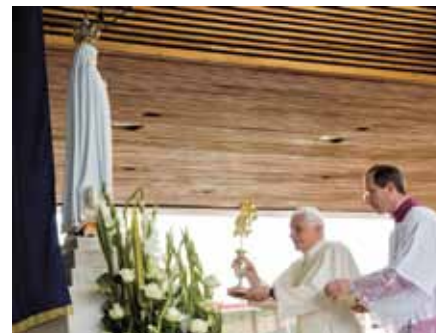
Předání zlaté růže.

Milovaná Matko nás všech, zanechávám ti zde ve tvé Fatimské svatyni zlatou růží, kterou jsem přivezl z Říma, jako znamení vděčnosti papeže za divy, které