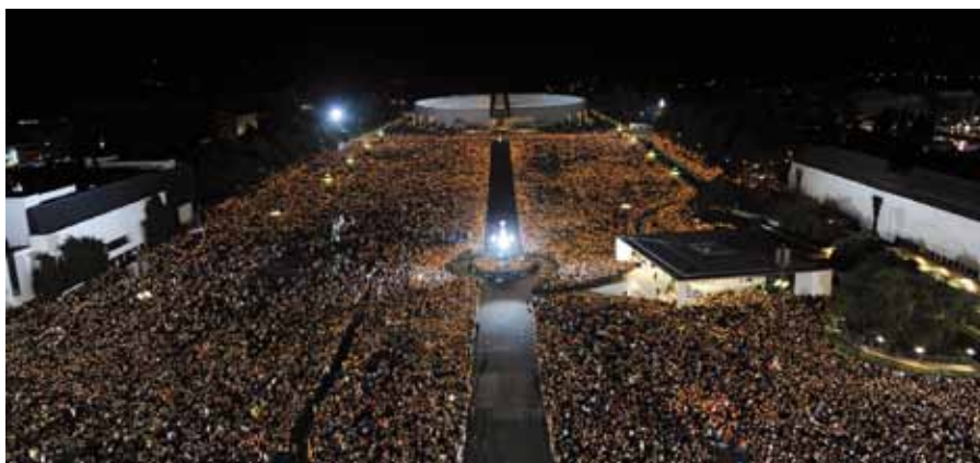
Žehnání pochodní před kaplí Zjevení ve Fatimě.

V úterý 11. května dorazil Benedikt XVI. do Lisabonu, kde ho uvítaly hlasitým voláním tisíce lidí. Po uvítání místním arcibiskupem se setkal s prezidentem Aníballem Cavaco Silva a jeho rodinou. O půl šesté místního času přijel papež na Obchodní náměstí, známé také jako Palácové, podle královského paláce, který zde stál a byl zničen v roce 1775. Primátor Lisabonu tu Svatému otci předal symbolické klíče od města. Ve čtvrt na sedm pak začala na náměstí eucharistická bohoslužba, které se na náměstí i v přilehlých ulicích účastnilo čtvrt milionu lidí.