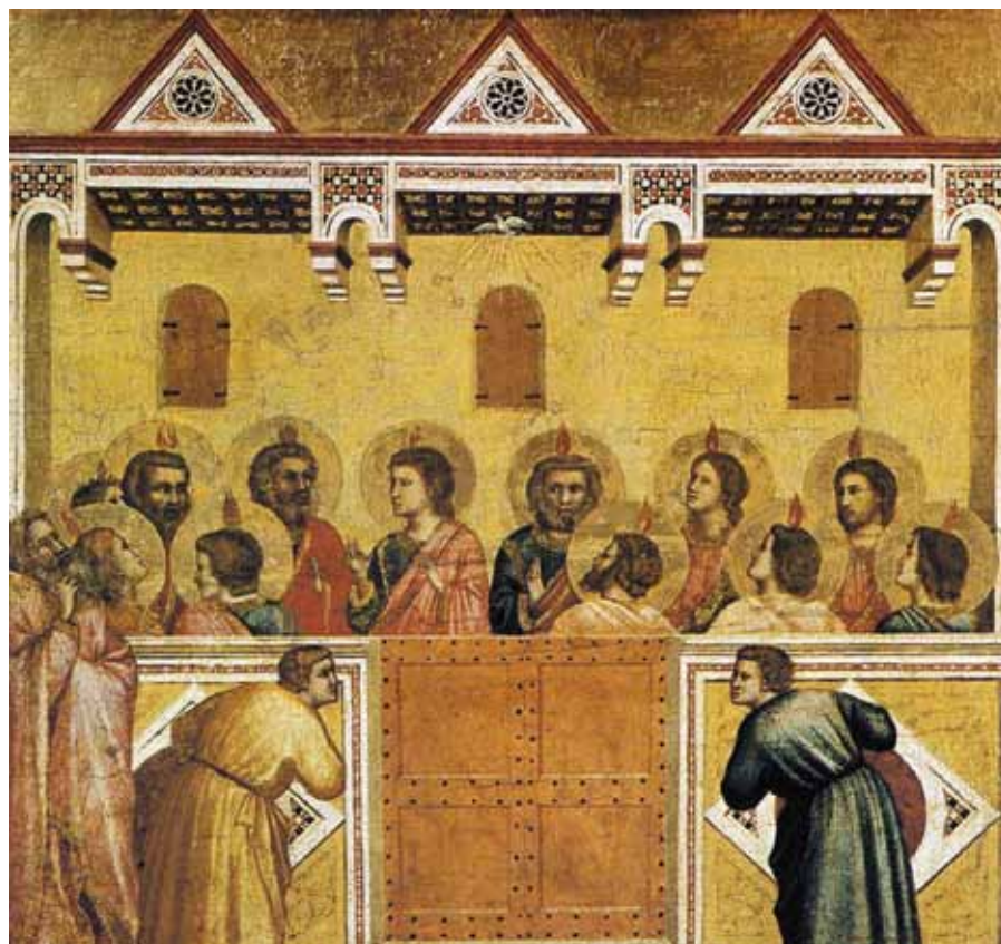
Giotto di Bondone: Letnice (1320–1325).

Té jednoty, která vede k neporušitelnosti, se našim tělům dostalo v křestní koupeli, duším ji dal sám Duch.