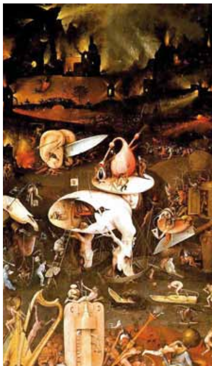
H. Bosch: Zahrada pozemských slastí, detail (1503–1504)

Bezradnost, ne-li přímo malomyslnost, kterou pociťuje katolík před volbami, se nevysskytuje jenom u prostého Boží-