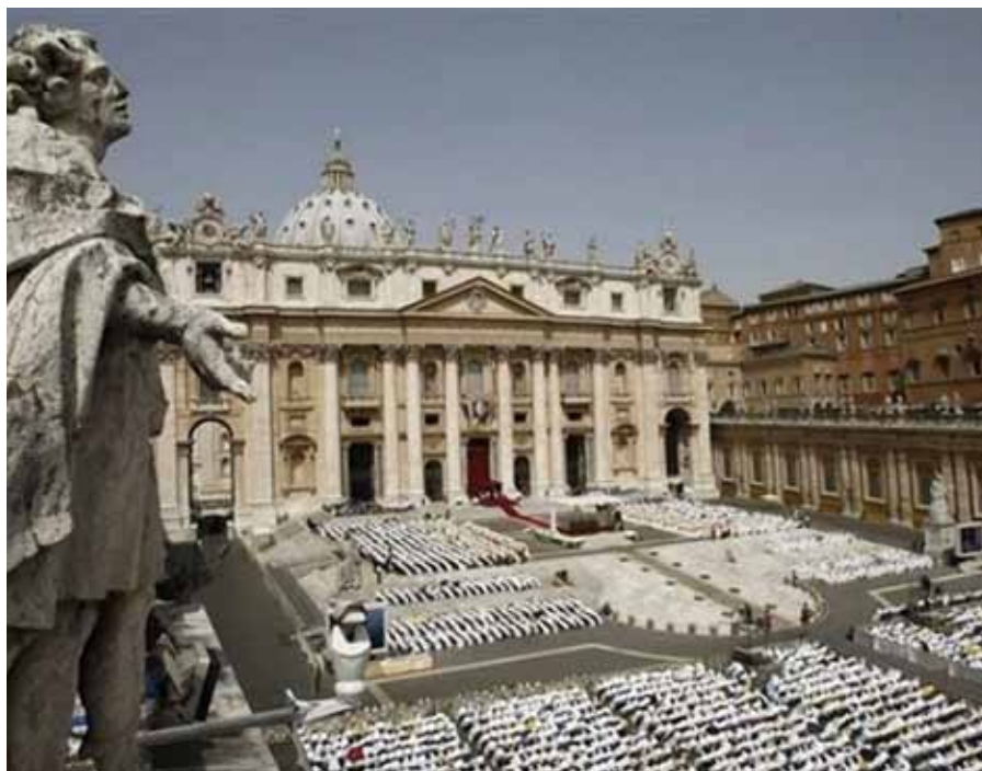
Při Slavnosti Nejsvětějšího Srdce Ježíšova 11. června koncelebrovalo před bazilikou sv. Petra na 17 000 kněží z celého světa.

Tato myšlenka se podivným způsobem znovu vynořila v osvícenství. Chápalo se, že svět předpokládá Stvořitele. Tento Bůh však stvořil svět, a pak se pryč od něho zjevně distancoval. Svět měl na jedinou soubor svých zákonů, podle nichž se rozvíjel a do nichž Bůh nezasahoval, nemohl zasahovat. Bůh byl pouze vzdáleným počátkem. Mnozí si možná ani