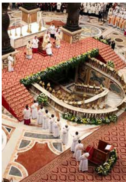
Kněžské svěcení v bazilice sv. Petra 20. června.

Jsme si velmi dobře vědomi této účasti všech laiků v Kristově kněžství a zdůrazňujeme její chápání a prožívání jako nutnou podmínku jak laického apoštolátu, tak rozvoje liturgického hnutí. Přitom však zdůrazňujeme právě tak potřebu zvláštního, plného kněžství, které by obsahovalo celou moc, již dal Kristus Církvi a jejím představitelům. A jsme přesvědčeni, že jen v náležitém chápání potřeby spolupráce je možné vítězství Kristovy myšlenky, která nikdy neovládá lidstvo tak, že by si je nemohla podmanit lépe k jeho největšímu štěstí a záchraně. Jen z hluboké součinnosti kněze a laiků, založené na pevných dogmatických základech účasti laiků v Kristově kněžství, můžeme očekávat nový, velký rozkvět Kristovy myšlenky.