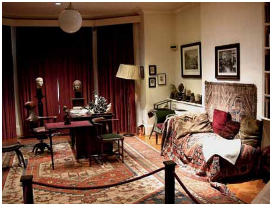
Londýnská pracovna profesora Freuda s pověstnou pohovkou pro pacienty.

Freudovské ego je zbaveno duchovní dimenze i osobnosti. Stává se tak pasivním prvkem, pouhým jezdcem na splašeném koni. Freud si klade otázku, jak