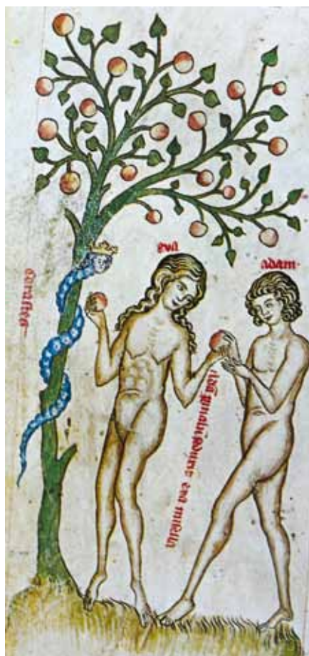
Adam a Eva, Pasionál abatyše Kunhuty (14. stol.)

Všimneme-li si tohoto nejstaršího inspirovaného textu o manželství, nalezneme v něm téměř vše, co o manželství můžeme říci. Z textu Genesis především plyne, že původcem manželství je sám Bůh, jenž stvořil člověka a uložil mu, aby naplnil svým potomstvem zemi. I když manželství není nutné pro každého jednotlivce, je nutné pro lidskou společnost. Odmyslíme-li si manželství, je sice možné, aby lidstvo početně vzrůstalo, ale jen zce-