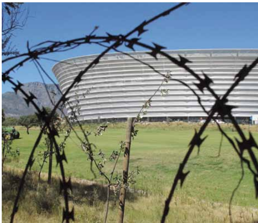
Stadion v Kapském městě.

To všechno už tam nebude. Ale co tam tedy bude? To, co si vybrala Marie. Tam budeme syceni a nebudeme sytit druhé. Tam bude v plnosti a dokonalosti to, co si zde vybrala Marie, když z bohatého stolu, z Pánových slov, sbírala alespoň drobky. Chcete vědět, co tam bude? Sám Pán říká o svých služebnících: Amen, pravím vám: Pozve je ke stolu, bude chodit od jednoho k druhému a obsluhovat je.