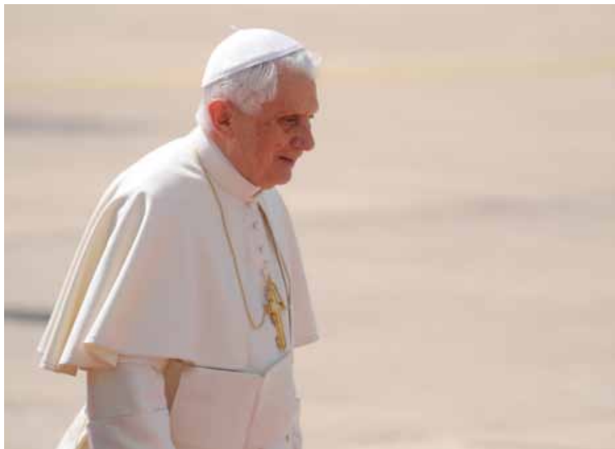
Svatý otec Benedikt XVI.

V srpnu se Řím vylidňuje. Ani papež v něm není. Řídí Církev z Castel Gandolfo, z kopců nad jezerem Albano, kam Římané odedávna v létě prchali před úmorným horkem kamenného města. Prázdniny to byly tentokrát pracovní. Papež se poprvé vzdal letní cesty do Alp. Místo toho se pustil do práce nad třetím dílem trilogie o Ježíši z Nazareta. Druhý díl se už překládá, téměř do dvou desítek jazyků současně. O kádru papežských spolupracovníků nepříliš dobře svědčí fakt, že překlad tentokrát nebyl svěřen profesionálním překladatelům, nýbrž úředníkům z Římské kurie. Nerad to říkám a doufám, že se mýlím, ale takový přístup k věci věští katastrofu. Zkušenost ukazuje, že monsignori dlouhá léta žijící v italském prostředí mají vážné potíže i s překladem běžných dokumentů, natož s takovým dílem teologické literatury jako Ratzingerův Ježíš z Nazareta. Ale opakuji, moc rád bych se pletl.