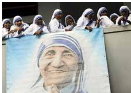
V indické Kalkatě proběhly oslavy 100. výročí narození Matky Terezy, zakladatelky Misionářek lásky.