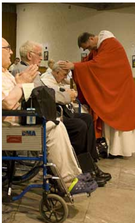
Pomazání nemocných

Pokud měl člověk možnost zbavit se hříchů ve svátosti pokání, přispívá pomazání nemocných k hlubšímu prozáření duše rozmnožením milosti a alespoň čás-