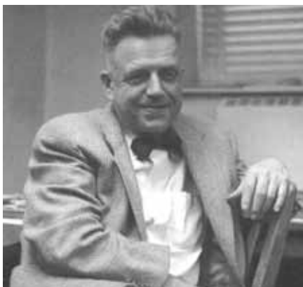
Dr. Alfred C. Kinsey.