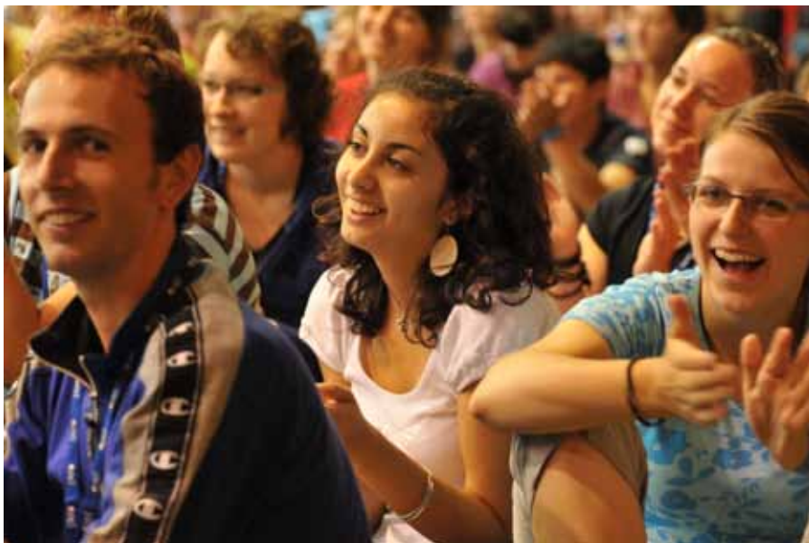
Celostátní setkání animátorů v Kroměříži.

zuje, že víra je schopna oslovit mladého člověka i ve 21. století a že dnešní Církev je stále aktivní a mladá. Zdůraznil také, že služby animátorů si má Církev vážit.