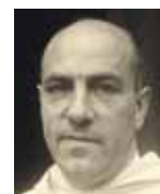
ThDr. Reginald Maria Dacík OP (1907–1988), český teolog, redaktor, publicista, kněz dominikánského řádu

mezen a postupně se vyvíjel. Papež Evžen IV. vypočítává v dekretu o svátostech tato místa, jež má kněz pomazat olejem: oči, uši, nos, ústa, ruce, nohy a bedra. Později se upustilo od mazání beder a nohou a zbyla tak jen ústrojí pěti vnějších smyslů – zraku, sluchu, čichu, chuti a hmatu. Tam, kde je pro nás první původ hříchu, praví svatý Tomáš, tam se musí používat léku. Proto se mažou místa pěti smyslů ( Sth , Doplněk, 32, 6).