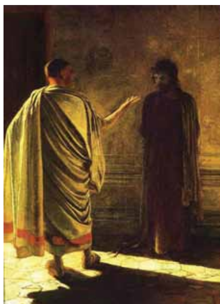
Nikolai Ge, Co je pravda – Kristus a Pilát (1890)

Dialogické hledání pravdy není nic nového. Nalézáme je u starých antických filosofů Sókrata, Platóna, Aristotela a jiných. Aristoteles ve své Metafyzice tvrdí, že „chceme-li nalézt pravdu, je nutno nejprve vzít v potaz názor těch, kteří smýšlejí jinak.“ To je velmi závažné tvrzení, které by mohlo vést k omylu, že na pravdě je třeba se nějak dohodnout. Ale tak to Aristoteles nemyslel. Šlo mu o to zjistit, zda druhý uvažuje stejně, tedy jestli druhému správně rozumíme, jestli jsme opravdu pochopili, co chce ten druhý svým tvrzením vyjádřit. Platón ve Faidónu vkládá do úst Sókrata otázku vůči těm, kteří s ním diskutují. Sókratés se jich znovu ptá, aby se ujistil, že jim dobře rozumí: Je to, Simmio a Kebete, to, co teď máme uvážít? Oni řekli: Ano, je tomu tak. – Jen aby nám nic neušlo, podotýká k tomu Sókratés.