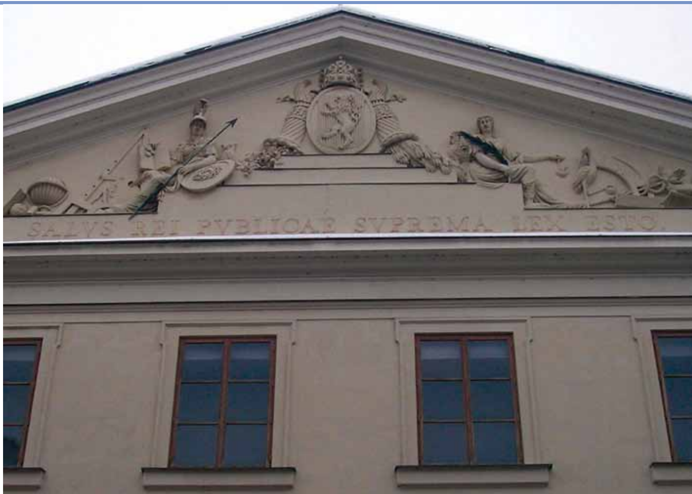
Hlavní průčelí bývalého Thunovského paláce ve Sněmovní ulici s nápisem Salus rei publicae suprema lex esto!