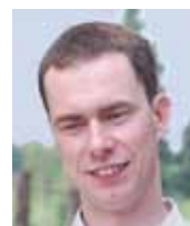
Autor působí jako právník ve státní správě.