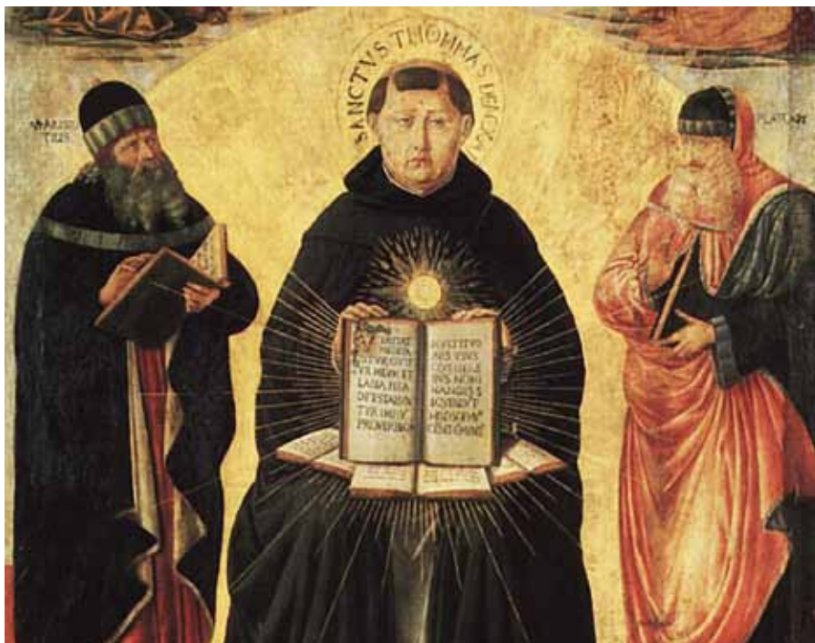
Učitelé dialogu Aristoteles, Platón a svatý Tomáš Akvinský Benozzo Gozzoli, Sláva svatého Tomáše, detail (1485).