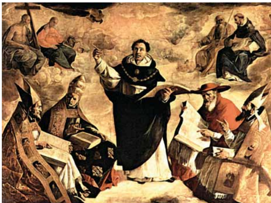
Francisco de Zurbarán, Apotheóza sv. Tomáše Akvinského (1631).

I smrt a trýzeň a tisícera muka mu byly jakoby dětskou hrou, jen když mohl něco vytrpět pro Krista.