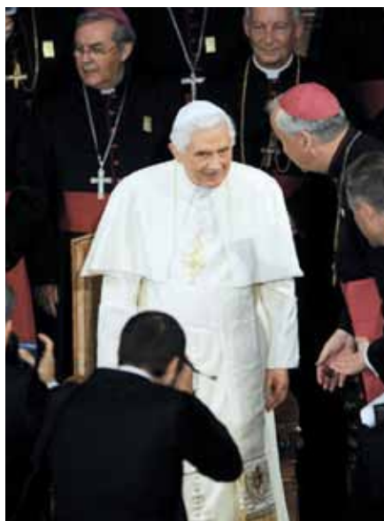
Benedikt XVI. na setkání s biskupy Anglie.

Doufám, že místní katolická církev si z těch čtyř dní odnese mnohá ponaučení. Nejdůležitější se týká správného chápání liturgie. Ve Westminsterské katedrále papež sloužil takovou liturgii, o níž je přesvědčen, že je k uctívání Boha nejvhodnější. Zavedl praxi umístování křížů uprostřed oltáře, která však v Anglii stále není následována. Při všech mších recitoval kánon v latině. To jsou skutečnosti, které netěší magické kruhy liberálních biskupů kontrolujících byrokracii a liturgickou praxi Církve v Ang-