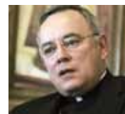
Mons. Charles J. Chaput OFM Cap, arcibiskup Denveru