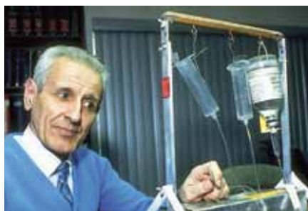
Je líbo smrt? – Jack Kevorkian.

leně s využitím součástek, které nalezl v garáži či nakoupil na bleším trhu. Děsivý systém sestával ze tří nádrží, z nichž vedly vývody do paže pacienta. Asistent zapíchl vývod do žíly tak, aby do těla proudil solný roztok. Teprve pacient sám aktivoval stisknutím tlačítka postupný přísun barbiturátů a chloridu draselného. Dotyčný byl zabit během dvou minut. Thanatron stihl Kevorkian použít na úmrtí dvou pacientů, poté přišel o lékařské oprávnění a tím ztratil přístup k látkám, které používal. Zkonstruoval tedy další zařízení s cynickým názvem Mercitron ( mercy = milosrdenství ). Základem přístroje byla plynová maska s přísunem oxidu uhelnatého, který opět inicioval sám pacient.