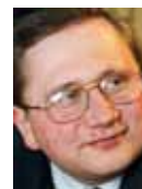
Autor je novinář a komentátor, šéfredaktor časopisu Duše a hvězdy, člen MKD a HPŽ ČR.

Článek byl zveřejněn na webovém portálu Duše a hvězdy ( http://cirkev.wordpress.com ) a v upravené verzi i v Konzervativních listech ( www.konzervativnilisty.cz ).