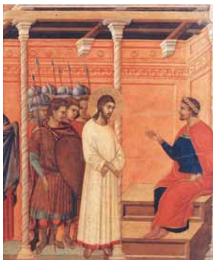
„Proto jsem přišel na svět, abych vydal svědectví pravdě.“ Duccio di Buoninsegna: Kristus před Pilátem (1308–1311)

Ve Spojených státech, kde je stále 80 procent křesťanů, z nichž mnozí praktikují svoje náboženství, se vládní instituce stále víc a víc snaží diktovat, jak mají služebníci Církve vykonávat svoji službu, a nutí je konat aktivity, které ničí jejich katolickou identitu. Objevují se také snahy odrazovat od hlásání některých článků katolické víry anebo je kriminalizovat jako „nenávistné“. Naše soudy a legislativa dnes běžně provádějí kroky poškozující manželství a rodinný život a snaží se z veřejného života vymýt křesťanskou symboliku a znamení jejího vlivu.