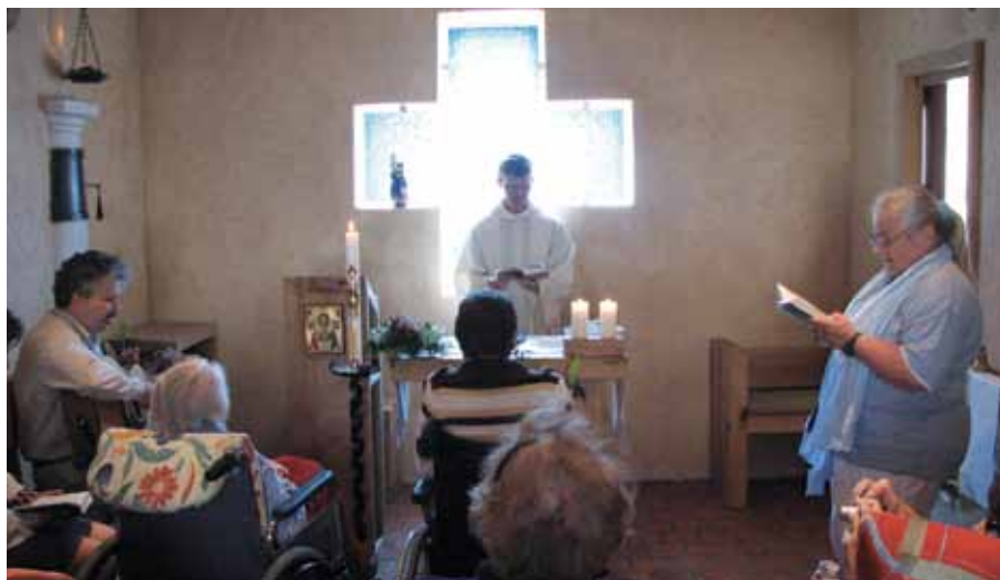
Křest klientky hospice.

Rozhovor s Evou Machovou o hospici Dobrého pastýře