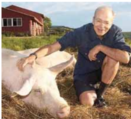
Vidíte rozdíl? – Peter Singer.

Peter Singer se narodil roku 1946 v Melbourne v rodině vídeňských židů, kteří utekli do Austrálie těsně před anšlusem Rakouska. Prarodiče měli méně štěstí, zahynuli v koncentračních táborech. Singer vystudoval v Melbourne právo, filosofii a historii, magisterský titul získal za práci s názvem Proč bych měl být mravný? Před příchodem na Princeton studoval a přednášel též na Oxfordu a na New York University.