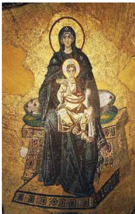
Theotokos, Hagia Sofia, Istanbul (9. stol.)

Vzhledem k tomu, že my bychom o tamních mlčících církvích mlčet neměli, chtěl bych připomenout dvě sy-