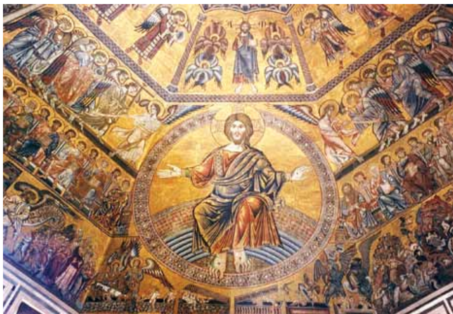
Křesťus na trůnu, Baptisterium San Giovanni, Florencie (13. stol.).

Hospodinova sláva. Jaká sláva? Je to zajiště kříž, na němž byl oslaven Kristus. Neboť on je odlesk slávy Otcovy, jak sám řekl před svým utrpením: Nyní je oslaven Syn člověka a Bůh je oslaven v něm, ano, hned ho oslaví. Slávou nazývá Kristus na tomto místě své vyvýšení na kříž. Neboť kříž je Kristovou slávou, ano, jeho povýšením. Sám přece říká: A já až budu vyvýšen, potáhnu všechny k sobě.