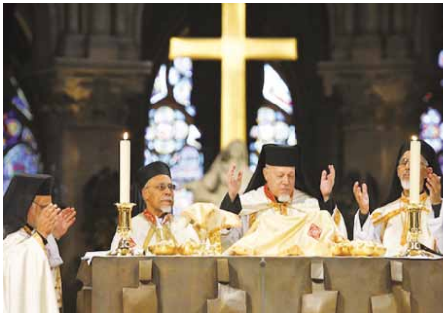
Koptský patriarcha Antonios Naguib.