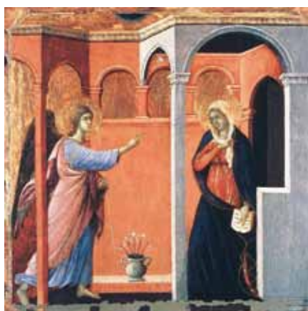
Duccio di Buoninsegna: Zvěstování (1308–1311)

k nimž lidská osoba má přirozený sklon. V důsledku toho, že lidskou osobu nelze omezit na jakousi svobodu, která rozhoduje o sobě samé, a vzhledem k tomu, že lidská osoba má určitou duchovní a tělesnou strukturu a současně cítí i původní morální požadavek milovat a respektovat lidskou osobu jako cíl a nikoli jen jako pouhý prostředek, stává se pak vnitřně nutným i respektování některých základních lidských dober, neboť jinak se upadá do relativismu a libovůle.“ 6