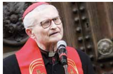
Kard. Janis Pujats.

Janis Pujats se narodil roku 1930 v Navireni, na kněze byl vysvěcen roku 1951. Vyučoval dějiny umění a liturgiku v semináři v Rize. V letech 1979–1984 byl generálním vikářem místní arcidiecéze. Roku 1984 byl tajnou policií prohlášen za nežádoucí osobu a přeložen na venkovskou farnost. Roku 1988 získal titul čestného papežského preláta a v roce 1991 byl jmenován arcibiskupem. O sedm let později ho Jan Pavel II. jmenoval kardinálem Rigy – „in pectore“ – a tři roky nato bylo jmenování zveřejněno. Kardinál Pujats je vedoucí postavou v boji proti šíření homosexuality. Organizuje veřejné protesty proti homosexuálním průvodům a žádá lotyšskou vládu, aby takové demonstrace zakazovala.