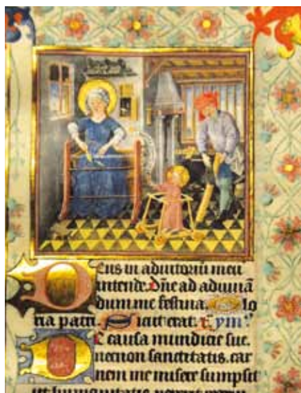
Svatá Rodina. Kniha hodinek Kateřiny Kleveské (1440)

na chlapci potřebují vzor starších mužů, jež napodobují. A nejběžnější je, že napodobují své otce. Když je nemají, napodobují teenagery kolem sebe. A to jsou hrozné vzory. Jsem překvapen, že v Evropě o tom nikdo nechce mluvit.