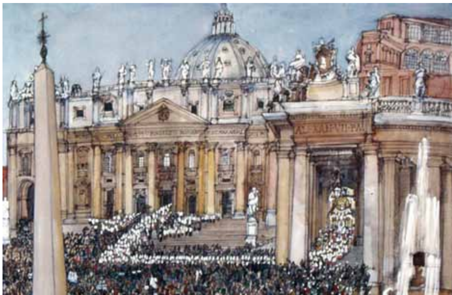
Franklin McMahon: II. vatikánský koncil, zahajovací procesí.

jít pravou Církev: „Tato Církev, ustavená a uspořádaná na zemi jako společnost, subsistuje (uskutečňuje se) v katolické církvi“ ( Lumen gentium 8). A aby se zabránilo každému nedorozumění ohledně identifikace pravé Kristovy církve s církví katolickou, je připojeno, že se jedná o Církev, která „je řízena Petrovým nástupcem a biskupy ve společenství s ním“ ( Lumen gentium 8).