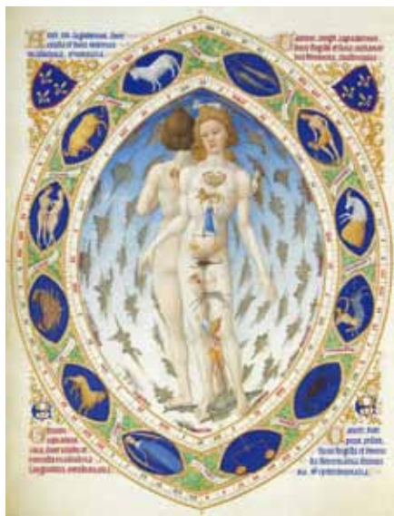
„Anatomický člověk“. Trés Riches Heures (15. stol.)

Nyní již můžeme nahlížet, že tzv. lidská práva nejsou příčinou lidské důstojnosti, ale naopak jejím důsledkem . Neboť pouze tehdy, když má lidská přirozenost zcela určitou podobu (např. když není materialisticky redukovatelná) a když