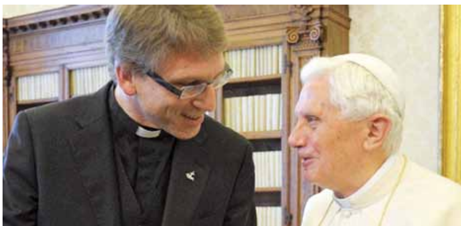
Benedikt XVI. a Olav Fykse Tveit.

Pro vnímavého pozorovatele byla papežská audience přinejmenším podivná. Při podobných příležitostech papež mívá téměř vždy připravený projev, a pokud chybí, objeví se alespoň oficiální komuniké nebo oboustranná deklaráce. Tentokrát nebyl ani projev, ani oficiální prohlášení, ani deklaráce. Vůbec nic. Tveitovo setkání s papežem by asi zcela zapadlo, kdyby se kolegyni z anglické redakce rozhlasu nepodařilo norského pastora tak trochu vyprovokovat. Šéf ekumenické organizace se snažil o velkou zdr-