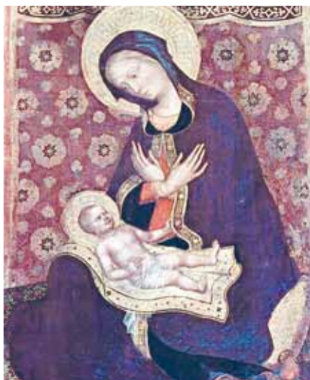
Gentile da Fabriano: Madona (1416). Foto: art.com

kou a životem; a proto ti vyšel naproti, připodobnil se ti, stal se Ježíšem, Boho-člověkem, ve všem ti podobným kromě hříchu; sebe samého dal za tebe smrtí na kříži, a tak ti dal nový život, svobodný, svatý a neposkrvněný“ (srov. Ef 1,3–5).