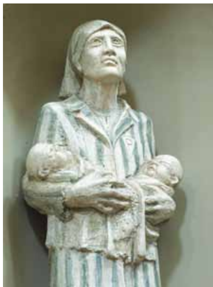
Socha S. Leszczyńské.

Situace se změnila v květnu 1943, tedy měsíc po uvěznění Leszczyńských. Náhoda, nebo důkaz neuvěřitelného Božího záměru? Děti árijského vzhledu, s modrými očima a světlými vlasy, byly