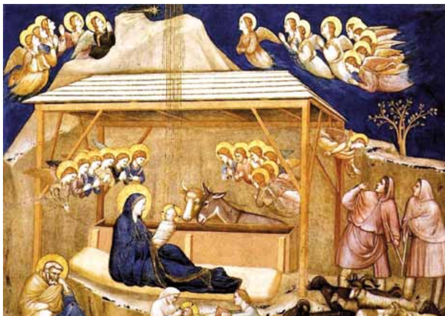
Giotto di Bondone: Narození Páně (1310).

Svatostí křtu ses stal chrámem Ducha Svatého. Nedopusť, aby tak vznešený host pro tvé špatné skutky od tebe odešel a aby tě ďábel znovu uvrhl do svého otroctví; neboť výkupným za tebe je Kristova krev.