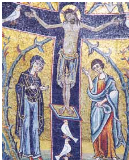
Mozaika v bazilice sv. Klimenta, Řím (12. stol.)