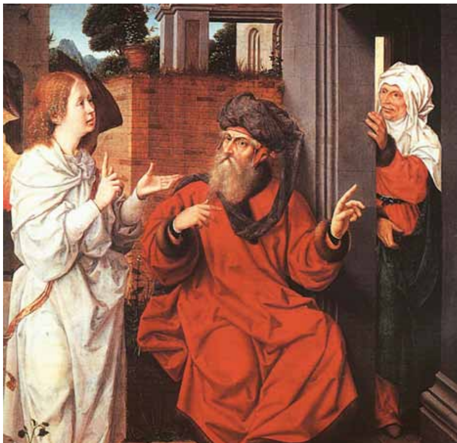
Jan Provost: Abrahám, Sára a anděl (1520).

místo tvorby spermií. Další nepříznivý vliv na kvalitu spermií mohou mít různé infekce, léky, chronické choroby atd. Pokud se nám podaří tyto negativní vlivy eliminovat, trvá cca 3 měsíce, než se kvalita spermií opět vylepší. Většina příčin snížené plodnosti u muže je léčitelná. Množství a kvalita spermií se dají zjistit pomocí spermogramu. Pro odběr spermií je však zapotřebí masturbace, což je opět morálně nepřijatelné. Mnoho mužů to takto vnímá a příliš toto vyšetření nevyhledává. Spermogram je ovšem relativní veličina, která neříká nic o příčině snížené plodnosti muže a různě se v čase mění. Z praxe víme, že normální výsledek spermogramu u jinak zdravého manželského páru nemusí vést k otěhotnění a naopak klidně dojde k otěhotnění u manželského páru se špatným výsledkem spermogramu. Pokud manželé chtějí jednat morálně správně a snaží se vyhnout se spermogramem spojené masturbaci, mají několik možností. Především vyloučit nejčastější příčiny neplodnosti u muže, které by mohly vést