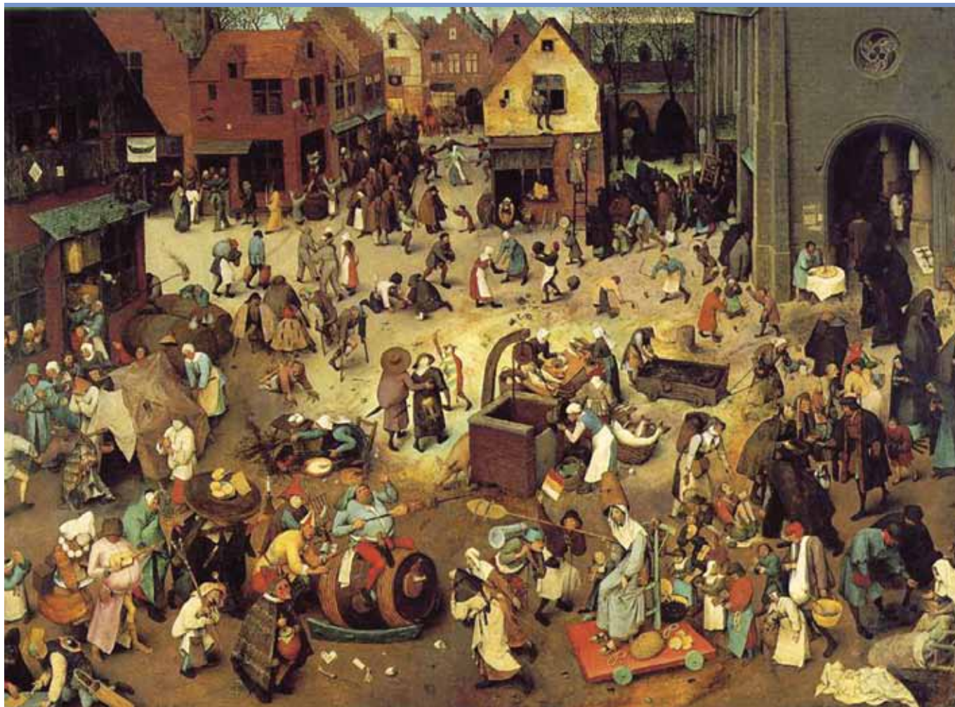
Pieter Bruegel st.: Zápas masopustu s půstem (1559).