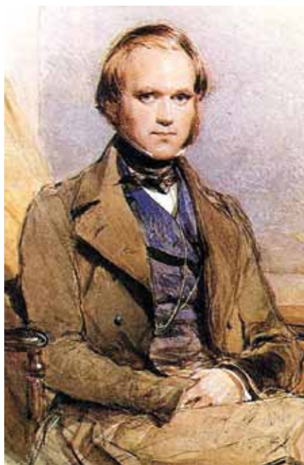
George Richmond: Portrét mladého Darwina (1840)

Od nejútlejšího věku byl Charles záněceným sběratelem všelijakých přírodních exemplářů a raději trávil hodiny ve své provizorní laboratoři v kůlně, než aby studoval latinské a řecké klasiky, považované za součást vzdělání dětí z jeho sociálních poměrů. Rovněž miloval lov. Proto nepřekvapí, že jeho školní prospěch nebyl nikterak slavný. „Nezajímáš se o nic jiného než střelení, psy