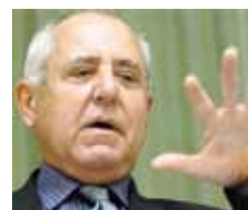
Autor je ekonom, politik a vysokoškolský pedagog.