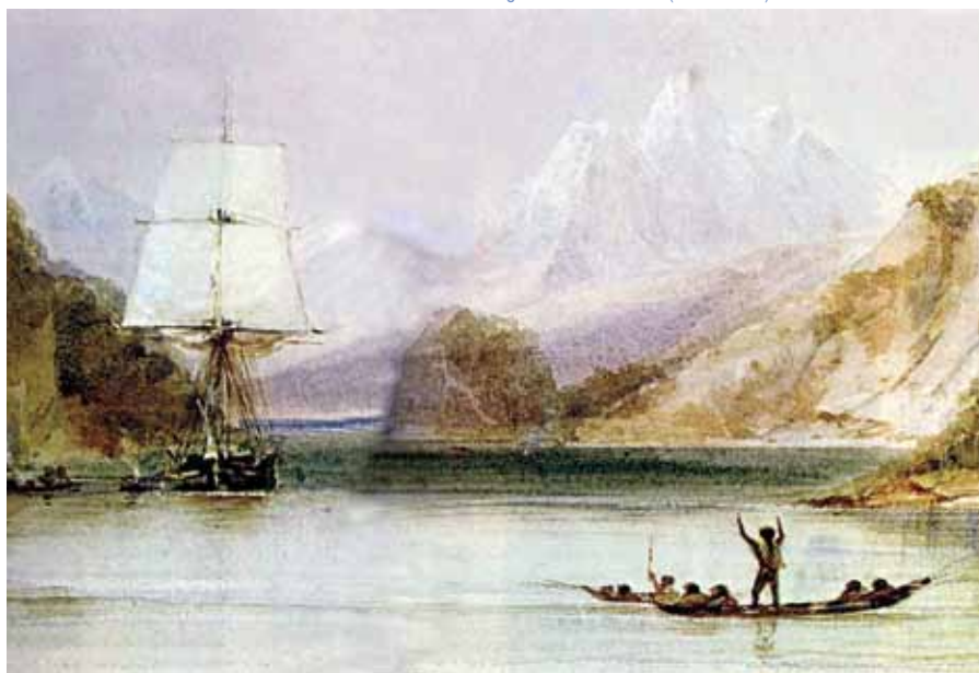
Conrad Martens: HMS Beagle u Ohňové země (1831–1836).

Darwin často nemocný a po obdobích skutečné tvůrčí exploze následovaly dny a týdny, kdy nečinně ležel v posteli. Rovněž v soukromém životě nebyl nikdy zcela šťastný. Z majetkových důvodů souhlasil se sňatkem se sestřenicí Emmou Wedgwoodovou; oddáni byli v lednu 1839. Své ženě se krátce po svatbě svěřil se svými pochybnostmi o křesťanství, materialismu a přesvědčení o transmutaci. Emma byla zpočátku šokována a cítila se pokořená a podvedená. Sama patřila k unitářům, kteří v té době měli daleko k jejich současnému synkretismu a byli, třebaže zvláštním, křesťanským společenstvím. Jeho členové byli hluboce přesvědčeni o posmrtných skutečnostech, tj. věčné spáse nebo věčném zavržení. A nebyla to obava o manželovu vědeckou prestiž, ale právě o jeho duši, která Emmu nikdy neopustila. I přes tyto problémy lze říci, že Darwinovi měli velmi pěkný vztah a měli spolu deset dětí, z nichž sedm přežilo kojenecký věk. Je paradoxem, že Darwin, který zformuloval svou nejznámější teorii o přírodním výběru, založenou na soutěži o přežití, ve které vítězí nejsilnější jedinci, měl prakticky všechny děti velmi nezuživé. Charles Darwin se obával, že to může být způsobeno blízkým příbuzenským vztahem jeho rodokmenu a rodokmenu jeho ženy. Vyjádřil to ve svých spisech v pojednáních o škodlivých ná-