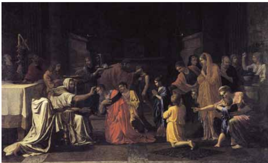
Nikolas Poussin: Biřmování. Z cyklu Sedm svátostí (1645).

do duše, a tím je křesťan, ozdobený svátostným charakterem, nástrojem v pravém smyslu slova. A pak mimo okruh svátostí dává charakter člověku možnost, aby vykonával úkony čistě křesťanské.