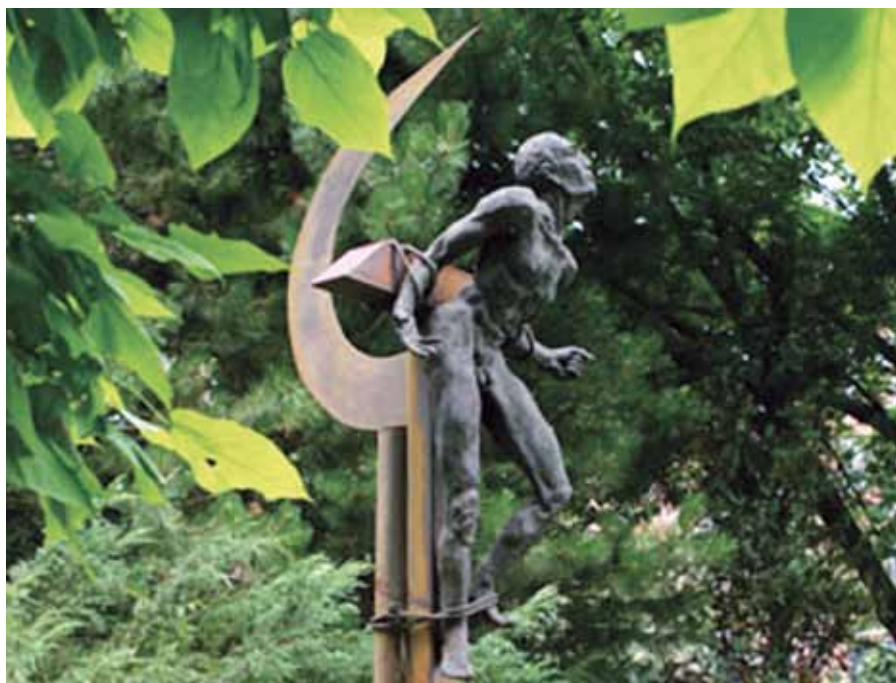
Památník obětem komunismu Josefa Ryndy.

A tak co jsme nedbalostí ztratili, získáme zpět postem a odříkáním. Obětujeme v odříkání svou duši, neboť není nic lepšího, co bychom mohli Bohu nabídnout, jak dovědčuje i prorok: Má obět', Pane, je zkroutěný duch, zdrčené srdce Bůh neodmítne.