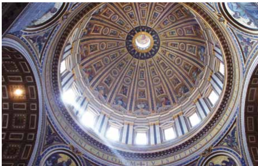
Tu es Petrus... Bazilika sv. Petra v Římě.

Kdo tedy s vírou sestupuje do této koupelie znovuzrození, odřiká se ďábla a spojuje se s Kristem; odmítá nepřitele a vyznává, že Kristus je Bůh, svléká otroctví a odívá se darovaným synovstvím; od křtu se navrácí jasný jako slunce a vyzařuje paprsky spravedlnosti; a co je nejdůležitější, stává se synem Božím a spoludědicem Kristovým.