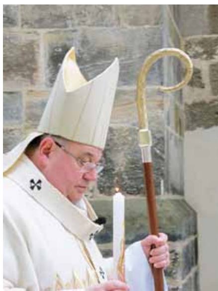
„Tak ať vaše světlo svítí lidem“ (Mt 5,16) Mons. Dominik Duka OP

Mons. Dominik Duka OP, arcibiskup pražský a primas český www.apha.cz