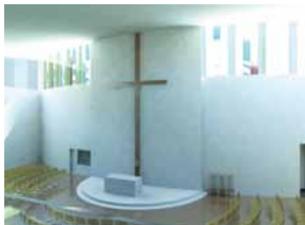
Ukázky studentských návrhů kostela na Barrandově

dají, ale jejich odpovědi se liší. Pravdou je, že Bůh chrám nepotřebuje. I Církev se bez chrámu obejde. Máme být chrámem duchovním, živými kameny. Otázka potřeby chrámu je otázkou po vlastnostech člověka, nikoli otázkou po vlastnostech Boha a zní takto: pomáhá nám posvátný prostor k tomu, abychom se sami stali chrámem duchovním, nebo nám v tom posvátný prostor naopak překáží? Zve posvátný prostor i ostatní, nebo je naopak odrazuje? Studenti architektury se domnívají, že pomáhá a zve.