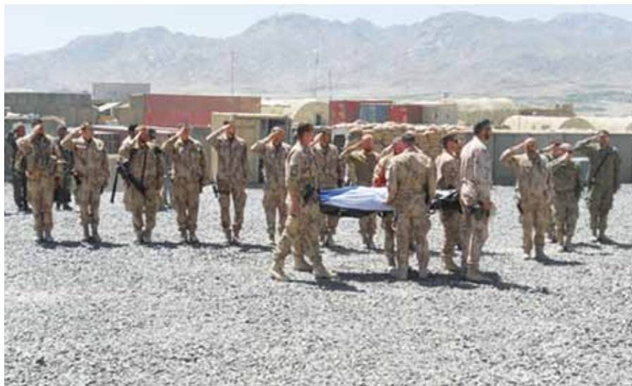
Převoz ostatků rotmistra R. V. z Afghánistánu.

Bylo to začátkem června, kdy v Afghánistánu padl další český voják. Již čtvrtý. Osobně jsem ho neznal, ale z doby svého působení v Afghánistánu jsem znal několik vojáků z jeho jednotky. Strávil jsem s nimi svůj první půlrok v Lógaru, a tak se mě jejich ztráta dotkla také.