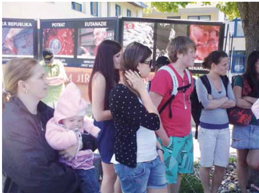
Diskuze se studenty Gymnázia Jiřího Ortena v Kutné Hoře.

Místo: Gymnázium Jiřího Ortena, Kutná Hora. Datum: 25. května 2011. Popis: Úžasný. Studenti na nás byli připraveni a chodili hromadně diskutovat i s učiteli na prostranství k výstavě. Ačkoli byl většinový názor pro potraty, byla vidět snaha o pochopení našeho vidění věci. Téma diskuze se dostalo i k eutanazii, sebevraždě, antikoncepci a intimním věcem patřícím do manželství. Vedení školy velice vstřícné, i když zástupce ředitele sám neměl úplně ujasněný názor. Dokonce od nás čekali přednášku. Zadáli studentům na toto téma písemnou práci.