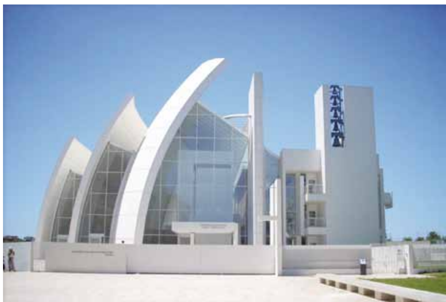
Jubilejní kostel Božího Milosrdenství, Řím (2003).