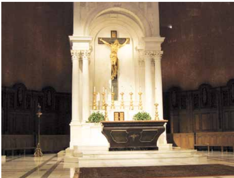
Oltář v katedrále sv. Cecílie, Omaha, USA (1905–1959).

tý vývoj, poznamenaný měnícími se kulturními a civilizačními okolnostmi, který nebyl vždy přímočarý či pozitivní – Kotas poukázal například na problematickou tendenci, k níž došlo na ne-latinských misijních územích (tj. zjednodušeně řečeno, za Alpami), kde většina účastníků bohoslužby přestala být schopna aktivně participovat na liturgickém slavení. To vedlo ke stažení liturgického dění do prostoru presbytáře (kde seděli ti, co rozuměli), k přesunu oltáře k samé stěně apsidy a tím k „vyšachování“ lidu do pozice přihlížejících, nikoliv aktivních účastníků liturgie. S postupem doby rovněž začal získávat na významu svatostánek jakožto místo uchování proměněných hostií, tedy místo, kde je Bohočlověk Ježíš Kristus reálně fyzicky přítomen.