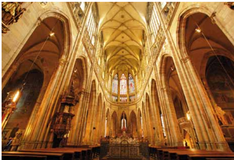
Katedrála sv. Vít, Václava a Vojtěcha, Praha (930–1929).

Církev se v liturgii spolu s Kristem a v Kristu zaměřuje k Bohu Otci. Liturgický prostor má toto transcendentní zaměření bohoslužby vyjadřovat.