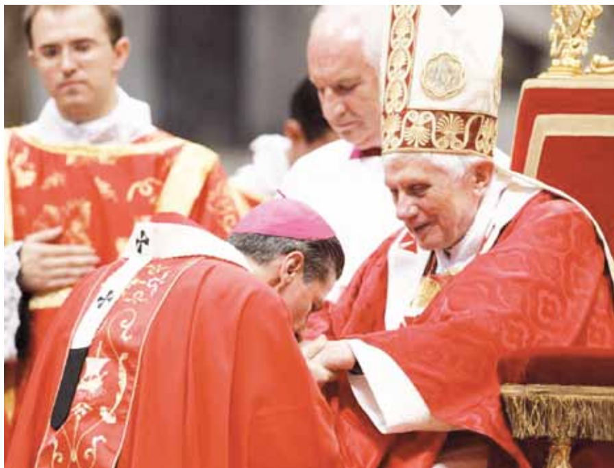
Benedikt XVI. při předávání pallia novým arcibiskupům.

Metropolitním arcibiskupům, kteří byli jmenováni po poslední slavnosti těchto velkých apoštolů, je nyní předáno pallium. Co to znamená? Připomíná to pře-