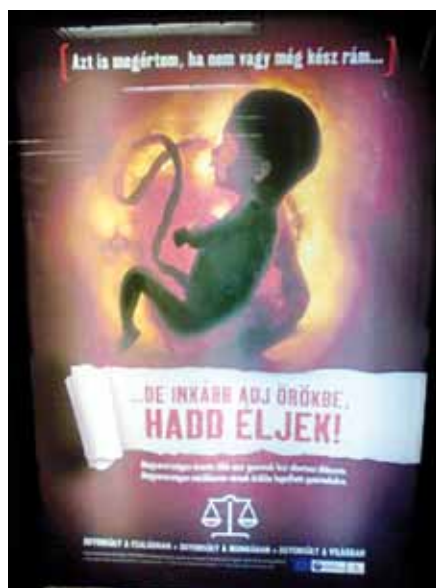
„Nechte mě žít!“ aneb zneužití evropských dotací

děti udělat veřejně prospěšnou zdravotnickou službu. Švédské zákonodárce už vystrašili do té míry, že tamní parlament poměrem hlasů 271 : 20 schválil rezoluci, která odsuzuje dokument Parlamentního shromáždění Rady Evropy z října 2010, podporující právo lékařů na výhradu svědomí. Jak uvedl John Smeaton z britské Společnosti na ochranu nenarozených dětí, švédské hlasování ukazuje,