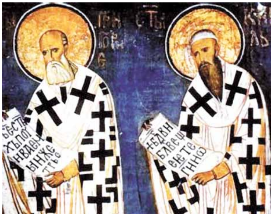
Svatí Cyril a Metoděj.

Opásejme se tedy vírou a konáním dobrých skutků, a pod vedením evangelia chodme po jeho stezkách, abychom jednou mohli uvidět toho, který nás povolal do svého království. Chceme-li přebývat ve stanu jeho království, musíme se spěšně ubírat cestou dobrých skutků, jinak tam nedojdeme.