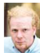
PhDr. Tomáš Sedláček, český ekonom, vysokoškolský pedagog, hlavní makroekonomický stratég ČSOB