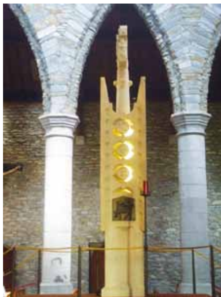
Svatostánek v katedrále P. Marie, Killarney, Irsko (1981)