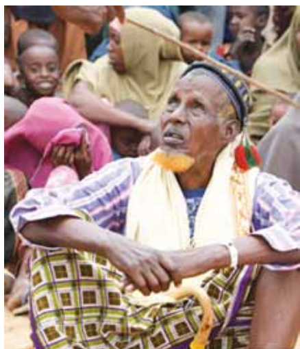
Somálští uprchlíci v Keni.