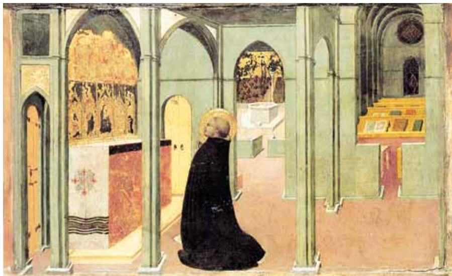
Stefano di Giovanni: Svatý Tomáš inspirovaný holubicí Ducha Svatého (1423).

Tomášovo hledačství Boha přinášelo nadlidské výsledky při psaní, vyučování, kázání. Dodnes jsou mnozí přitahováni jeho argumentací, intelektuálním životem. Jiní prostotou a tichou pokorou.