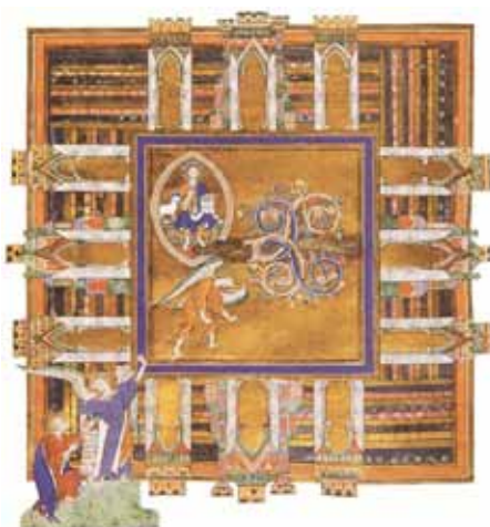
Nový Jeruzalém (manuskript, Londýn, 1255)

Autor používá obraz Evropy jako osoby, která trpí řadou neduhů, takřkajíc je „na smrt nemocná“, a je na nás, jestli se rozhodneme podstoupit nutnou změnu životosprávy a léčbu. Od takovéhle představy je jen krok k tomu takovou změnu pacientovi naordinovat a vnutit. Toho se dost bojím. Připusťme tento obraz, pak ale je třeba ukázat jinou reálnou variantu, že by se tato „nemocná“ Evropa například vydala na pouť do Lurd. Dovedu si představit, co obnáší uzdravení: že se věci vrátí do stavu, ve kterém mají být. A to ví nejlépe Bůh, který záznaky na mariánskou přímlovu „dělá“. Ale co je zdraví Evropy ve slovníku autora? Objasní nám to? Vůbec ne. Pokud někdo mluví o nemoci Evropy, měl by o tom načrtnout alespoň základní představu – pokud není přesvědčen, že se čtenáři sdílí rámcové obrysy takové představy. A mám dojem,