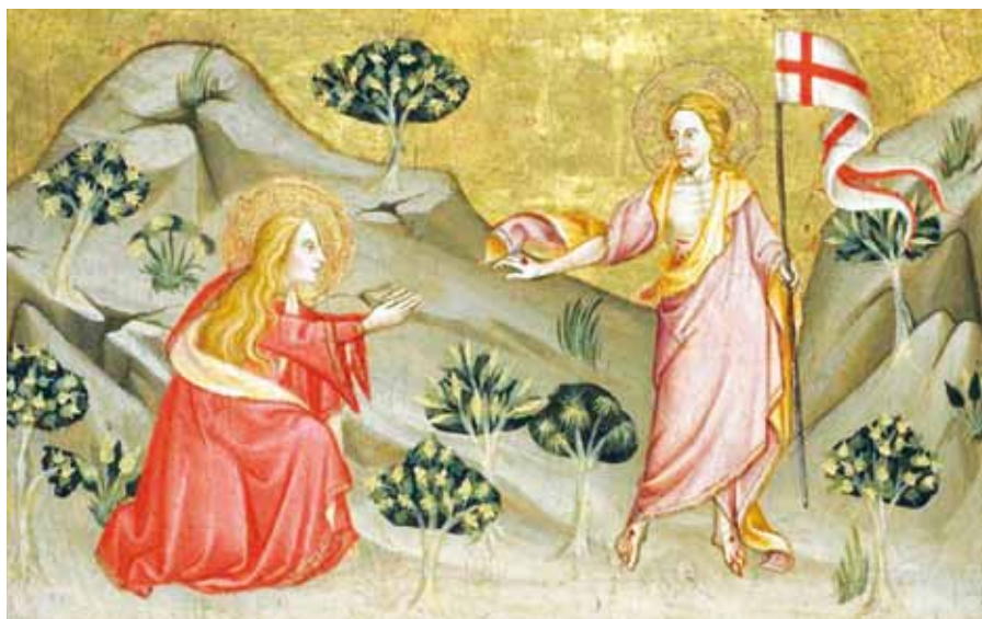
Antonio da Attri: Noli me tangere (14. stol.).

Když nám Bůh daroval svého Syna a neušetřil ho, aby nás ušetřil, daroval nám zároveň s ním všechno dobré: milost, lásku a ráj. Když ani vlastního Syna neušetřil, ale vydal ho za nás za všechny, jak by nám s ním nedaroval také všechno ostatní?