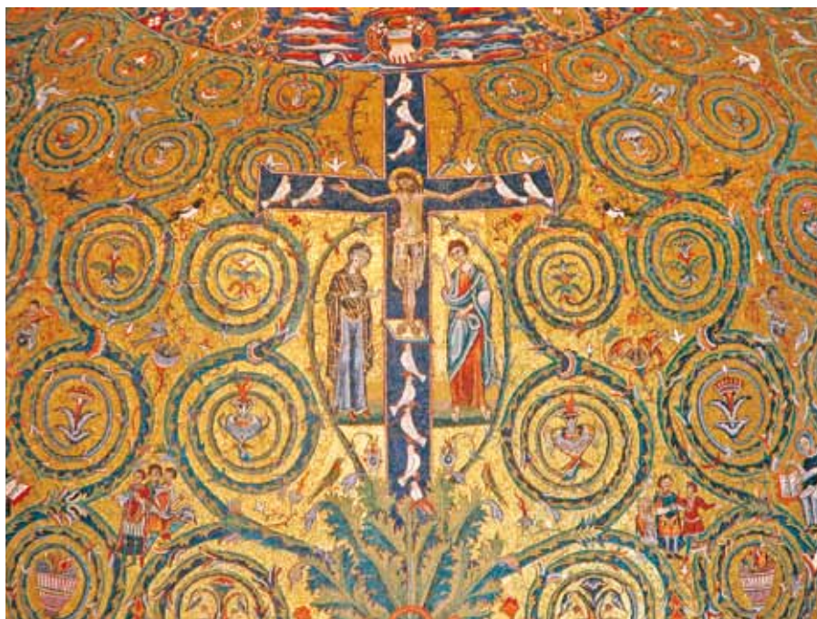
Kříž jako strom života. Apsida baziliky sv. Klimenta v Římě (12. stol.).

Pokud má skupina lidí absolutní hodnotu, nebo alespoň takovou, kterou uznává většina, pak je skutečnou společností; chybí-li takový prvek jednoty, jedná se o množinu jednotlivců (s jejich individuálními hodnotami), nápadně připomínající částice v nepravidelném Brownově pohybu.