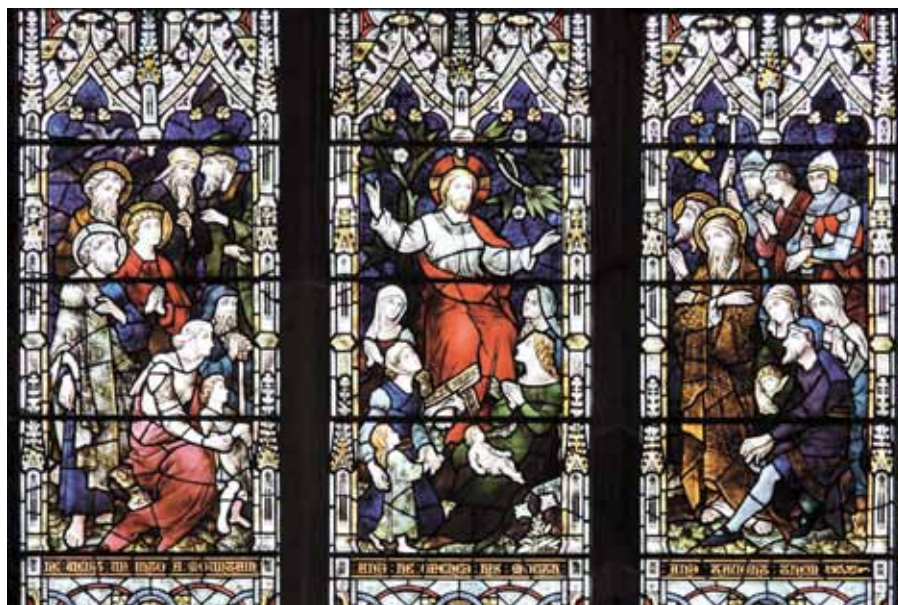
Kázání na hoře. Opatsví: Tewkesbury (14. stol.).

Jak se tedy odvděčíme Hospodinu za všechno, co nám prokázal? On je tak dobrý, že nežádá žádnou náhradu za to, co nám dal. Má dost na tom, že ho za to, co nám dal, milujeme. Mám-li říci, co pocituji, když o tom všem uvažuji, zmocňuje se mě hrůza a strach: bojím se, že jsem svou duchovní nerozvážností a utrácením času na zbytečnosti ztratil Boží lásku a že Kristu dělám jen samou hanbu.