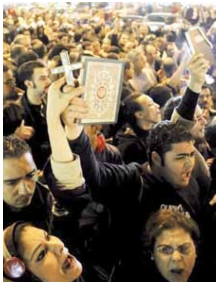
Egyptští křesťané a muslimové společně pozvedají Korán a kříž na protest proti teroristickému útoku na koptské křesťany.