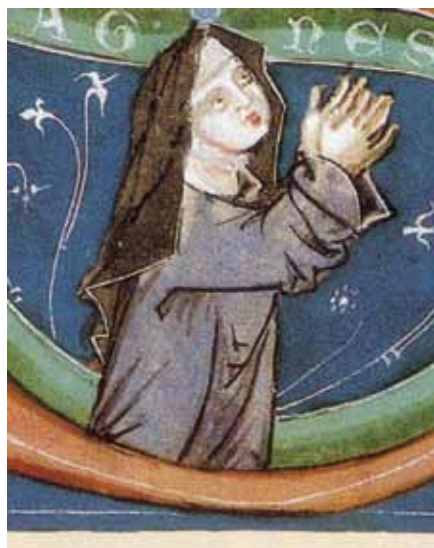
Svatá Anežka Česká. Osecký lektionář (2. pol. 13. stol.)

Svatá Anežka byla ženou, která prožila mnohem těžší období v dějinách této země, když dochází k těmto sporům ve vlastní rodině, uprostřed královské dynastie. Je to ona, která přivede ke smíru svého bratra, ale i svého synovce, vel-