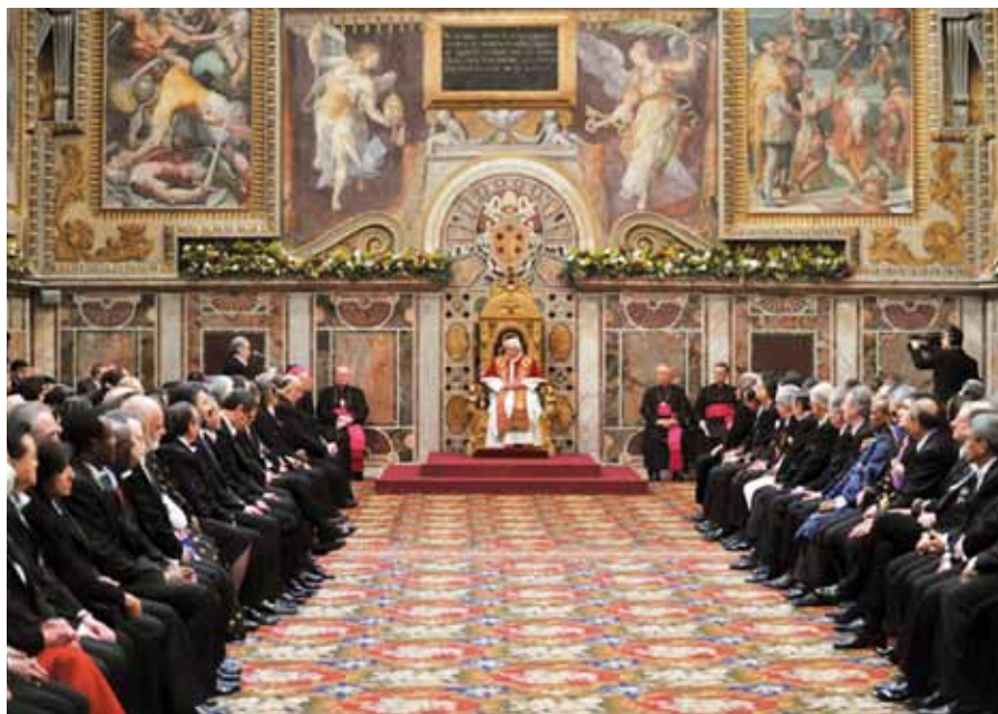
Benedikt XVI. na setkání s diplomatickým sborem.

Novoroční setkání Benedikta XVI. s diplomatickým sborem