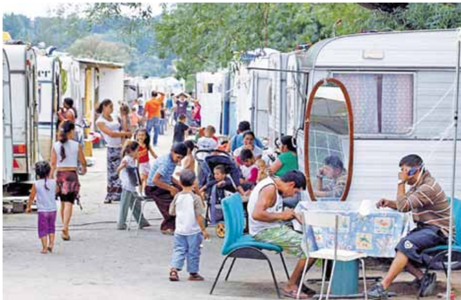
Romský tábor ve Francii.

prostým selským rozumem musí být každému jasné, že vnímání termínu následuje (podřizuje se) vnímání pojmu, a nikoli naopak. Proto například nic nepomáhá přejmenování osob s výrazně sníženým IQ (historicky postupně: slabomyslní – idioti – retardovaní – osoby s mentálním postižením), přestože s každou další změnou si její protagonisté slibovali vysvobození těchto osob ze „stigmatizace“ spojené s používáním dřívějšího termínu. Výsledek? Nepomáhá to: dnes si děti na ulici nadávají do „postižených“. A naopak termín, který dříve v minulosti označoval něco opovrženého, např. „herečka“, se v důsledku změny vnímání pojmu (nikoli termínu!) stal velice prestižním označením lidské profese.