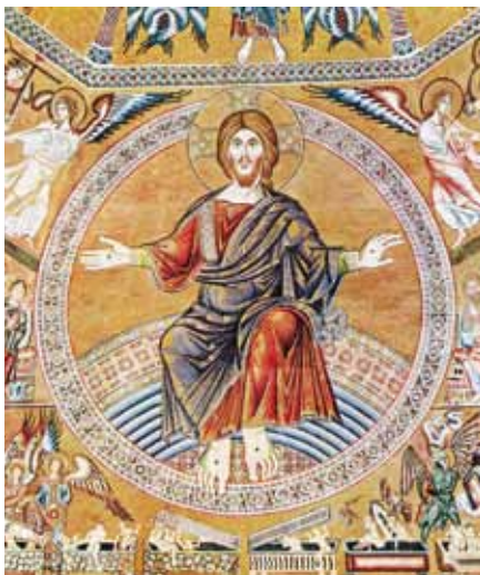
Kristus Pantokrator, Florencie (ca 1300)

K ohrožením současného světa se před nedávnem vyjádřil Vatikán. A to na nejvyšší úrovni. Šéf papežské diplomacie, arcibiskup Dominique Mamberti, navštívil New York a promluvil na fóru plenárního shromáždění OSN. Mluvil o těch, kdo mají peklo na zemi už nyní. Kvůli neschopnosti svých vlád či následkem přírodních katastrof. V podstatě ale také naší vinou, protože mezinárodní společenství nezasahuje. Připomněl důsledky odlidštění ekonomiky zbavené etiky, které se projevují v současné krizi. Zdůraznil, že hospodářství nemůže být autonomní sférou, řízenou výlučně pravidly trhu, nebo co horší, dohodami mezi mocnými, kteří se mezi sebou dělí o zisky. Papežský diplomat upozornil také na stále rozšířenější pohrdání člověkem a jeho právy, jak se to projevuje také v porušování náboženské svobody. Trpí tím hlavně křesťané, právě oni jsou největší náboženskou skupinou pronásledo-