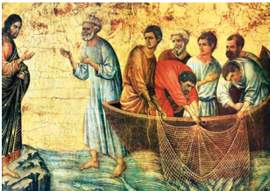
Duccio di Buoninsegna: Zjevení u Tiberiánského moře (ca. 1311).

Takže je zřejmé, že kdyby neviděli Ježíše zmrtvýchvstalého a kdyby se jim nedostalo přesvědčivého důkazu jeho moci, nebyli by se rozhodli pro tak veliké dílo.