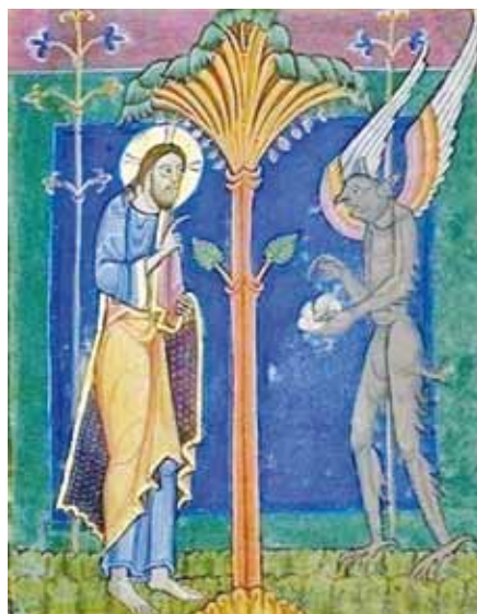
Pokoušení Krista, Žaltář ze St. Albans (1120–1145)

Rodič: Ano. A ďábel stejnou metodou pokouší všechny lidi. I Pána Ježíše. Zkusme si to rozebrat. Už víš, proč Pán Ježíš přišel na svět.